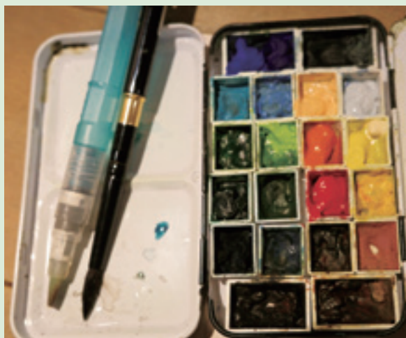
隨身攜帶的水彩畫筆、顏料及調色盤。