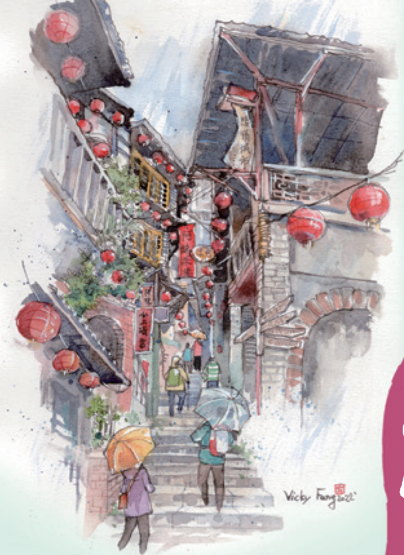
九份老街 方雯瑩 Vicky Fang繪