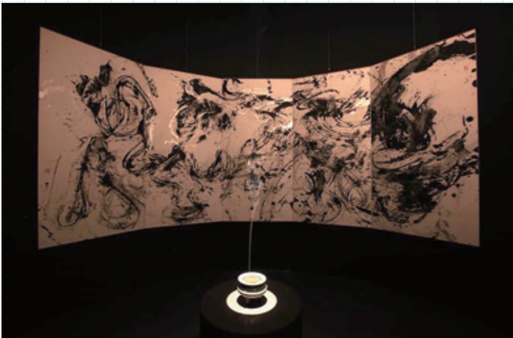
徐永進〈氤氳象〉西元 2019 年裝置藝術。