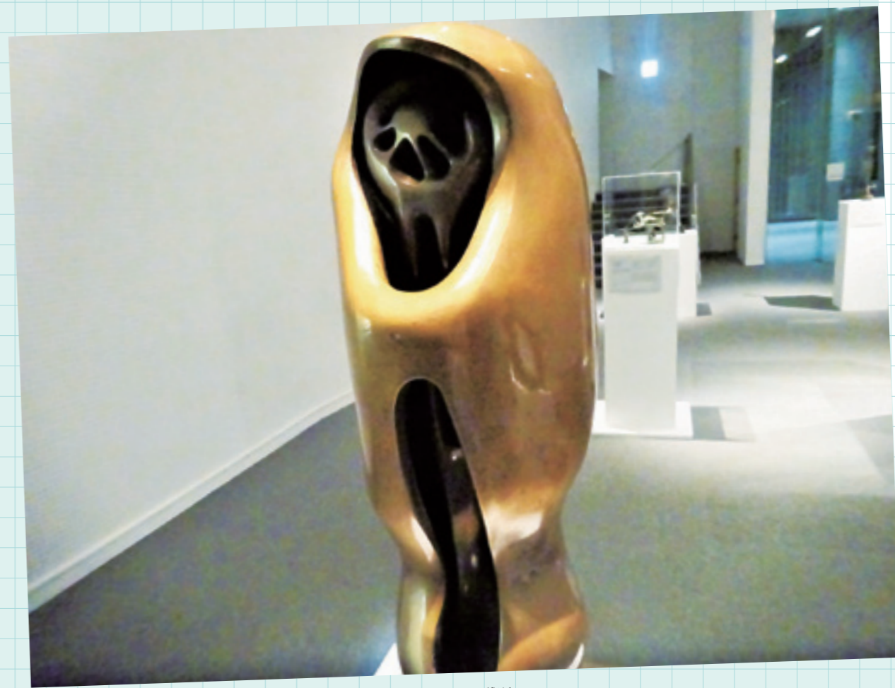
亨利摩爾 〈內部形狀與外部形狀〉 西元1951年 青銅 箱根雕刻之森美術館。

盪。建築師/水墨畫家陳其寬，50年代正在美國的麻省康橋任建築師事務所設計師，從小就寫書法的他，對於獨領風騷的抽象表現主義，不但躬逢其盛且早已心領神會，一幅〈母與子〉（西元1952年）水墨畫，他以英國雕塑家亨利摩爾（Henry Spencer Moore）的〈頭盔〉（西元1939年）或〈內部形狀與外部形狀〉（西元1951年）的虛實空間為造型意象，巧妙結合書法書寫性的線條，創造出如符號般簡潔的圖象，