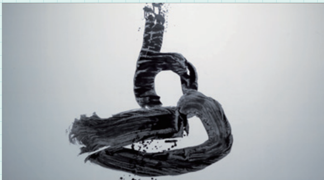
井上有一 〈鳥〉 書法。

國的克萊茵、波洛克等知名藝術家，同登國際競技舞台，受到國際藝術的高度矚目。西方抽象表現主義的思潮，激活了日本現代書法的蛻變，締造了書道的革命，使書法脫胎換骨為繪畫性藝術。