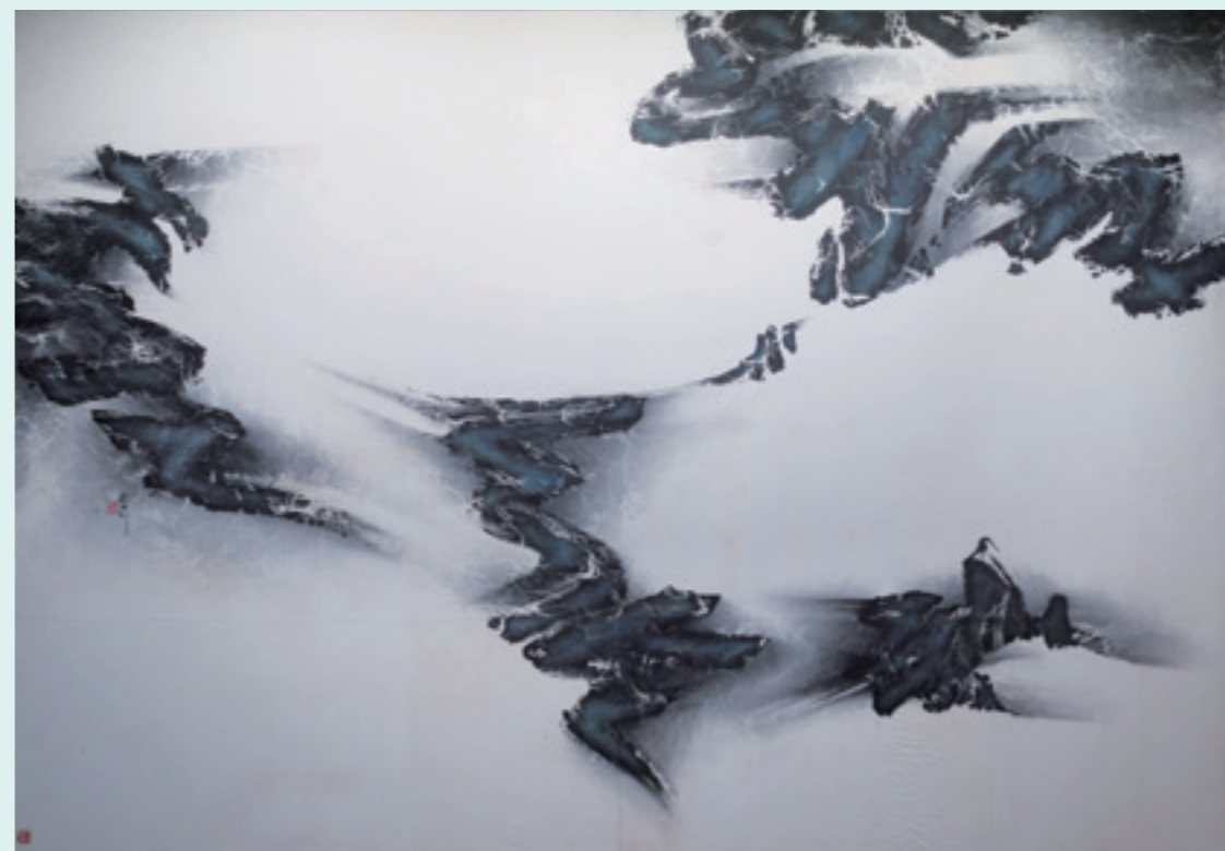
劉國松 〈宇宙即吾心〉 水墨。

直到 90 年代初,臺灣的「墨潮會」以先鋒的姿態,反叛傳統書法,結合西方現代藝術,系列探討書藝的文字表現、圖像表現、記號表現、行為表現、觀念表現、