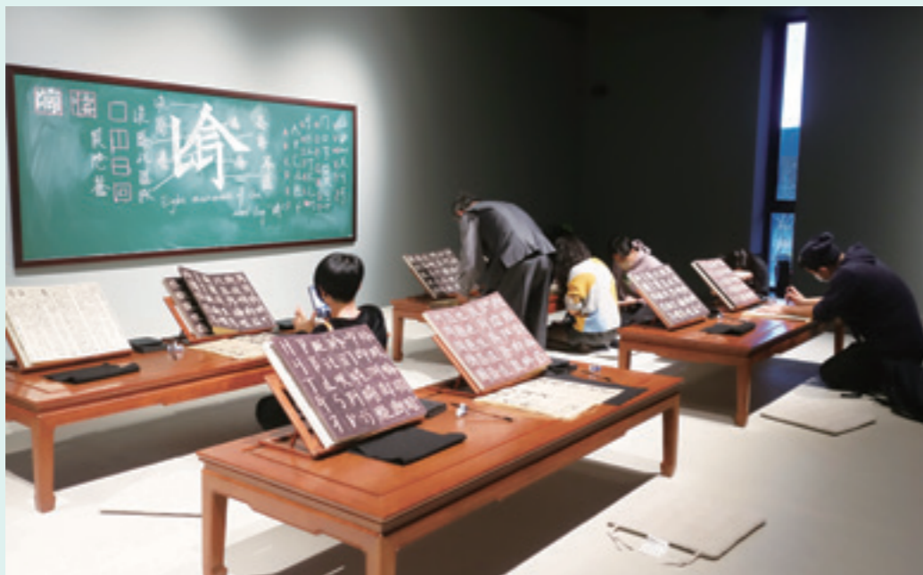
徐冰〈英文方塊字書法書房—古典版〉西元 2021 裝置藝術。

如果從建築來看，巴黎的龐畢度藝術文化中心 (Centre Georges-Pompidou)，宛如一座尚未完成的鷹架建築工程，所有的鋼架、各式管道、自動電扶梯、鋁窗，錯縱複雜地交織在戶外，彷彿永遠在興建中。而華裔建築師貝聿銘的羅浮宮博物館 (Musée du Louvre) 玻璃金字塔，以高科技的現代媒材鋼、玻璃構築透明潔淨的幾何形