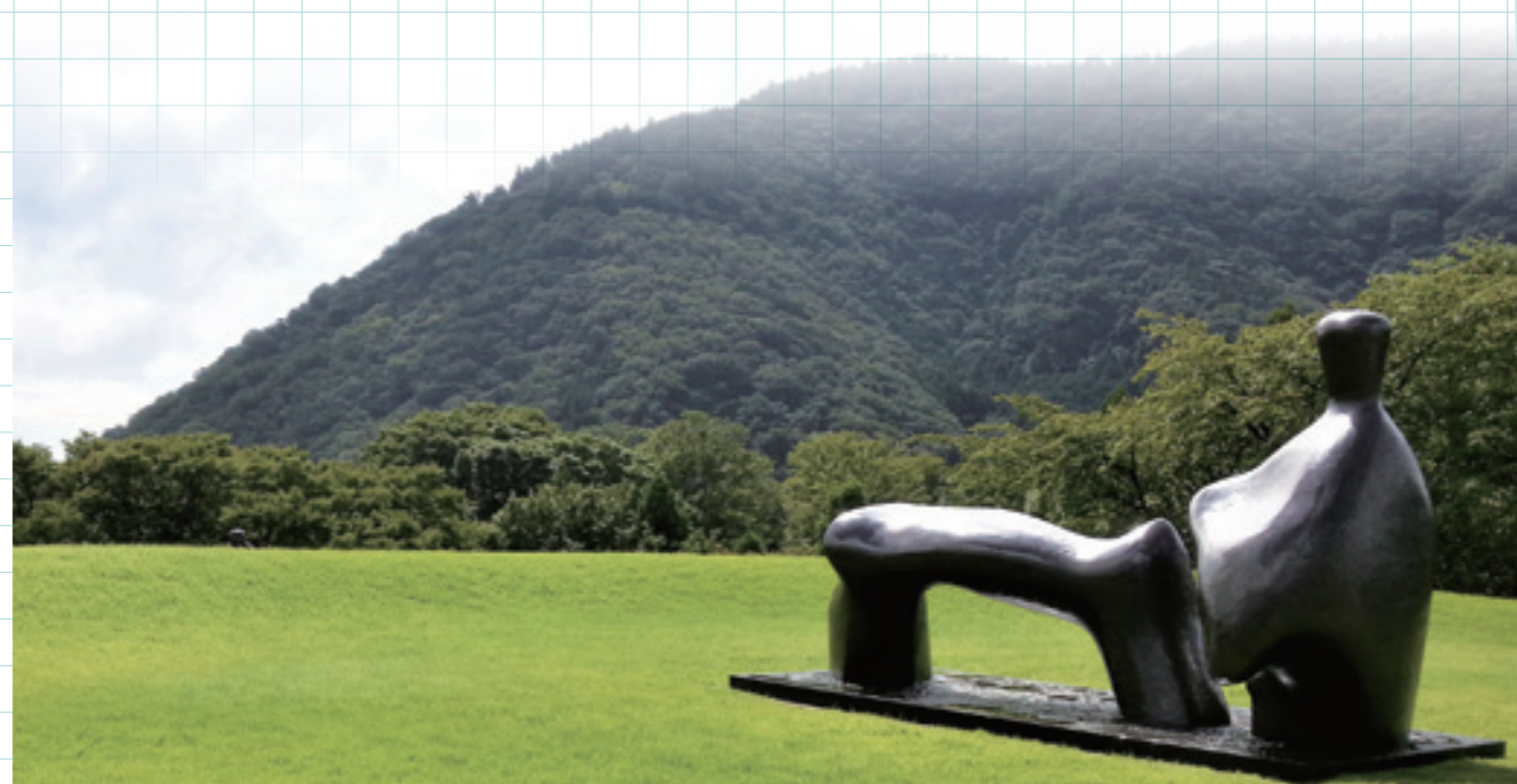
亨利摩爾〈橫臥像〉西元 1969-70 年 青銅 箱根雕刻之森美術館。

這件蘊含著東方書法的偶發性、一次性書寫，筆酣墨飽的〈愚徹〉，竟在西元 1957 年聖保羅國際美展 (Sao Paulo Art Biennial) 時，與法國的蘇拉吉、哈同；美