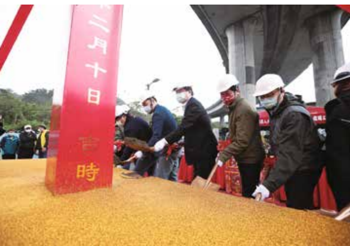
市長林右昌主持「西岸人行路廊景觀空間環境改善工程」開工動土典禮。

究的林右昌市長，從小就有著雙魚座的浪漫情懷，對於城市面貌的改變有著理想。就任基隆市長的期間，用巧手為基隆抹去了灰暗老舊的城市印象，為基隆穿上彩色的新裝。不管是打卡熱門地正濱漁港彩虹屋，還是穿越千年的大基隆歷史場景再現，林右昌彷彿一位畫師，在草稿中的基隆上點綴色彩，每個筆畫的結合，造就出許多亮點；不斷讓遊客重新認識基隆，連在地人也讚不絕口，甚至可以親自投入，成為城市改造的實踐者之一。對於協和發電廠的更新擴建，林市長期待未來電廠設計能夠融入地景環境，發揮想像力，將又高又突兀的煙囪改造成新的市民記憶點，規劃並開放廠區成為基隆的亮點公園，拉近與民眾的距離，讓協和發電廠成為台電電廠中，綠化、低碳又可親的電廠。