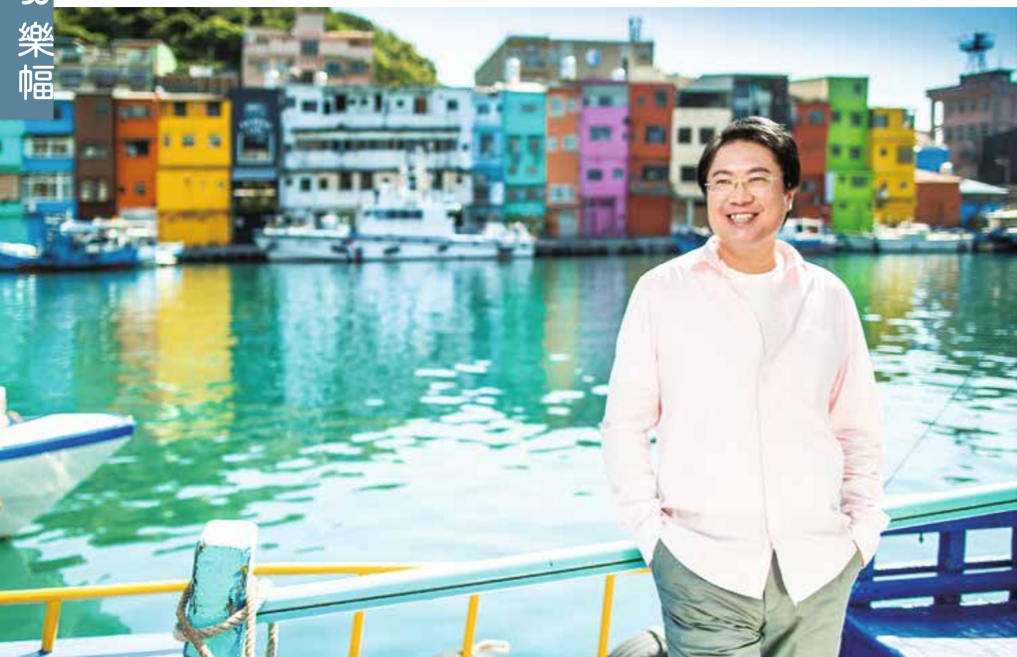
在林右昌市長的創意揮灑下，基隆市景添上了活潑的色彩。