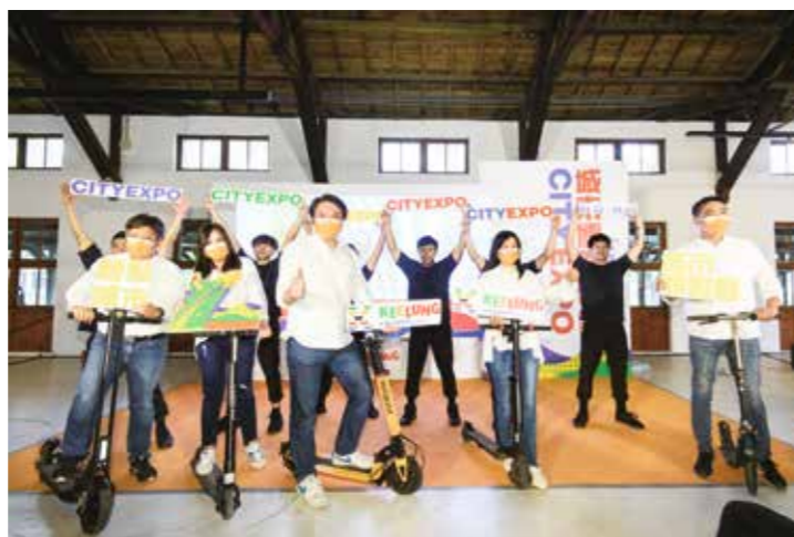
林右昌市長親自開箱介紹基隆「山、海、城」3大特色，邀請大家一起參與基隆城市博覽會。

基隆過往的歷史，在林右昌市長任職基隆 7 年多的時間裡，不斷地被挖掘、被看見，正如即將展開的基隆城市博覽會，