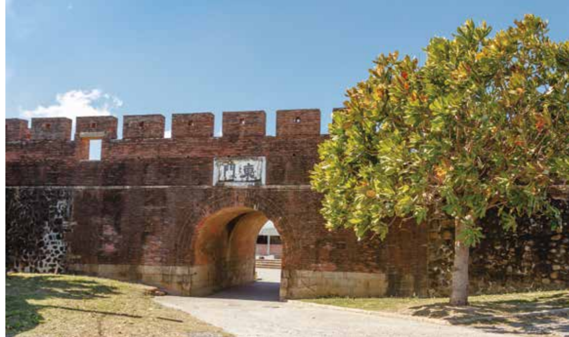
恆春東門是恆春古城保存最為完整的城垣遺跡。