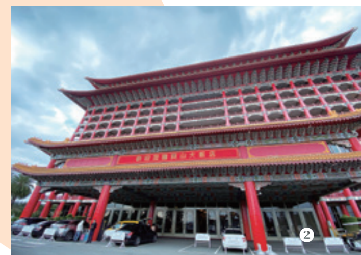
① 藏身飯店中的秘密通道。