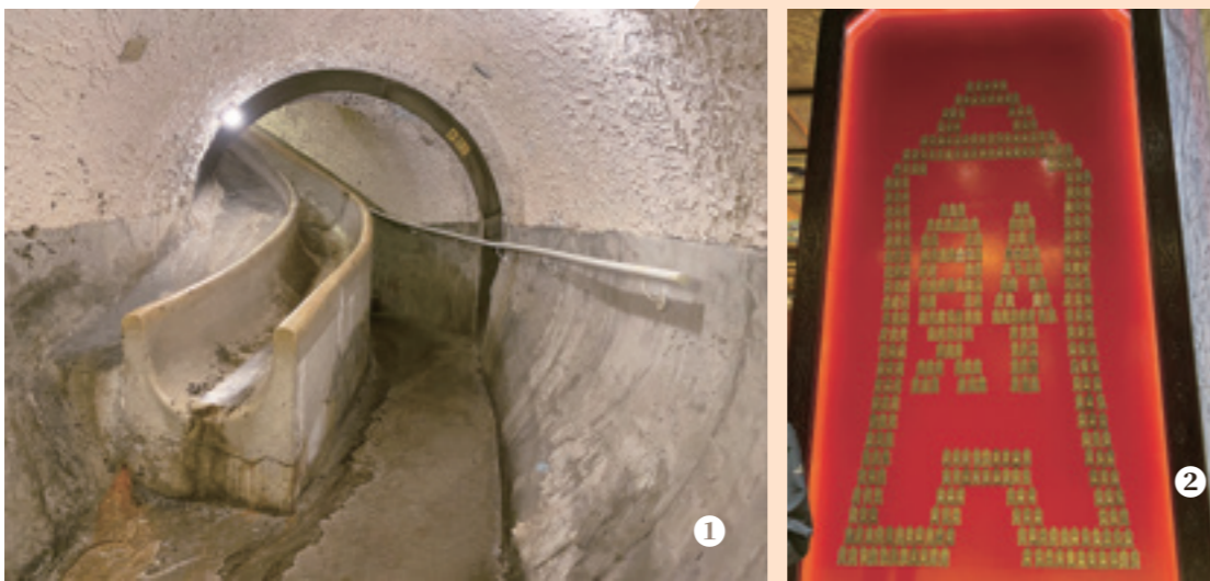
① 密道以磨石子為底，通道類似溜滑梯。 ② 以西漢錢幣貨布為造型的房鑰，十分具有特色。

導覽終站為圓山文創館，在這裡能購買飯店相關的伴手禮，也可以蓋上紀念章，剛好可以把今天購票贈送的紀念明信片拿來蓋章收藏。圓山的歷史與壯麗，更是吸引許多文創產業業者選在圓山發表新作品，看好的就是圓山富有歷史的宮殿造型。在文創館裡有販賣許多文創品，有興趣可以參觀選購，看看是否能感受這些文創品賦予的意義—告別君王的色彩，新創也正在為圓山締造其新的時代意義。