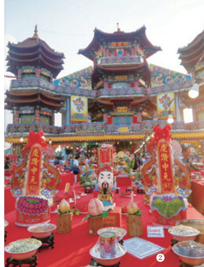
① 動物、人物造型的米雕作品。 ② 熱鬧的中元祭，連桌上豐富的米雕及普度用品，滿載著濃濃的人情味。

公廟對面的「主普壇」參天聳立，市區街道則掛起一盞盞的紅燈籠，民眾也忙著採買各式供品，以往「陰陽兩隔、人鬼殊途」的鬼月氣氛和禁忌，早被豐盛的供品及熱鬧的祭典活動所取代。