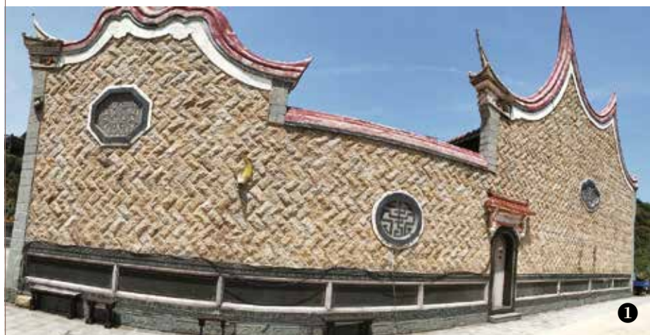
① 廟宇不同型式的封火山牆。

旅遊書中對馬祖的介紹有一句形容最美麗而動人：馬祖列島是上天灑落在閩江口外的一串珍珠—就地理位置而言確實如此。由馬祖列島沿海岸線躍島北上，可抵大陸浙江的舟山群島；向南逐島通過大陸福州的平潭列