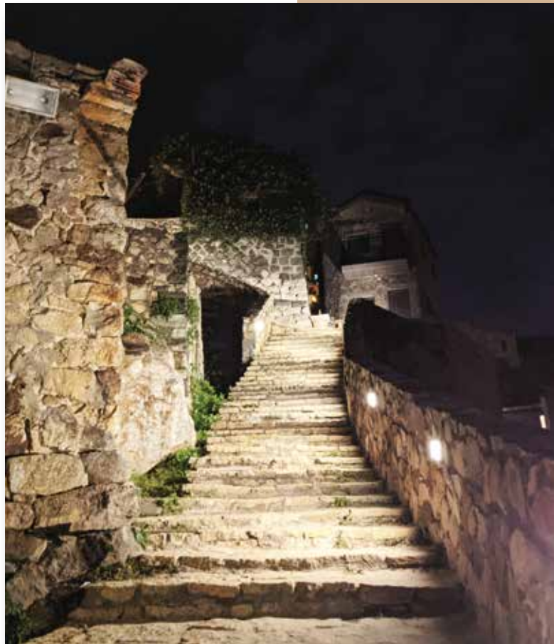
馬祖津沙村

母親的名，叫做臺灣 這裡有我們共同成長的記憶 請您疼惜這款情 來寫臺灣的故事 臺灣很美 人民善良、勤奮、堅強、樂觀 這裡是我們生長的地方 是咱永遠的故鄉