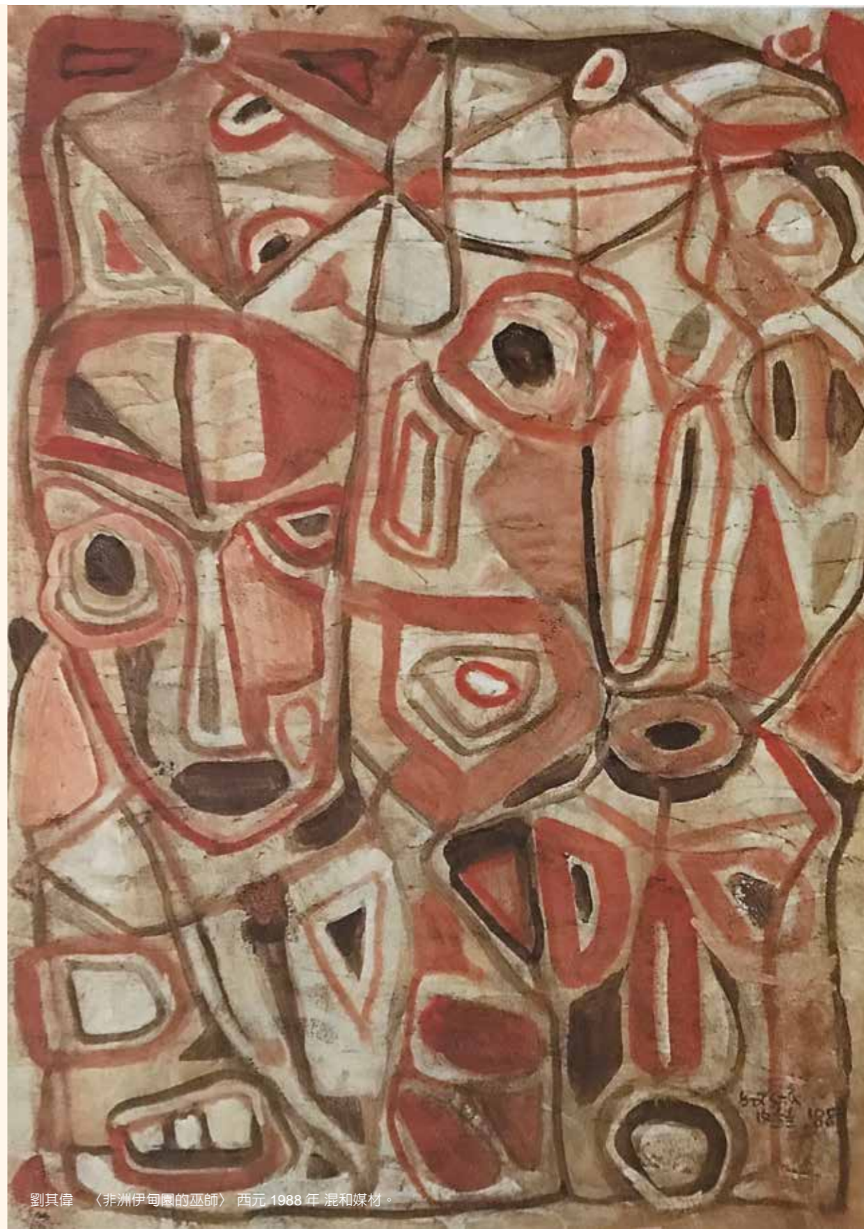
劉其偉 〈非洲伊甸團的巫師〉 西元 1988 年 混和媒材。

劉其偉在血腥的殺戮戰場中，卻也感受到戰爭的魅惑生命力，他說：「今天不知道活不活得過明天，美金、醇酒、美人，那滋味真夠刺激！」亡命之徒大把大把的