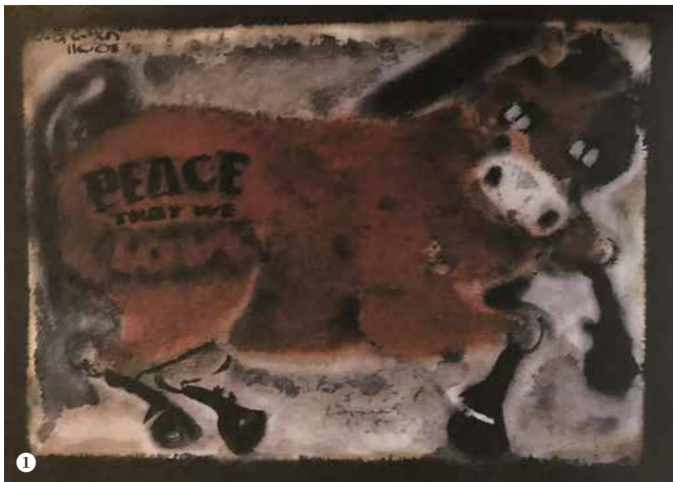
① 劉其偉 〈和平馬〉西元 2001 年 混和媒材。 ② 劉其偉 〈伊索比亞的饑荒〉西元 1988 年 混和媒材。

Man at the Bridge) > 裡一位 76 歲的老人，在西班牙內戰猛烈開打時，他卻沒有隨著家人倉皇逃走，反而沉著自若留下來，為了照顧 4 隻鴿子、2 隻羊和 1 隻貓，流露人性永不變質的愛與關懷。此外 <一個乾淨、明亮的地方 (A clean, well-lighted place) > 裡一位 80 多歲的老人，在一間咖啡店外燈光穿透的樹下，待到深夜不去，他雖然受到侍者的出言不遜，譏笑他自殺沒死殊為可惜，但老人仍感謝他來倒酒，並給予小費。老人所以在店裡久坐不去，只因為眷戀店裡那份難得的潔淨與光亮，即使行將朽木，他仍須活得像個人，在暗黑的暮