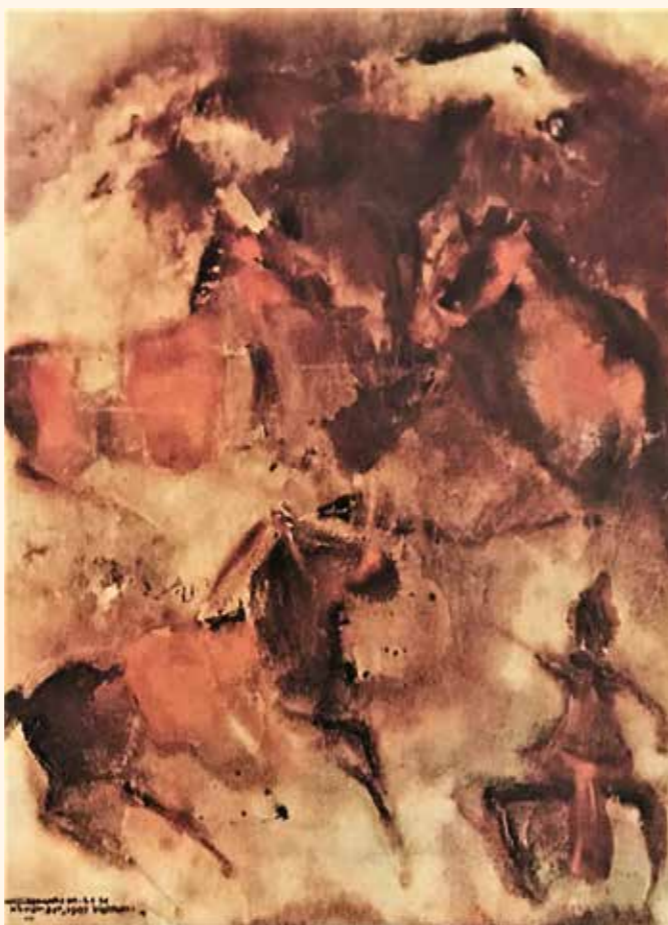
劉其偉 〈戰爭前夕〉西元 1967 年 水彩。

然而老人卻沒命喪大海，他始終抱持著積極奮鬥的態度，他重視的是生命的過程，雖然那過程像是海上的布施大典。他拖回來的不只是一副大魚的殘骸，還有自己的生命尊嚴。只因他堅持「他可以被摧