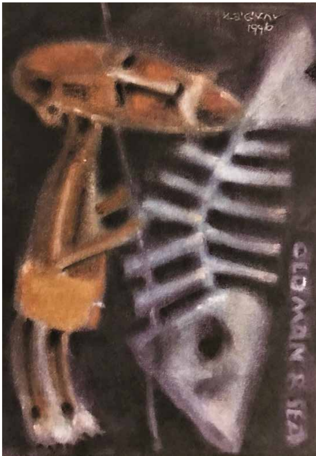
劉其偉 〈老人與海〉 西元 1996 年 混和媒材。