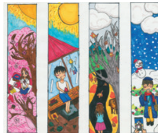
▲ 電廠煙囪的彩繪，讓孩子發揮他們無限的想像力。

每件作品都說著不同而美好的故事，我們細細的品味，用心地聆聽，咀嚼著孩子們對未來的想像以及對電廠的期待，小心翼翼的將這份珍貴放進心中，想著如何將這份特別的禮物留在電廠的煙囪之上，讓這份真切的情感永遠連結這片土地上的每一個心跳——是電廠的脈動，是城市的律