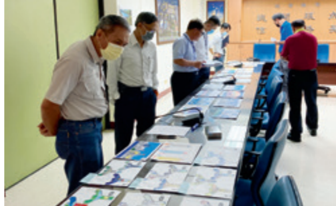
▲ 南部發電廠評選畫作。

電廠的煙囪，在孩子的筆下爭奇競紛——有輕軌穿越捎來綠意；有八五大樓高聳豎立；有高雄展覽館在旁爭艷；有夢時