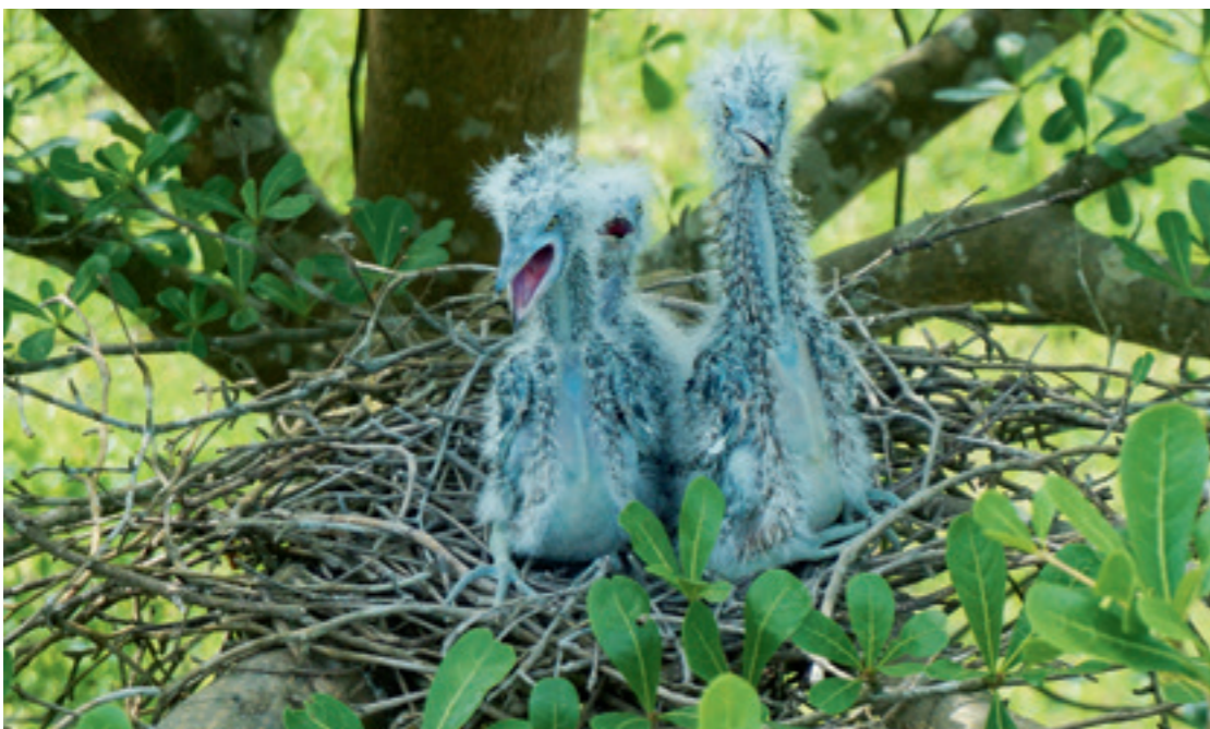
▲ 黑冠麻鷺幼鳥悠閒的棲身在中寮開閉所內。

可以，我們或許也可以試試看，就開始有了構想，利用震災修復後大門旁邊的坡地，大概種了將近一百棵的光臘樹，經過幾年成長期，開始有獨角仙出現聚集。頭幾年每到 5 到 7 月，每一棵樹上都有幾十隻的獨角仙芳蹤，所以就決定讓獨角仙成了我們中寮開閉所的獨有的代言人動物。