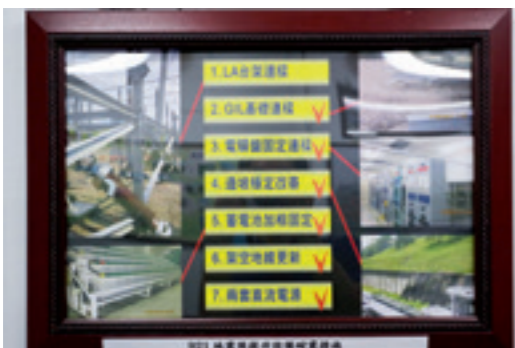
▲ 中寮開閉所導入多項改善措施，將地震受害降到最低。