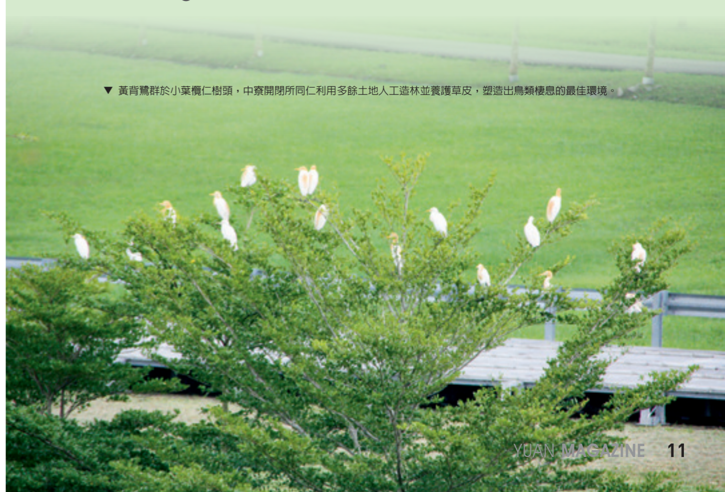
▼ 黃背鷺群於小葉欖仁樹頭，中寮開閉所同仁利用多餘土地人工造林並養護草皮，塑造出鳥類棲息的最佳環境。