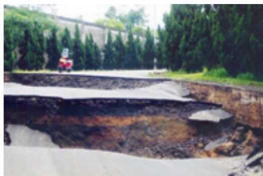
▲ 921 地震後，中寮開閉所前道路完全場陷，對外連結幾乎中斷。