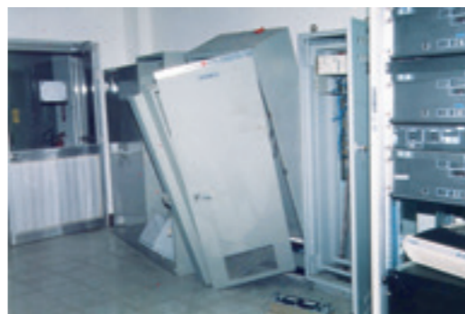
▲ 中寮開閉所控制室內的電氣設備控制箱，經過 921 的震撼後已經歪斜倒地。