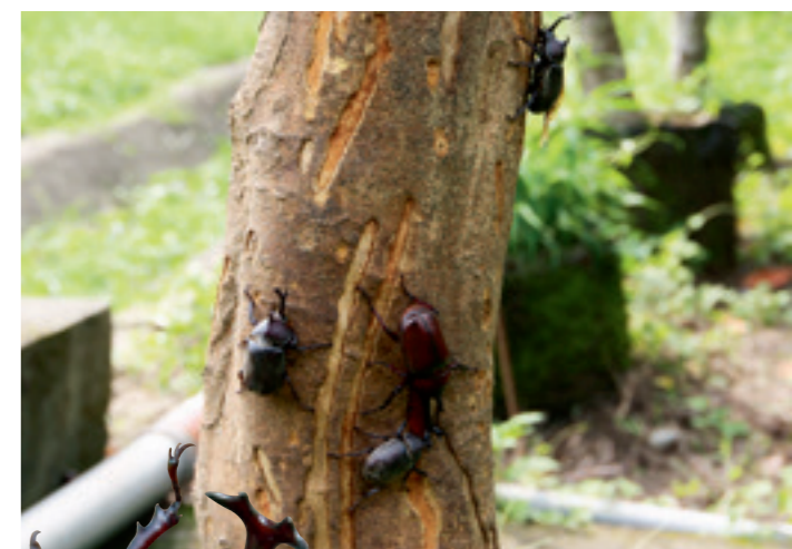
▲ 孕育有成的獨角仙生態，是中寮開閉所重要的生態亮點之一。