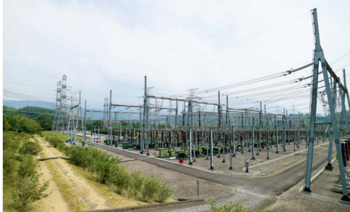
▲ 中寮超高壓開閉所南開關場，為中部最重要電力樞紐。

中寮超高壓開閉所座落在南投縣中寮鄉山野林蔭間，四周圍環繞著的雖是位處低海拔，卻沒有主要道路通達的淺山丘陵。開閉所整體設備架設在易守難攻的台地上，與南邊的中寮市區人口集住區域雖相