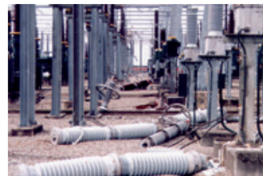
▲ 921 地震中寮開閉所開關場內嚴重受損之情形，造成南電北送完全中斷。

班上的重心，就較屬於電網系統面，因為這裡有南北超高壓第一、第二、第三路幹線進來，所以我們焦點集中在輸電線，比如說監看線路有沒有超載及線路電力潮流的變化，因為臺灣主要電力負載是靠三條 345 千伏的幹線在保持平衡。像是南電北轉等都是系統面的問題，線路如果跳脫一條，可能還沒有太大問題，但如果跳脫兩條我們就必須馬上採取應變措施。所以我們開閉所涉及的層面屬於系統面，由中央調度中心指令我們要投入，還是啟動斷路器。不像一般變電所，往下涉及到 161 千伏的一次變電系統，與屬於配電的二次變電系統。我們跟一般民眾也較沒有直接關係，但我們這邊如果發生嚴重狀況，就電力系統而言很可能就是大事件！像 921 地震時，地牛翻身讓開關所的損壞情形非常嚴重，整個中北部電力系統就崩潰了。