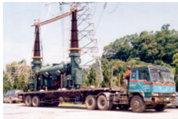
▲ 災後搶修，從四面八方借調備品投入使用加速復電速度。