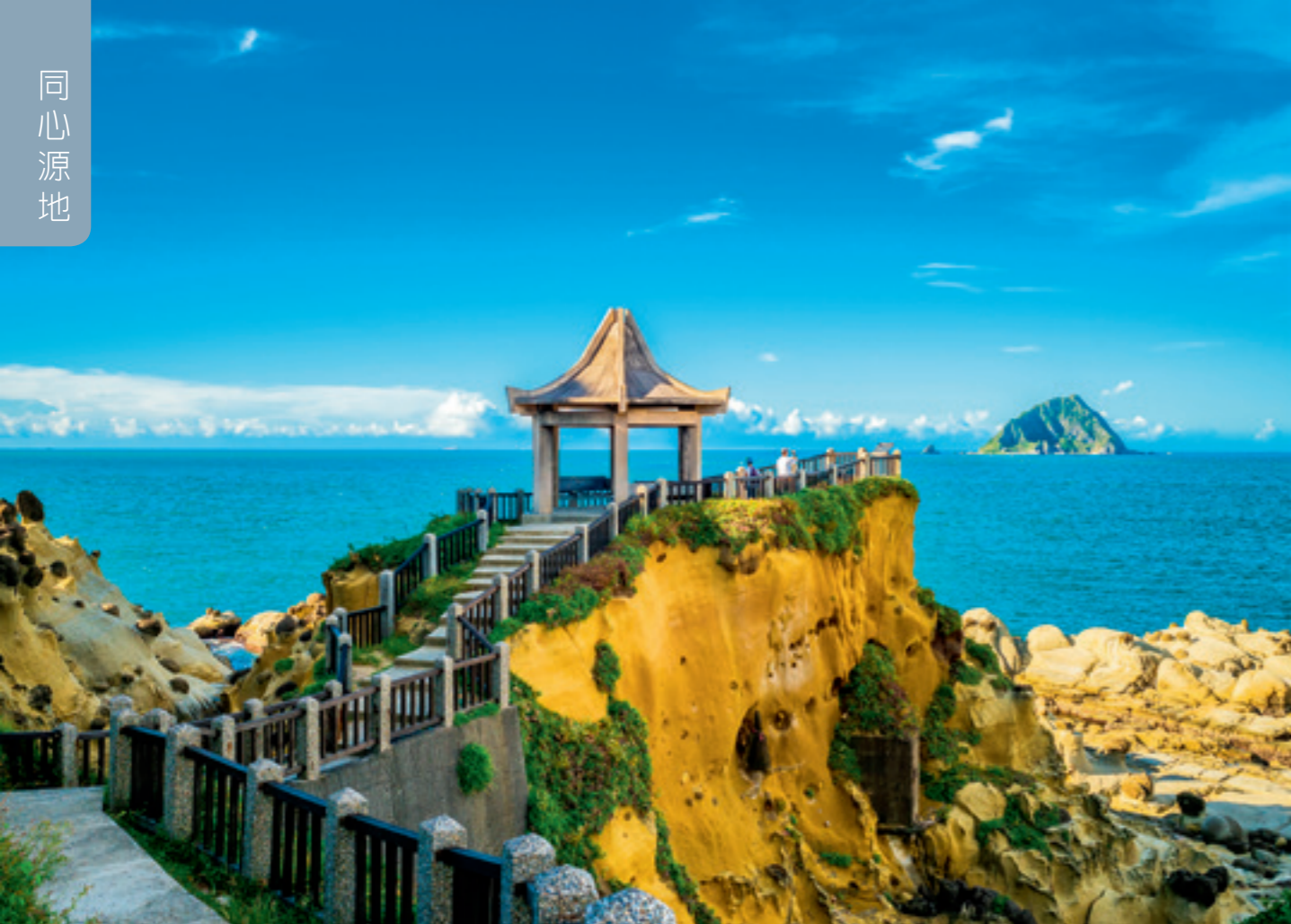
▲ 背山面海的基隆，在戰略防衛上有著可攻可守的位置。