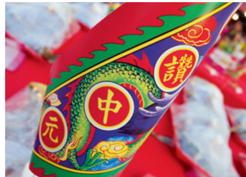
▲ 基隆中元祭是紀念先民如何弭平族群間衝突，喚醒族群命運共同體的體認。