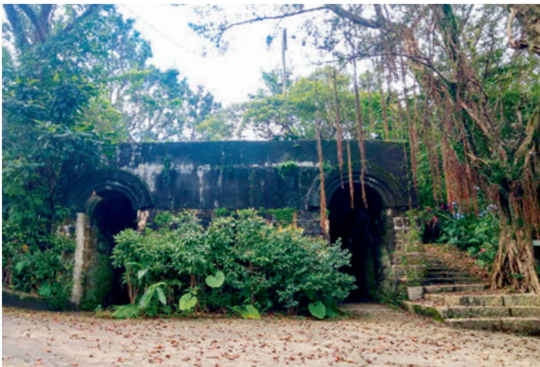
▲ 位於基隆南邊的獅球嶺砲台，現已是人跡罕至的古蹟。