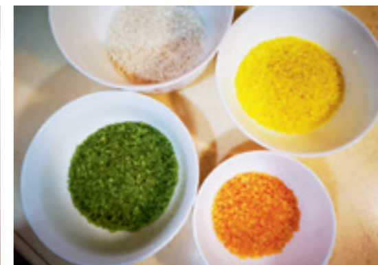
▲ 取自於天然蔬果，為白米穿上彩色的衣服，享用美食同時也能享受豐富的色彩饗宴。

看膩了一般便當的菜色嗎？是否覺得便當就是一成不變的樣子呢？其實花一點心思，就可以讓便當有不一樣的樣貌與趣味性，利用彩色米作成色彩繽紛的便當看起來賞心悅目，再來點創意使用海苔點綴變成可愛造型，讓吃便當不再只是填飽肚子，而是打開便當的人都能收到滿滿的驚喜與歡樂。