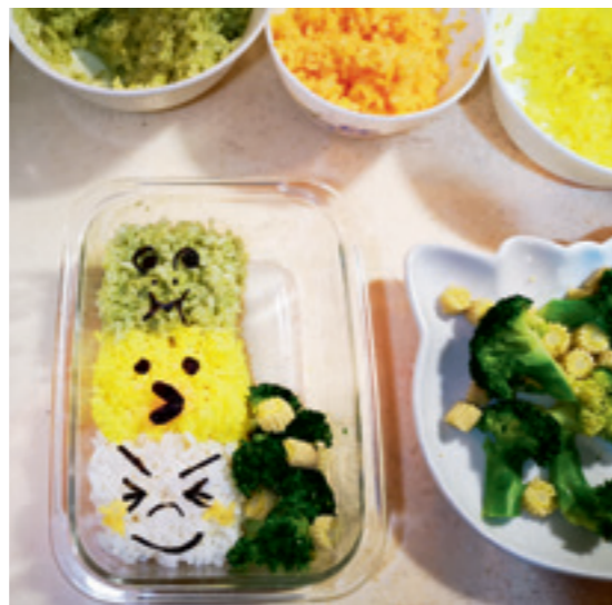
▲ 簡單、可愛的點綴，不僅吸引目光，用餐情緒也相對輕鬆。

為朋友、情人、與家人做一份可愛又美味的便當吧！將心意化作菜色，加點創意調味，讓打開便當的人不僅能吃的美味健康，還能在枯燥乏味的日常生活中添加用餐情趣。🍄