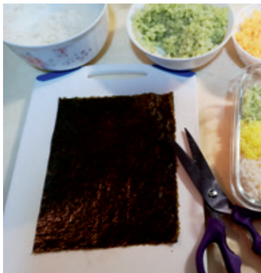
▲ 一片海苔、一把食物剪刀，便能點綴食物。