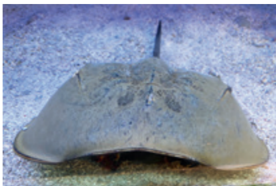
▲ 有「活化石」之稱的魷，在臺灣本島海域已難覓蹤跡。

的潛水地圖，明確標示出可以潛水的安全水域，並規劃設置專屬潛水路線，引導健康安全且對海洋環境友善的潛水活動。未來還將制定保育區內相關遊憩活動（包括潛水、浮潛、自由潛水等）的管理辦法及納入總量管制的可行性，讓海上觀光休憩和海洋保育相輔相成獲得雙贏，促使這塊臺灣最小的保育區能有最大的成果。