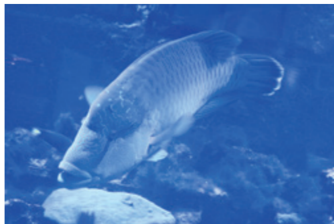
▲ 海洋中心的「鎮館之寶」，一隻威風凜凜的「龍王鯛」，它是世界上體型最大的珊瑚礁魚類。

在「潮境公園」的每個角落，近距離看腳下番仔澳灣周遭海岸地質及生態景觀，「海蝕平台」是一大特色。由於海岸的岩層在長期風浪的侵蝕下凹陷、崩塌，形成陡峭的「海蝕崖」，當高處崩落的巨石堆積在崖腳下，經年累月形成與海平面高度相差不多的平地，這就是「海蝕平台」。其實這些「海蝕平台」的表面一點也不平坦，因侵蝕作用形成像波浪般的規律起伏，因此又有「魔鬼洗衣板」之稱謂。