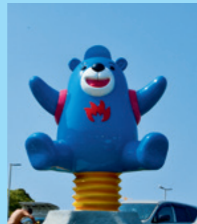
▲ 海科館帥帥又可愛的吉祥物「火熊」，站在潮境公園裡歡迎四方的遊客。