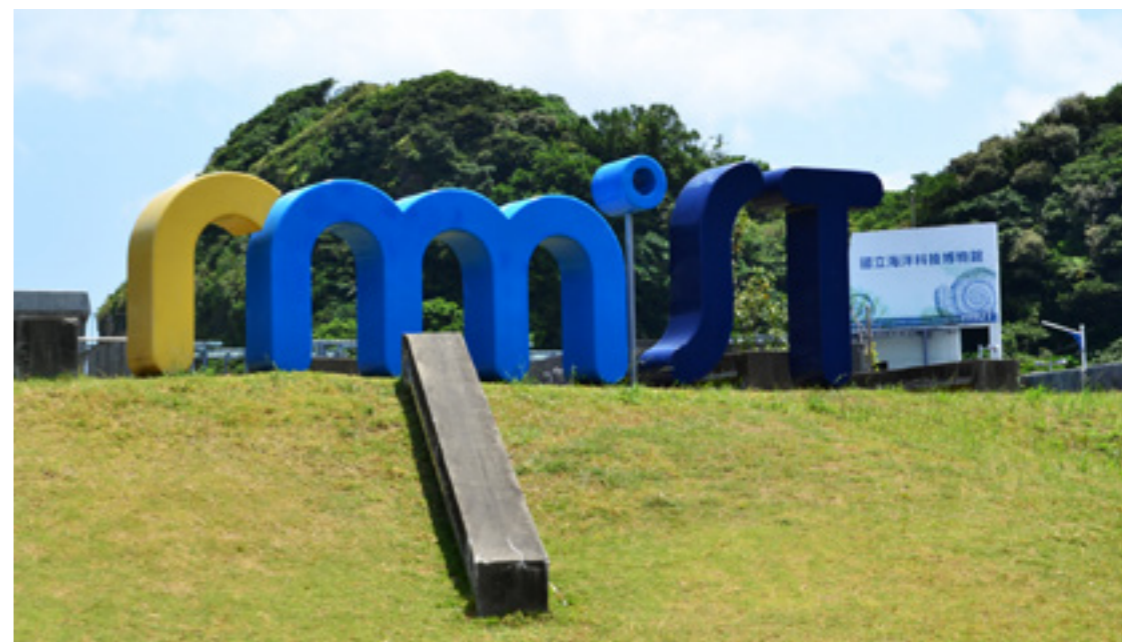
▲ 國立海洋科技博物館的巨大 LOGO，就矗立於漁港邊。

矗立於八斗子漁港邊的國立海洋科技博物館便是一個典範，這座兼具展示、教育、研究、蒐藏、休閒娛樂等多功能的海