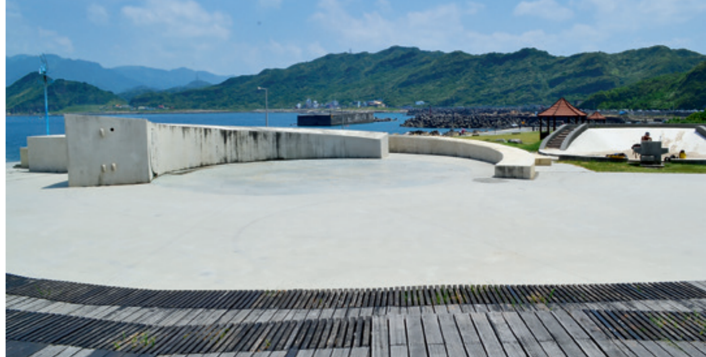
▲ 「潮境公園」的前身曾經是基隆市的水肥處理場和垃圾掩埋場。

極目遠眺，對岸的基隆山和半山上九份山城之風光清晰可辨，每到傍晚時分，則有迷人的夕陽將海天染成浪漫的戀愛色；入夜，基隆山旁星光熠熠的九份燈火如寶石般閃爍，更具唯美與迷人的魅力。