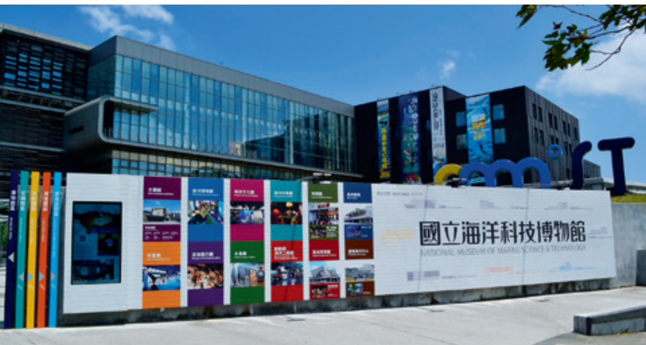
▲ 國立海洋科技博物館是一座兼具展示、教育、研究、蒐藏、休閒娛樂等多功能的海洋博物館，其使命就是喚起民衆「親近海洋、認識海洋、善待海洋」的意識，讓海洋得以永續發展。

而隨著保育區內豐富美麗的景點一一湧現，開始吸引大批潛水愛好者與海共舞，但太多潛水客也會對生態環境造成衝擊。為此，相關單位特別印製發行潮境保育區