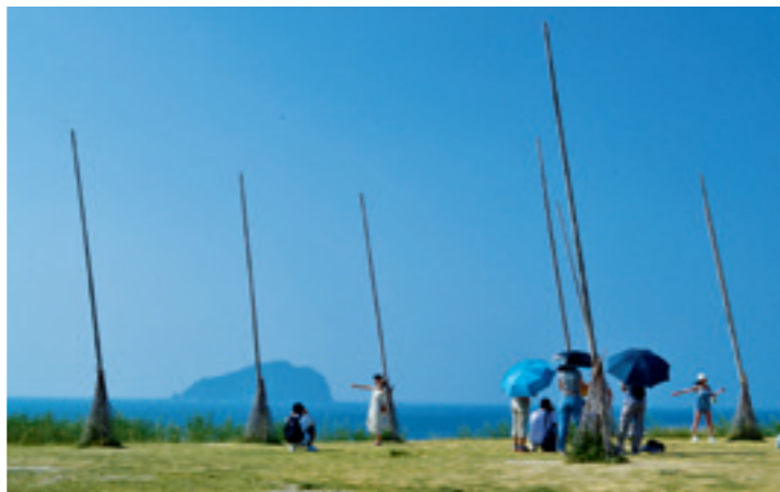
▲ 潮境公園最吸睛的地標是被網友戲稱為「飛天掃把」的裝置藝術，以浩瀚的太平洋和彷彿咫尺之遙的基隆嶼為背景，彷彿從天而降一般。