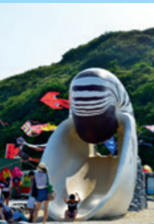
▲ 巨大的鸚鵡螺造型的溜滑梯是小朋友的最愛。