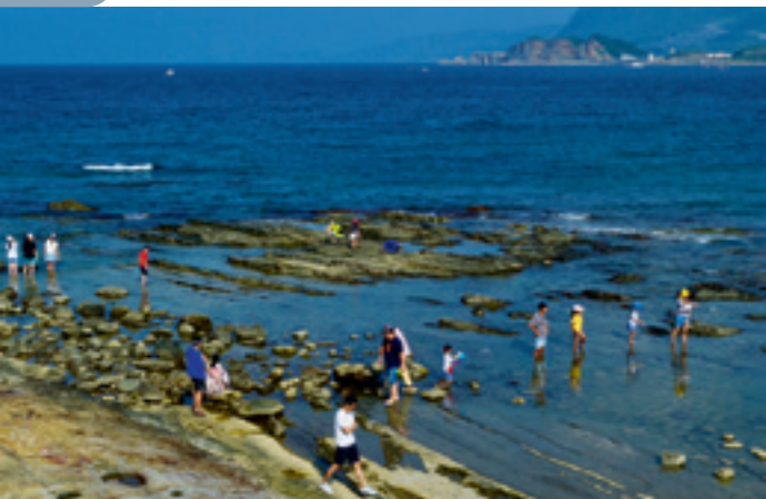
▲ 踩在「海蝕平台」上近距離觀察潮間帶生態，是一件很有趣的事，也是最好的親海教育。