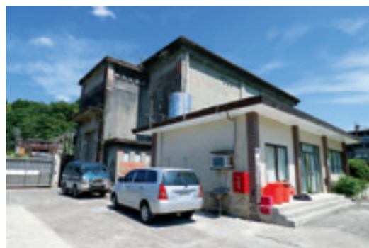
▲ 基隆二次變電所控制室新舊建築一前一後的相互照應，看得出建築設計結構與外觀的不同。

戰後經濟發展飛速，臺灣電力系統快速壯大，曾在日治時期奪得亞洲第一大發電廠的日月潭第一發電所，如今也僅是眾多各式發電廠中的一個亮點，輸變電系統更是今非昔比。日治時期南北 154 千伏雙向幹線已成追憶，全新的三條 345 千伏超高壓輸電線成為南北電力骨幹。有鑑於此，台電公司將輸供電系統二分為 345 千伏及 161 千伏等級的變電所，為供電區營運處管理；而 69 千伏變電所與配電系統則由區營業處管理；區營業處的轄區再依照用戶數、地理環境等因素區分，形成今日新北市瑞芳區的瑞芳變電所由基隆區營業處管理，但基隆市七堵區八堵一次變電所由台北供電區營運處管理的特殊現象。