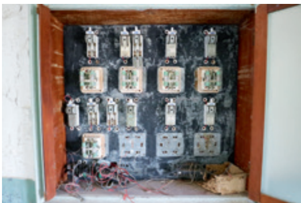
▲ 舊控制室配電盤一隅，從未更動過的配置與早已淘汰的舊式開關，彷彿時間停留在過往時日。