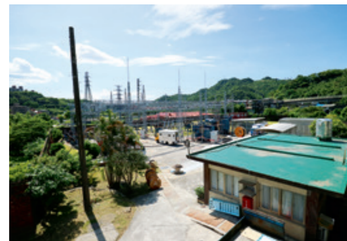
▼ 因日本人預留的土地面積足以直接興建新變電所，陰錯陽差地將舊變電所完整保留，留下珍貴的台電文資。

「空間清出來後，我就請同仁把資料載回來，第一批回來後我問同仁，就這樣子嗎？他們回說還有，就又一輛車載回來了。我認為瑞芳變電所的環境已經不適合再存放這些資料，所以交代同仁們資料要全部載回來，那資料量真的很大，我動員了電務的同仁們，全部裝箱裝袋，兩大卡車滿滿的資料才搬回區處。而且這些資料真令人興奮，因為對我們來講，這些都是早期的前輩留下的經驗及心血結晶。你看到會讚嘆說，哇！原來以前還有這種設備啊、毛筆書寫批示的公文，這對現在年輕一輩的台電人是很難想像的。只要一有時間我就會去翻翻這些公文書，不過我也很憂心這