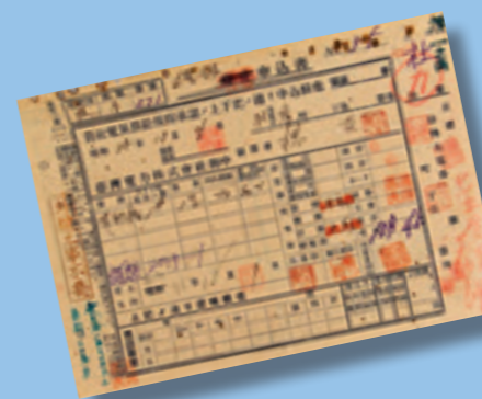
▲ 台電成立初期因各式申請單尚未建立完成，故沿用臺灣電力株式會社表單填寫，圖為基隆區處用電增設申請書。