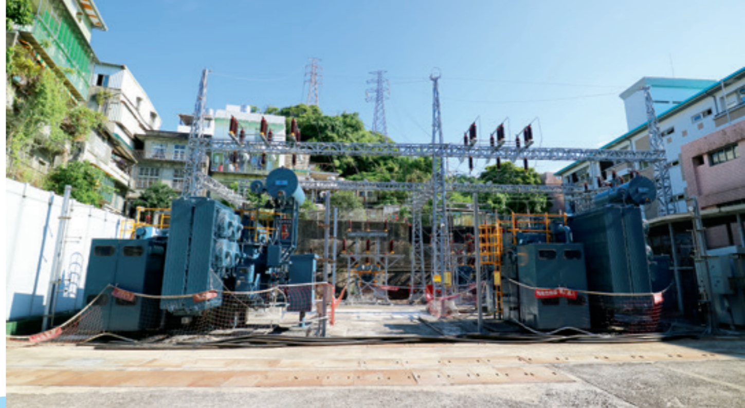
▲ 成立於清宣統 1 年 (西元 1909 年) 的基隆二次變電所是基隆地區最早的變電所，開啓基隆地區電力發展史。

建工程，加上早在清領時期就已活絡發展的港埠活動，並受惠清宣統 1 年 (西元 1909 年) 小粗坑發電所竣工啓用，北部地區能有更多電力延伸及未開發的蠻荒地帶，總督府工部決定於基隆廳基隆堡基隆街設置基隆臨時配電所一座，成為第一座落腳在基隆地區的變電所，這座變電所至今仍持續營運中，就是位於基隆區營業處配電中心後方的基隆二次變電所。緊接著基隆築港、中幅子、菁桐、雙溪等變電