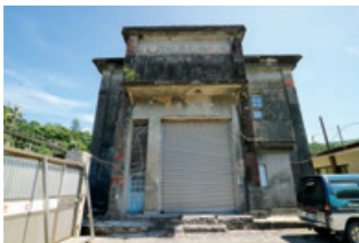
▲ 瑞芳變電所舊控制室，外牆雖已斑駁老朽，但仍可見早期日本人對建築美感的要求。