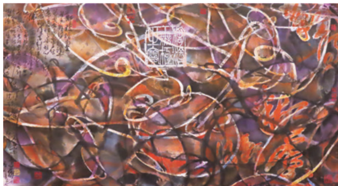
▲ 林章湖《樂在糊塗》西元 2017 年。

甚至林章湖還上承著宋人的寫生精神，宋代魚畫家劉寀的〈落花游魚圖〉，畫一群大小不一，肥瘦相間的魚兒，聚聚散散穿梭在水草浮萍間，而畫家更精心地捕捉到十餘條魚兒競相追逐那一、二片落在水面上的粉紅杏花花瓣，巧妙地鋪陳出生機盎然的情境。