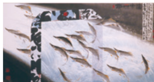
▲ 林章湖《魚躍龍門》西元2012年。