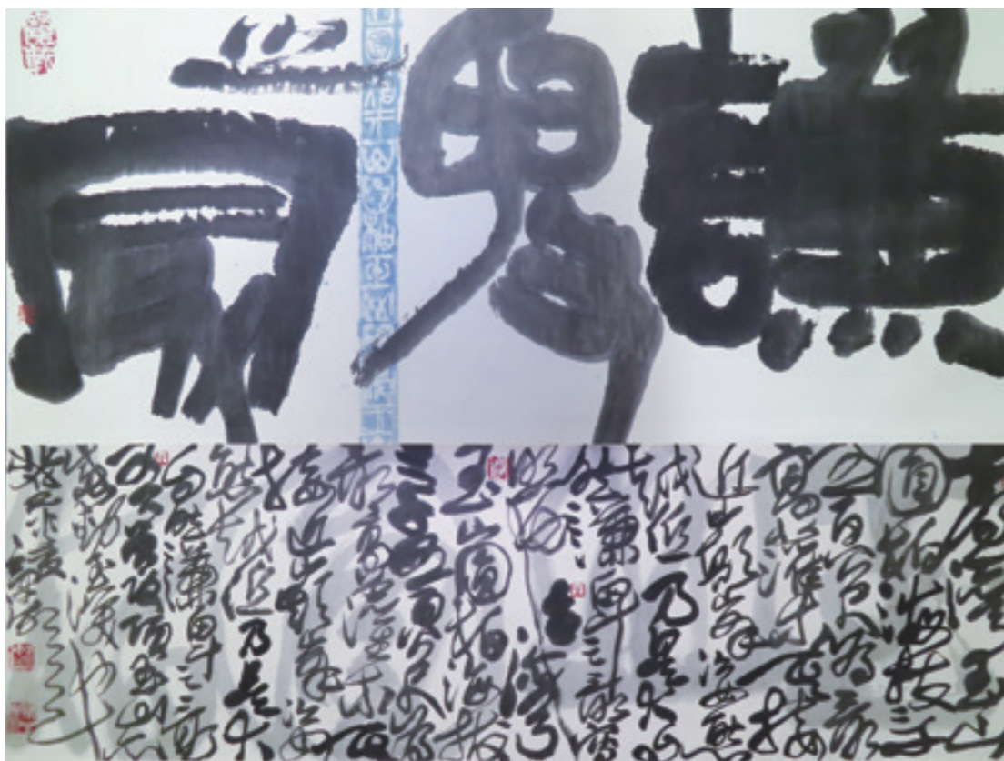
▲ 林章湖《謙卑之最》西元 2012 年。

鳴泉》，15 歲臨摹唐伯虎〈草堂清話〉的少年，在臺灣師大畢業美展時，即囊括國畫第一名，書法第二名，篆刻第三名，畢業後不斷自我精進，任教於臺北藝術大學，如今他山水、人物、花鳥、畜獸、虫魚等領域皆擅。更難得的是他在詩文的造詣上頗具才情，往往作畫、篆刻又題詩，書詩畫印四絕皆備，是當今藝壇少見的全才。