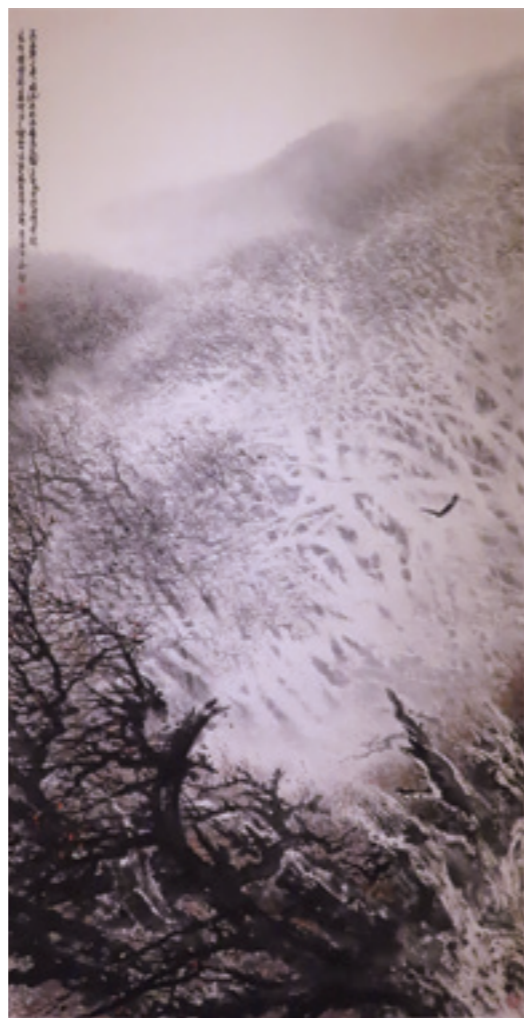
▲ 林章湖《白林翹鷹》西元 1987 年。

林章湖精湛的寫生功夫與對大自然的敏銳感悟，往往對山川自然觀察入微，再以細密、精微的筆觸萃取山川的精華，創造自在理想的境界。觀賞他那幅〈白林翹