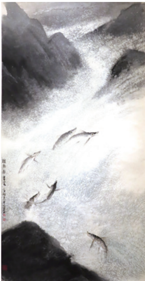
▲ 林章湖《躍魚圖》西元 1990 年。

在那兒交配、產卵、死亡，完成牠一生的使命。但是這群在冰河時期，有幸在河川海拔夠高的大甲溪存活下來的子遺生物，為了適應臺灣的地形變遷與氣候，而演化為不會迴游的陸封型鮭魚，終其一生安居於臺灣七家灣溪，成為臺灣本土的唯一鮭科魚類。