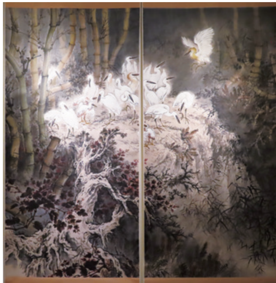
▲ 林章湖《白鷺圖》西元 1977 年。

這幅有如史詩般的巨作，畫家林章湖除了歌頌鮭魚以旺盛的生命力千里歸鄉之舉，更對鮭魚棲息地遭受水壩的破壞，及全球氣候不斷暖化意象對鮭魚生命的威脅，有感而發。他題寫於右上角的落款：