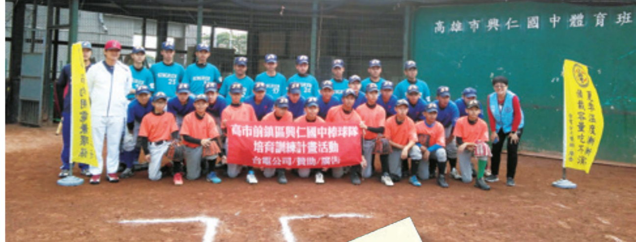
▲ 儘管興仁國中棒球隊結束了18年的球隊經營，卻成就了許多孩子打棒球的夢想。

作，補助興仁國中棒球隊經費，協助學校無後顧之憂繼續培育棒球基礎人才，鼓勵孩子們能繼續參與訓練、比賽，追逐他們青春的棒球夢。今年度接獲學校告知棒球隊將宣告退場，想到孩子們認真的練習充