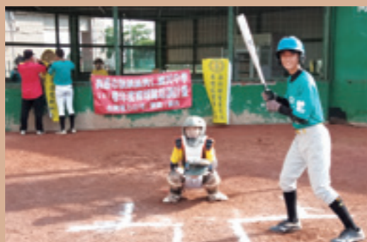
▲ 台電南部發電廠與興仁國中棒球隊，多年來維持良好互動。

有感於興仁國中棒球師長盡心地培育後進，孩子們卻因經費負擔沉重無法安心築夢，台電南部發電廠多年以來與校方合