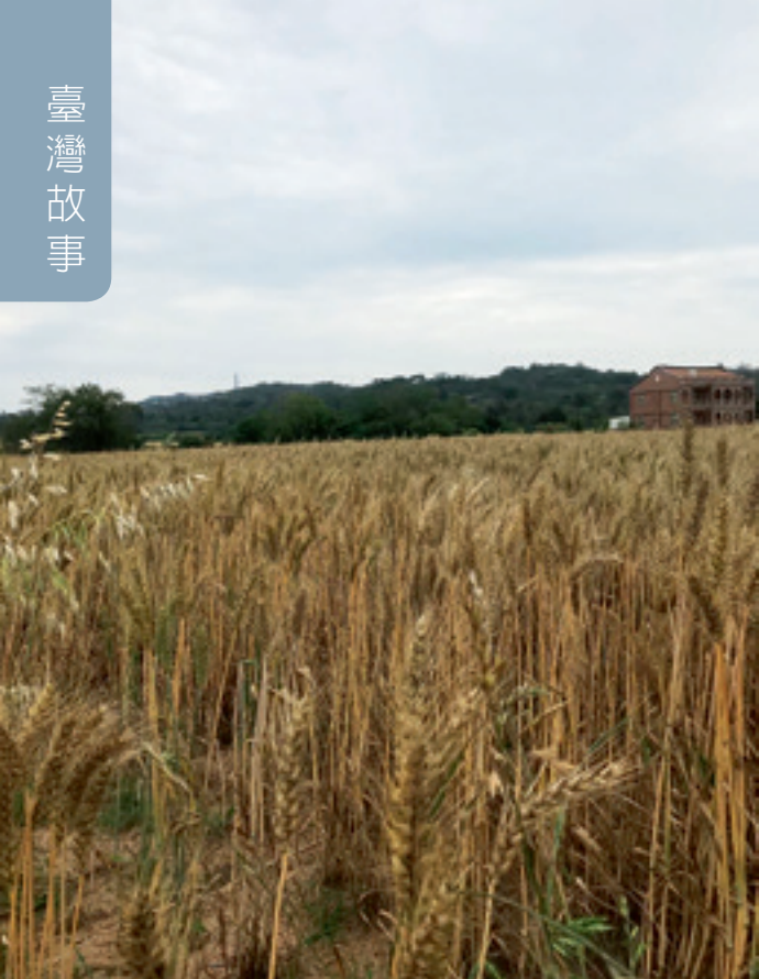
▲ 垂下腰桿的麥浪，讓人學習謙遜之禮。

好舒服！據說棉絮拿來做成枕頭心，非常的適合，因為溫度恰好，不會睡得昏沉沉的，是彈棉被的熟手說的。