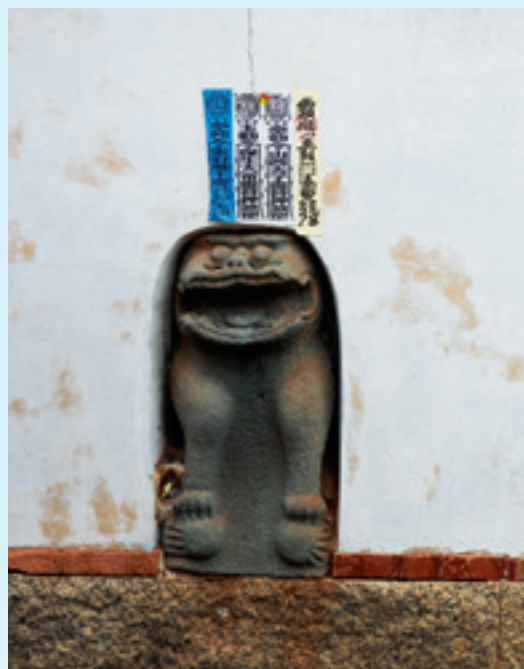
▲ 鎮風防煞的牆上風獅爺。

在「蔡氏家廟」的後壁上，鑲嵌有一尊風獅爺，因其前面為巷道，為防路衝而設置，主要功能即針對巷道以防衝煞，村民也常會來祭拜，據說小兒有時「臭嘴角」（現在稱為「鵝口瘡」），都會帶餅干來拜，並以祭拜過的餅干在小兒的嘴角擦拭。