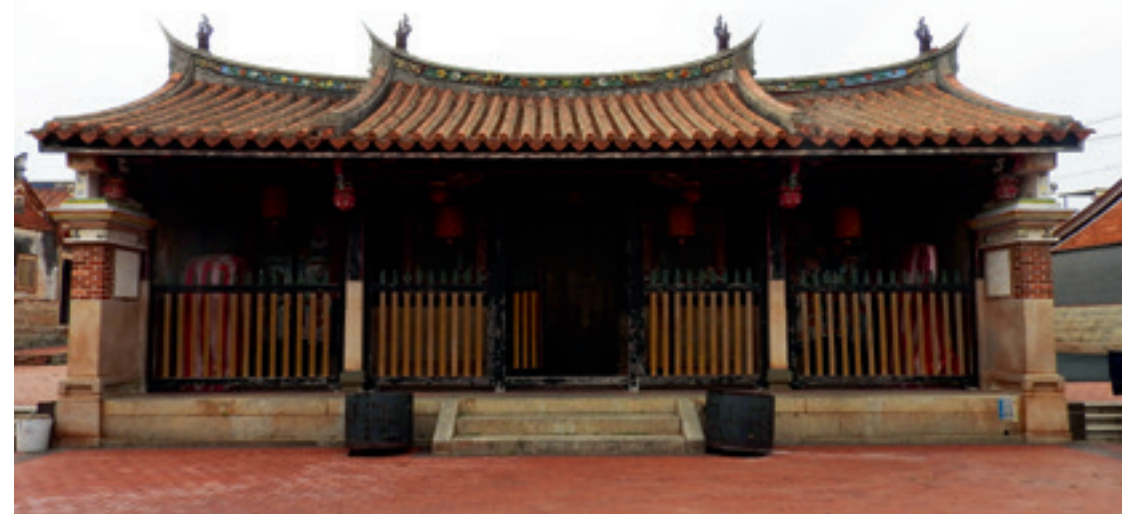
▲ 蔡氏家廟，看見蔡氏家族文武世家。