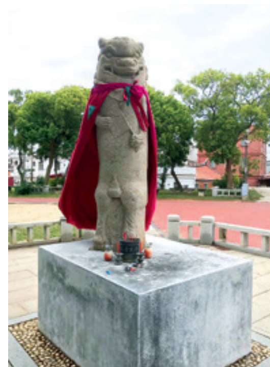
▲ 東北風獅爺象徵守護聚落。

金門早期因為風沙危害，所以許多村落在東北方向，常會豎立風獅爺鎮守以防風害。瓊林聚落在村的角落、水邊或巷衝也設立了風獅爺，在東北處設有一尊風獅