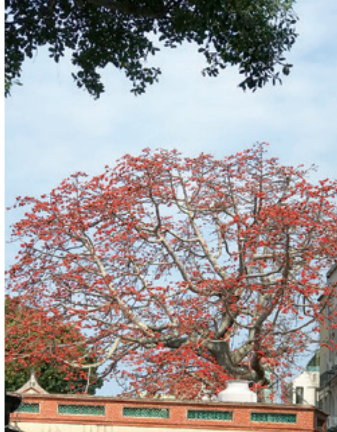
▲燦爛木棉，點綴金門的天空。

位於金門金城的總兵署，常是旅人來到金門的踩踏熱點之一，金門的歷史與文化總讓人低迴，這裡曾是金門有名的才子許癩讀書的地方，名為「叢青軒」，後來清總兵陳龍把府衙從舊金城遷到現有的金城（早期稱後浦），俗話常說「十年河東，十年河西。」，政治中心的移轉，使得人口也往金城移入，總兵署在其府衙的後方，有一株百年木棉，每年3-4月間，滿樹的木棉花盛開，常吸引許多的昆蟲和鳥兒殷勤來探訪，讓遊人駐足留戀、欣賞，因為木棉花的紅豔，在陽光灑瀉下，更為光采動人！從花苞到在和風中一朵朵綻放，彷彿甦醒的美人和天空對話。在地的居民也喜歡駐足在樹下分享、交流；還有學校的