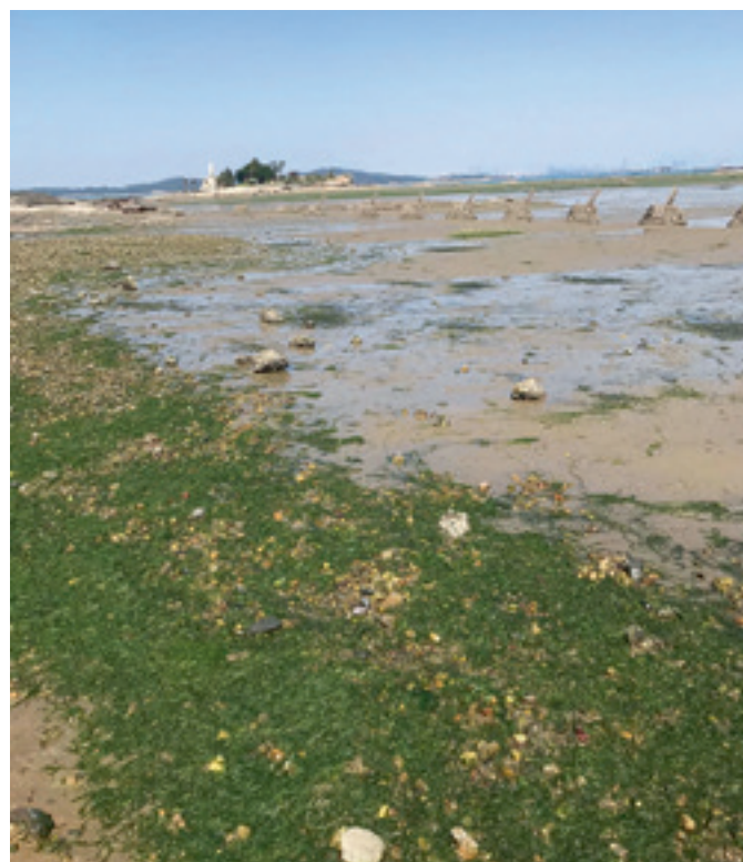
▲以石蓴、游苔等為主的綠色藻類，展現蓬勃生機。

老師帶著孩子來觀察木棉花的生命歷程；更有媽媽帶著孩子來寫生，大膽的用色，卻那般自然的把木棉的嬌豔，從畫紙上，躍然而出。