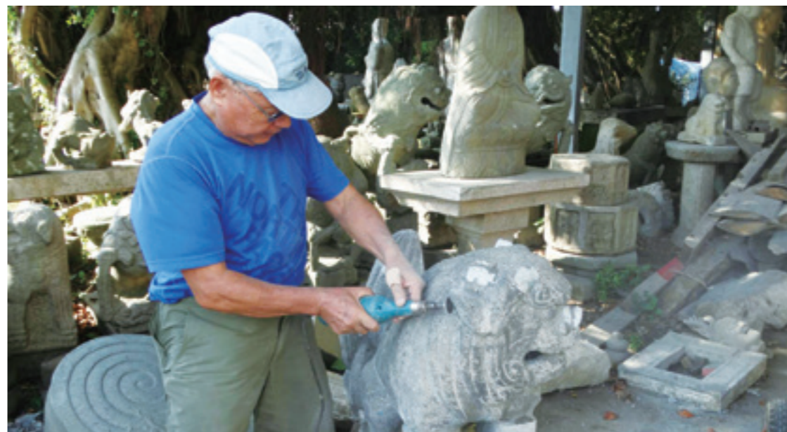
▲ 以電鑽為珍藏的石獅作品進行修復。

類別大致分為三大類。一為「北式」：顏色以紅、藍、綠三色為大宗，圖騰則多為龍、鳳，用色簡約大方，展現尊榮華貴之氣，舊時代的北方宮殿建築尤為代表。二為「南式」：跳脫傳統彩繪窠臼，色彩明亮、花樣豐富，圖騰多為人物、花鳥等，取材多元、畫風精巧華美，筆觸嚴謹細膩，令人目不暇給。另有一派為「蘇式」：可以說是「南式」的延伸，色彩鮮明活潑、構圖新穎，層次更多元，工法也更為繁複。