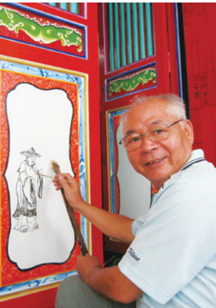
▲ 阿男師為淡水金福宮側門彩繪「王羲之愛鵝」。

在梵蒂岡 (Vaticanae) 的西斯汀禮拜堂 (Cappella Sistina) 裡，米開朗基羅 (Michelangelo) 的〈創世紀 (Genesis)〉穹頂畫和壁畫〈最後的審判 (The Last Judgement)〉是曠世不朽的巨作，主題發人深省，技藝也讓人歎為觀止。無獨有偶的，東方廟宇的彩繪文化也有著異曲同工