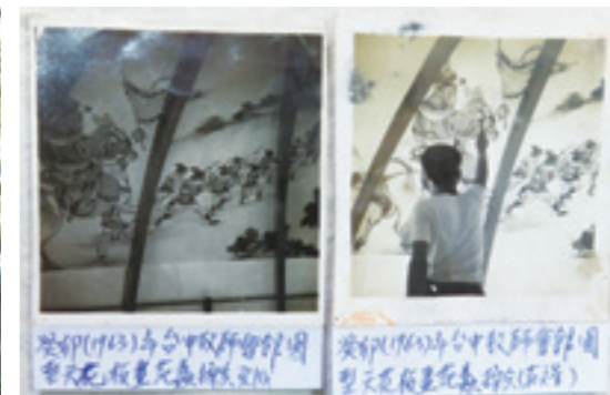
▲民國 52 年莊武男為臺中教師會館圓形天花板繪製「范蠡操兵」圖。