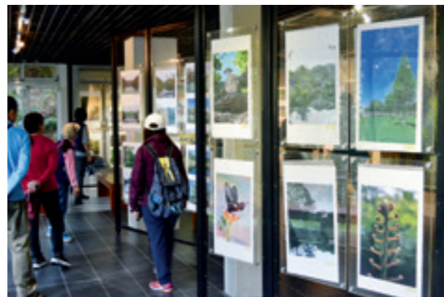
▲ 這是由 5 號辦公室改成的後慈湖生態藝廊。