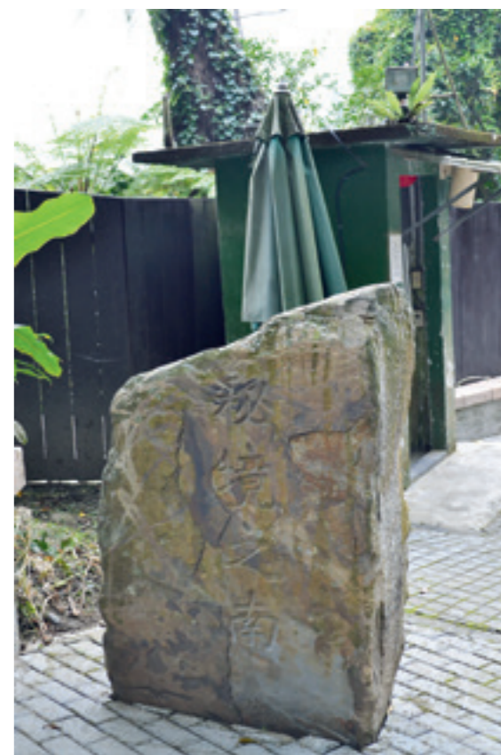
▲ 入口的「秘境之南」大石，平添了幾分文學氣息。

這時，有人問為何還不見後慈湖？導覽志工說過了前面的慈湖橋就是了，只見一座布滿青苔的小石橋與路面齊高，橋的一側刻著「慈湖橋」和「中華民國五十一年十一月」字樣，顯見此橋年代的久遠。橋頭還立有一塊螢火蟲復育區的牌子，導覽志工說這裡因水質純淨入夏以後是螢火蟲的天堂，所以園區也會在夏季開辦賞螢行程。