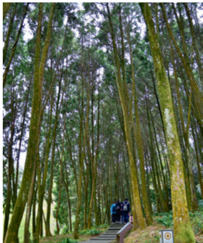
▲ 肖楠森林是後慈湖的另一處秘境，生長在 1 號辦公室和 2 號辦公室之間的山坡地。