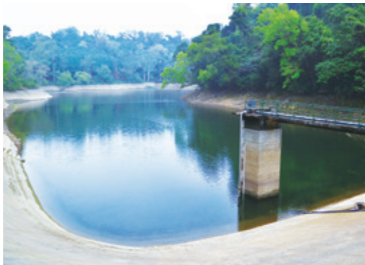
▲ 後慈湖最初是因灌溉之需，築壩而形成南北長約 400 公尺、最寬約 80 公尺的新月形狀埤塘。

高點崙頂叫做「高台」，是昔日輕便車的休息站，在日治時期叫「宮之台」，為紀念當時的日本親王秩父宮殿下而命名，所以這條古道才有「總督府古道」之名。