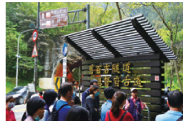
▲ 北橫公路的百吉隧道口旁就是進入後慈湖的步道入口。

我們沿著隧道上方的木棧道進入百吉林蔭步道，這條林蔭步道最早叫做「石龜坑古道」，臺語稱其「蹦孔歧」，全長約 3 公里，是一條 O 字環狀路線。古道的最