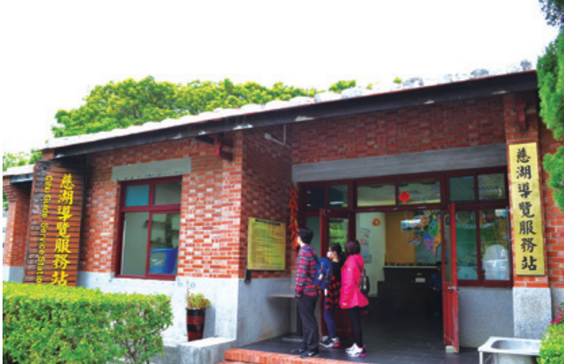
▲ 慈湖風景區專門設置了「慈湖導覽服務站」，為參觀後慈湖園區的遊客提供導覽服務。

這是徐志摩筆下的〈我所知道的康橋〉。然而這段關於「春天」的描繪、這份與大自然和諧共處的美好感受，在我走進後慈湖秘境的那一刻，竟也真實地呈現在我的眼前。