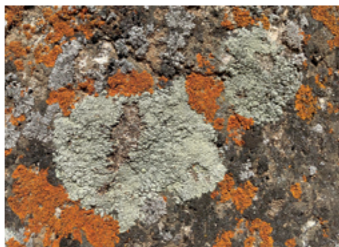
▲ 在裸露的岩石表面出現各種色彩有如苔蘚的植被，叫做「地衣」，是真菌和綠藻的混合體，被當成是一種空氣品質的指標。