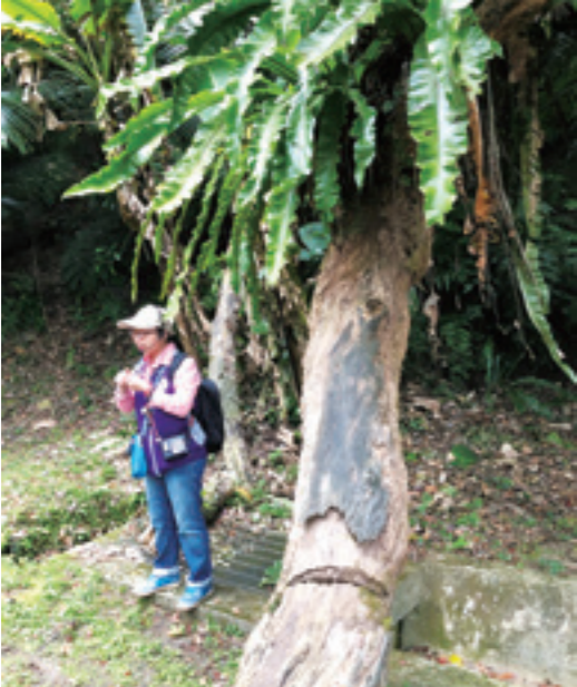
▲ 頹倒的大木在園區內隨處可見，但經過時間的累積已變成其他植物的搖籃。