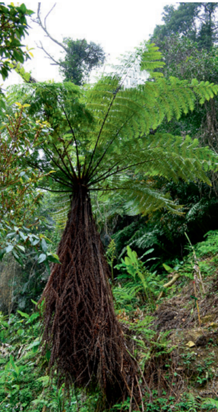
▲ 有「活化石」之稱的臺灣桫欏，臺灣人習慣稱它「筆筒樹」。

路旁有幾株高大的筆筒樹映入眼簾，它就是有「活化石」之稱的臺灣桫欏，近年由於氣候和環境的變化，筆筒樹在臺灣山野的分布數量已愈來愈少，已引起大眾關注，目前屬於臺灣珍稀瀕危植物。