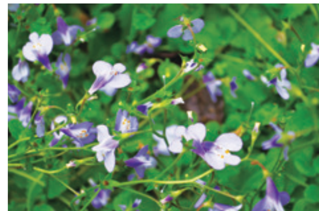
▲ 開著淡紫色小花名為「通泉草」的被子植物也遍布整個園區。

苔蘚般的植被，呈現灰白、暗綠，甚至淡黃、鮮紅等各種色彩，導覽志工說這叫「地衣」，是真菌和綠藻的混合體。由於「地衣」對二氧化硫相當的敏感，所以生態學上，「地衣」被當成是一種空氣品質的指標。