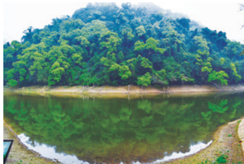
▲ 令攝影愛好者趨之若鶩的「後慈湖之眼」，據說在滿水位的晨昏或雨後，拍下湖面倒映的山色天光，就像是一幅以丹青描繪的眼眸。

此刻，湖畔邊矮灌叢的含笑花正值花期，白色的花瓣在綠叢中若隱若現，傳來陣陣有如哈密瓜般的香氣、甜甜的。含笑