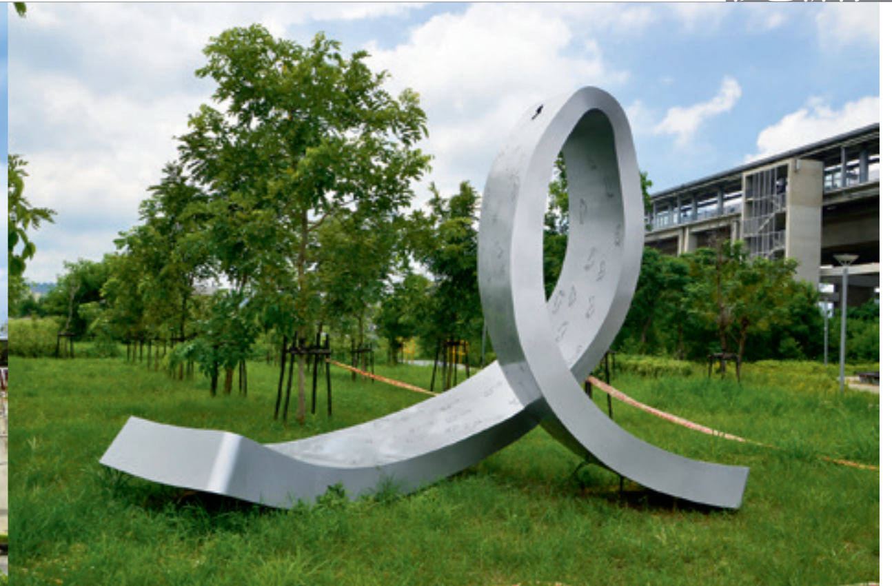
▲ 雙鐵中間的綠地廣場矗立著一件大型不鏽鋼公共藝術「回·家」，靈感來自當地民衆的足印。

驛」。西元 1922 年因海線鐵路通車於後龍聚落增設「後龍驛」，遂將此站改名為「北勢驛」。西元 1971 年，臺鐵再衡酌其位處後龍溪以北、明德水庫以西之土質肥沃的農業區，將站名改為豐富站，取其物產豐富居苗栗縣後龍鎮之冠之意。