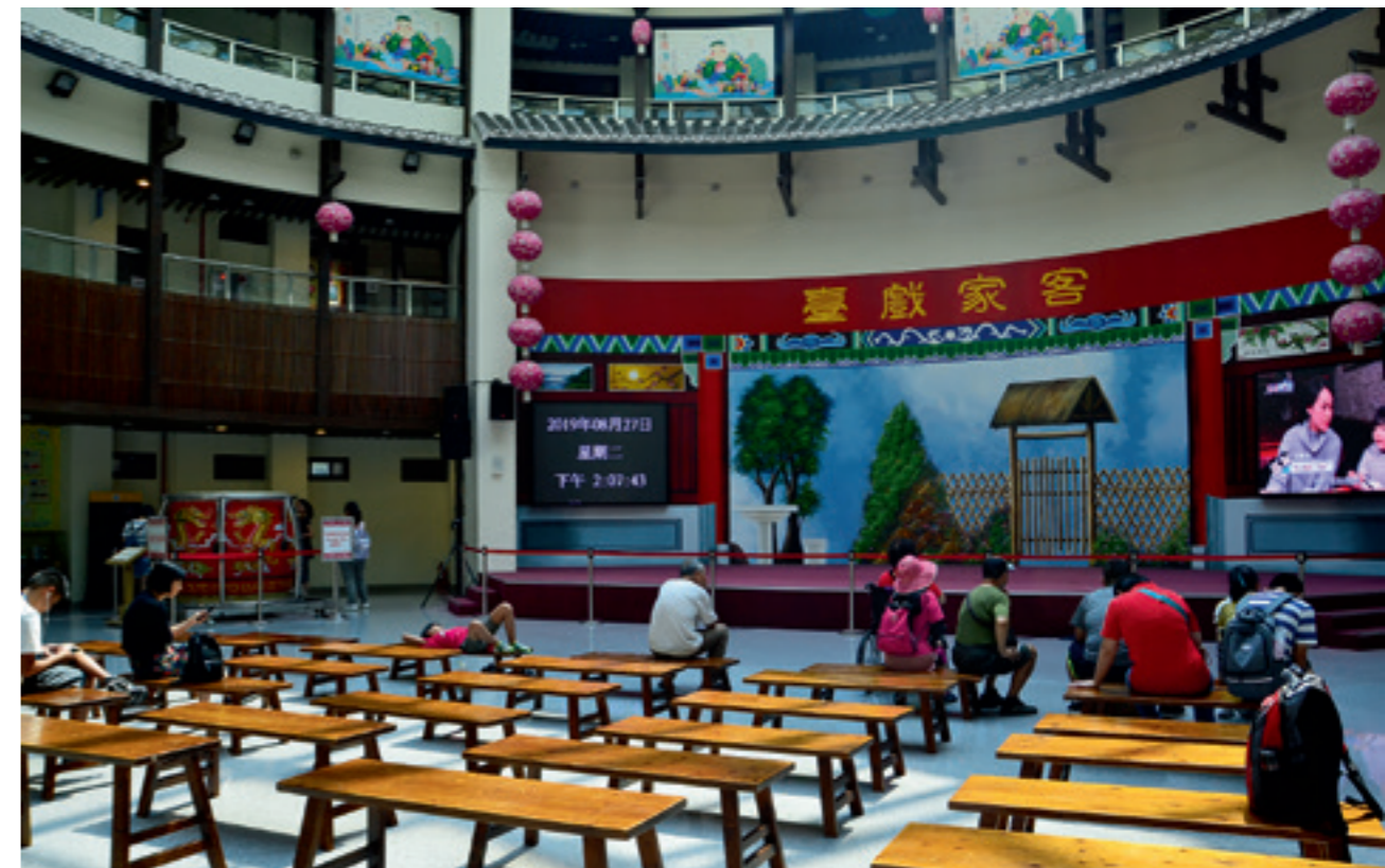
▲ 客家圓樓的一樓是客家戲臺。

拾步上二樓，環形的室內展廳呈現客家農事趣和客家飲食趣，想知道美味的客家料理是如何產生？又與那些客家節慶有關？在這裡都可以得到解答。據館內工作