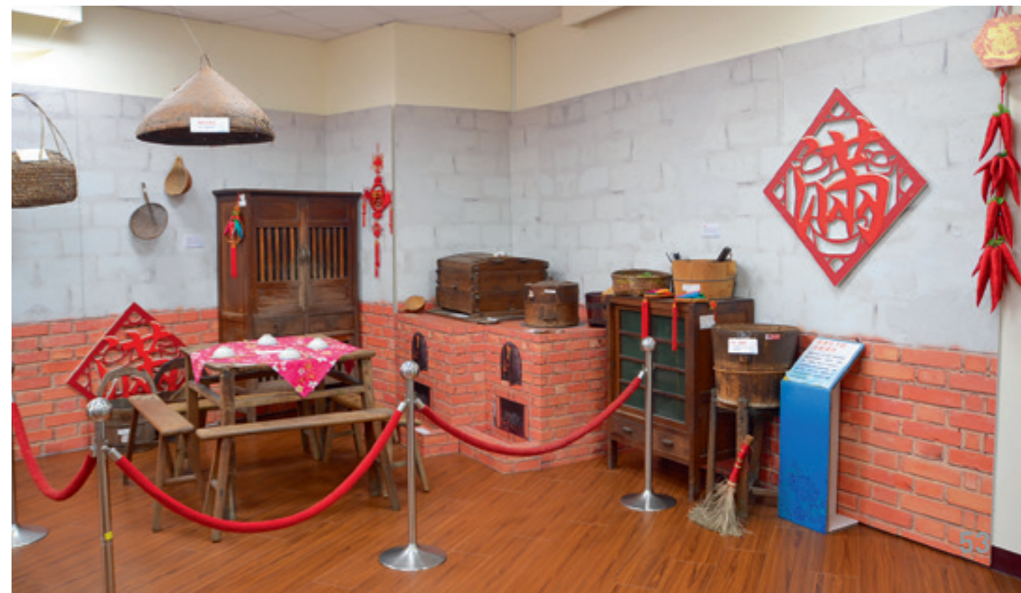
▼ 客家圓樓將客家人的灶下（廚房）搬進展廳。

暢想著臺鐵豐富車站內外的裝置藝術「佇足」和「回·家」，是不是那些從美富足裡走出來的腳印，都會貼著天空，最終從這裡找到回家的路。源