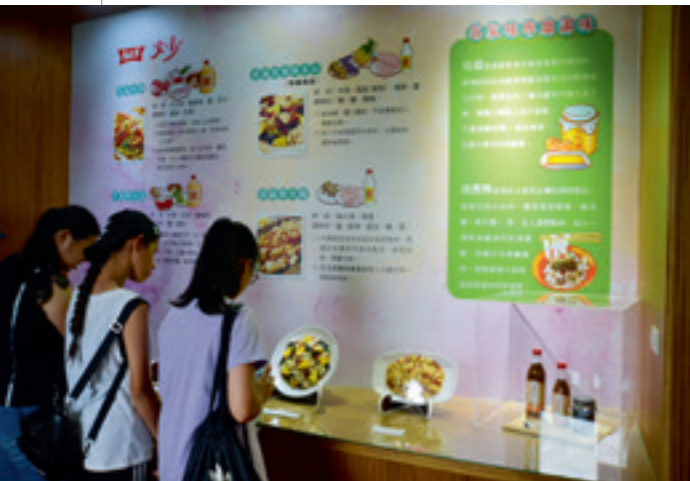
▲ 客家美食是苗栗縣政府近年積極推動及輔導結合客家文化創意之地方深度特色體驗遊程。