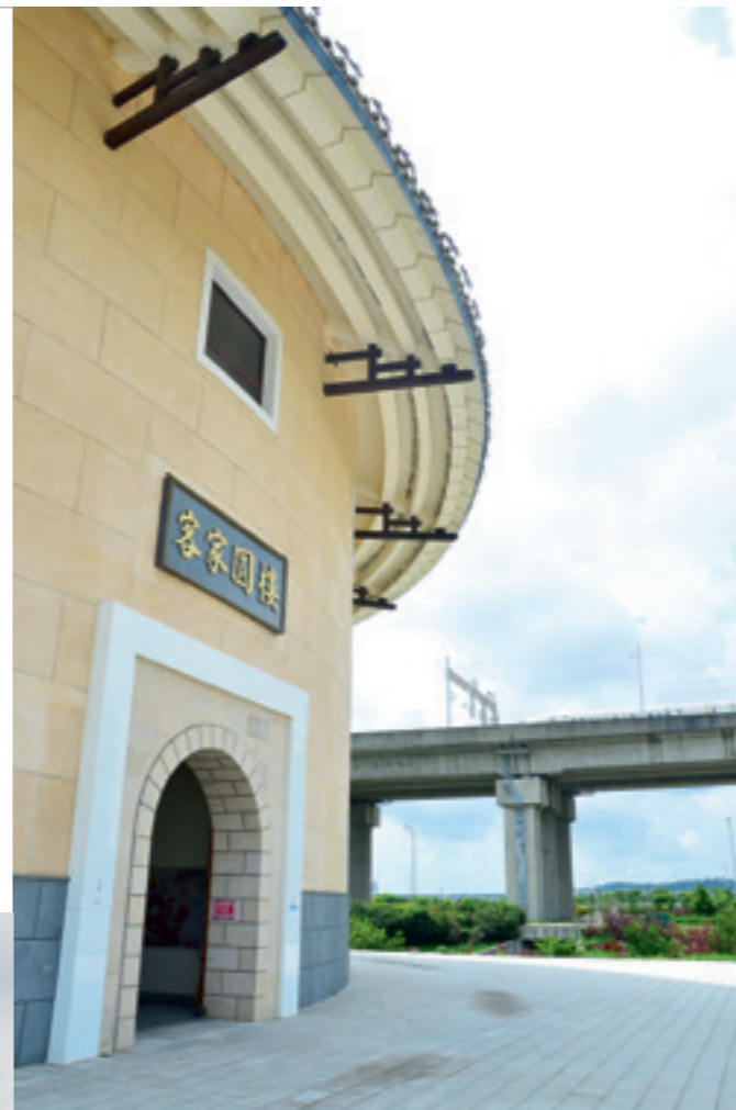
▲ 仔細看，在客家圓樓的另一面捕捉到臺灣高鐵呼嘯而過的畫面。

號正以過站不停的速度向南疾去。腳下的土地隨之震動，為臺灣帶來空間革命的兩條鐵路在這裡以如此近距離擦身而過，而鐵路橋下的幾隻白鷺鷥卻絲毫不為所動，它們依舊悠哉的理著羽翼，這些喜歡風平浪靜的鳥兒早已處變不驚了。