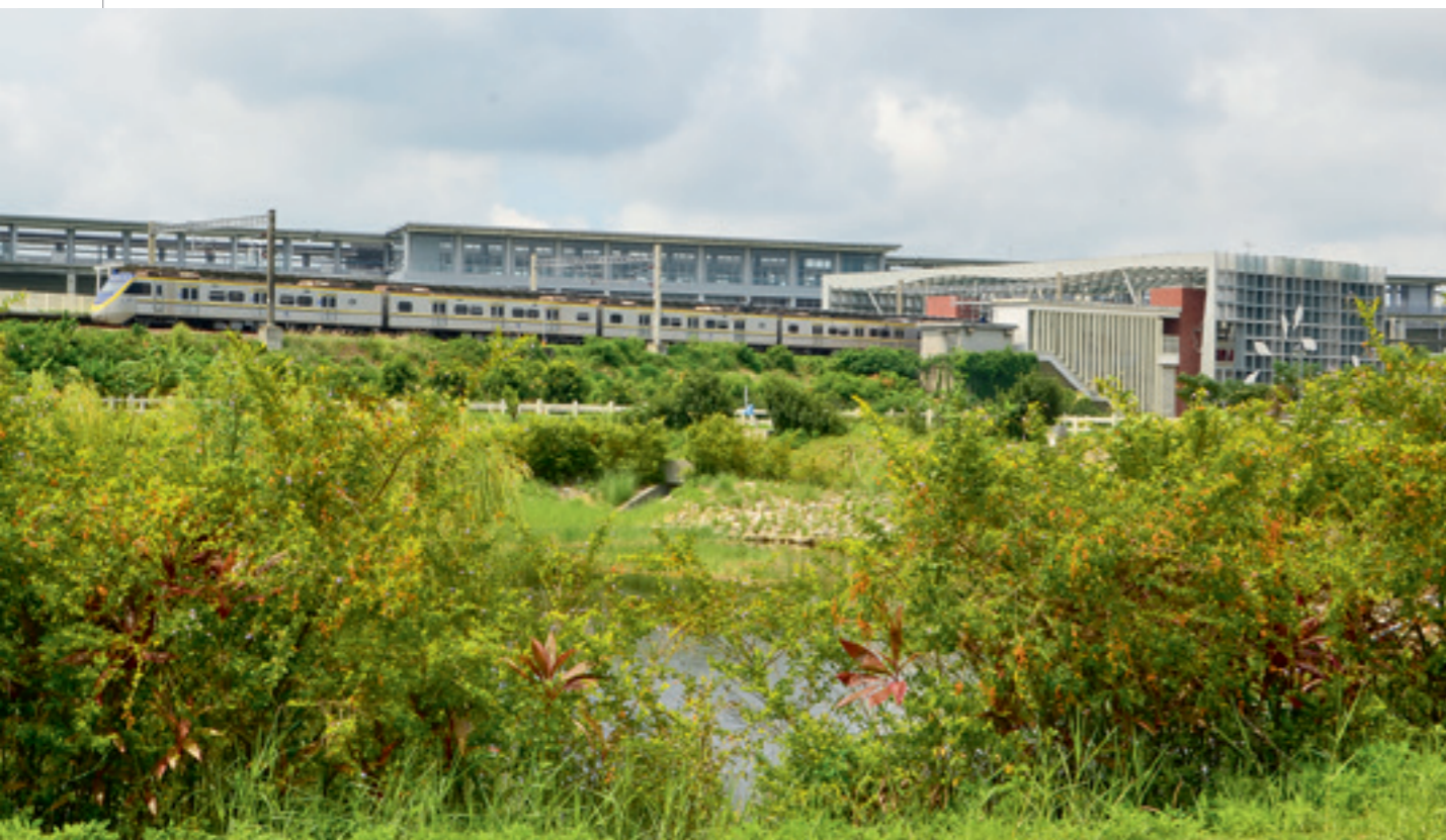
▲ 臺鐵列車駛過豐富站，背景就是高鐵苗栗站。

我正沉浸在這些大大小小的足印中，思索著足印的主人會有怎樣的人生故事，耳畔突然傳來轟隆隆的巨響，劃破寧靜的天空。只見一列純白色的高鐵列車如一道閃電在眼前 忽而過，緊接著，另一道橘色的光又從另外一邊飛馳而過，臺鐵的自強