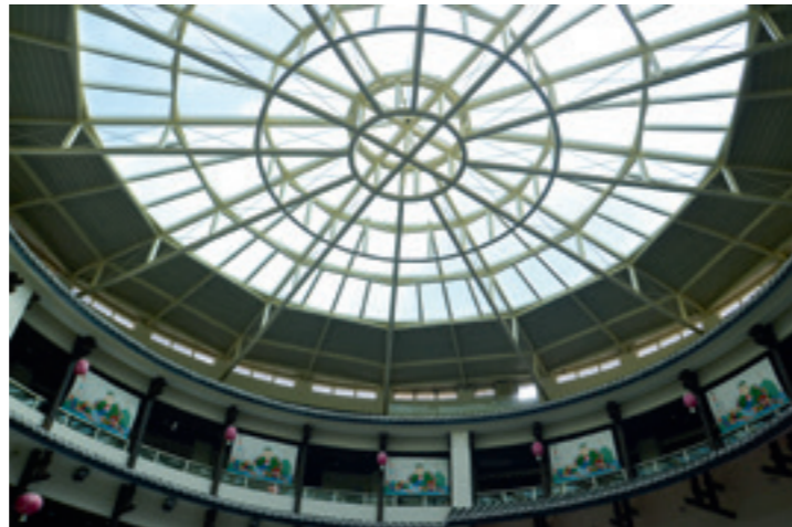
▲ 圓樓頂部巨大的採光玻璃將藍天白雲映成一幅天然帷幕。

我環繞著客家圓樓走一圈，在藍天的背景下，大面積的景觀水塘如拱月般將圓樓建築映襯得美輪美奐。水塘內水質清澈、