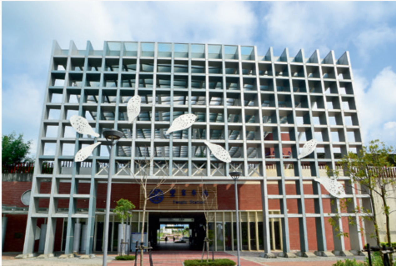
▲ 臺鐵豐富車站以挑高的簡單幾何的金屬框架，傳達輕量簡明的現代感，也象徵客家人的簡樸精神。