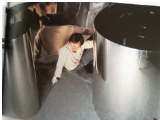
▲〈悟與物〉西元 1985 年 20x1.2 公尺。