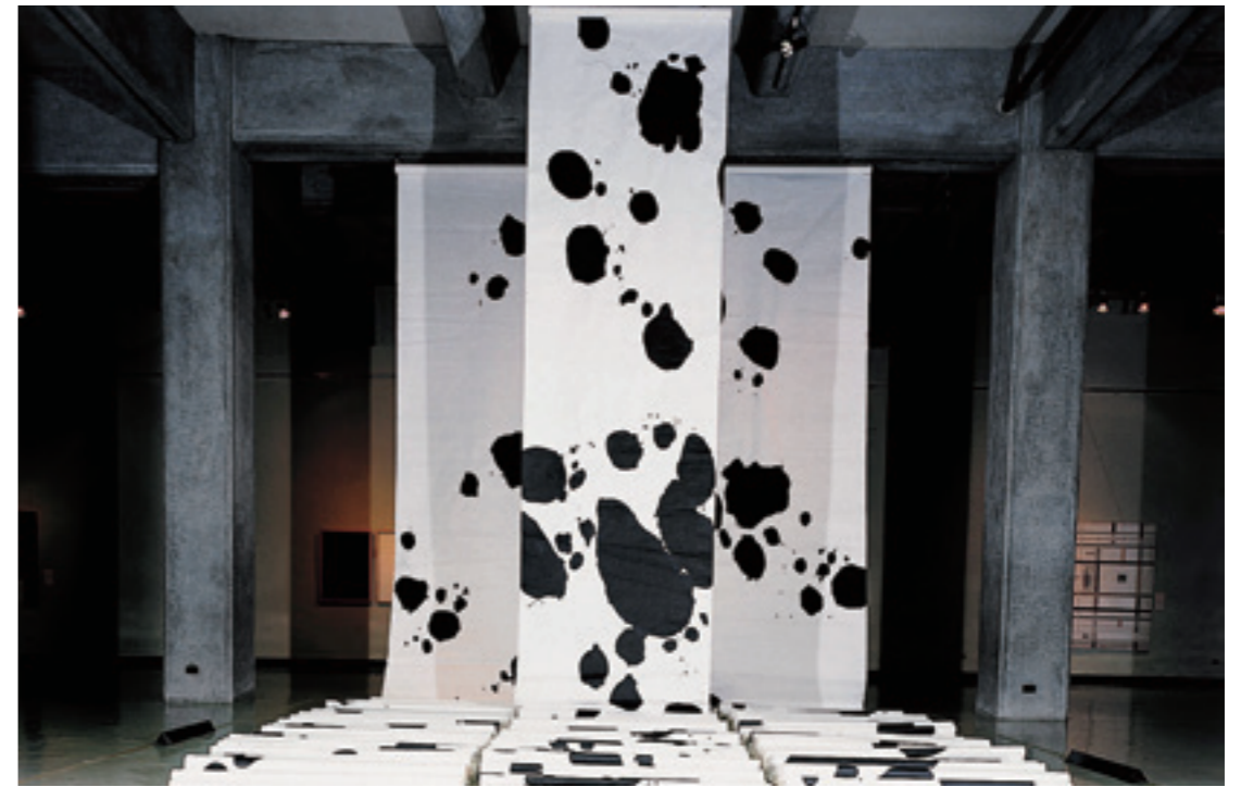
▲ 〈源源不絕〉西元 1986 年 水墨裝置 10565x137cm。

張永村的現代水墨，在結構、造型上，如此別出新裁，在空間的戲耍上敢於大膽挑釁，現在看來仍未逾時，甚至仍具有未來感，這與張永村活潑好動，才思敏捷的個性有關嗎？原來從小就愛畫畫的他 6 歲前就會游泳與打撞球，國小 5 年級時便獲得世界兒童畫比賽金牌獎，同時也是學校的田徑選手，直到高中他仍是田徑校隊，