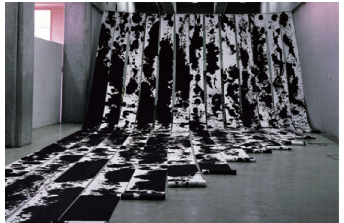
▲〈源遠流長〉西元 1984 年水墨裝置 5000x1200cm。

神」驟然吸引著張永村的青澀靈魂。隨之西元 1984 年張永村被網羅參加以林壽宇為首的「異度空間展」，開展前包括莊普、陳幸婉、胡坤榮等九位參展者先進駐春之藝廊，進行突破畫布限制的布展，他們要將取自工業的材料，在空間裡玩出他們的創作。這對所有的參展畫家都是一項挑戰，因為大家早已習慣以平面繪畫為主。張永村的〈無所不在 - 弦音六十四轉〉是以塗上黑、白、墨綠的油彩，大小不一的矩形或方形木塊，從畫廊的階梯堆堆疊疊地排列至展覽場各處，無所不在地滲透各個空間，同時邀請觀眾更動作品位置。