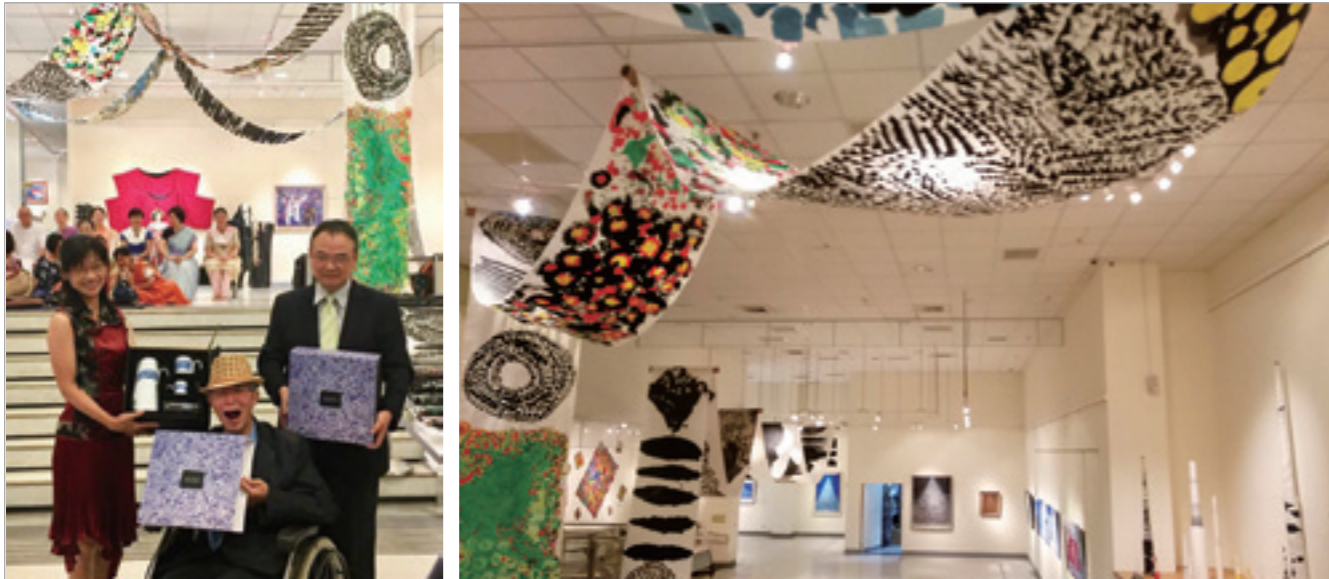
▲ 張永村於民國 107 年於臺中大墩藝文中心舉辦回顧展，現場展示歷年來的經典作品。

張永村 90 年代所展演的行為藝術，關懷人生存在世上所遭遇種種處境的不堪。忍者村是對美好生命遭受社會或戰爭迫害的悲憤控訴，以災靈人的身份安撫受災靈；蒙娜麗莎杜象村是對人心荒謬的自嘲反諷；能源法師以巫師化靈，超度怨靈；墨海僧人破除中國墨海魔怪，超渡亡魂；乾坤不老是對陰陽和諧，生生不息，宇宙生靈的關愛。張永村的行為藝術所創造的五種不同身分，是他由憤怒轉為悲憫，抒解自己療癒自己的修行之道，是他個人精神純化的歷程，由覺醒的意識到入道的「覺識道」，他似乎不只活出自己，已活出好幾個自己。引導他回到自己的面目。