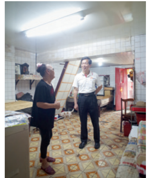
▲ 經過台電咁仔店志工一番整修，周奶奶家中顯得明亮乾淨。