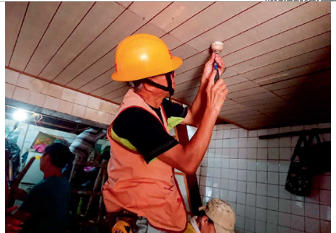
▲ 台電同仁協助清寒、弱勢家庭，免費更換屋內線路老舊耗材。

電咁仔店」通報後，立即安排志工完成田宅老舊屋內線開關、燈具換新工程，順利達成田老爺爺返家居住的願望，讓田老爺爺感動不已。