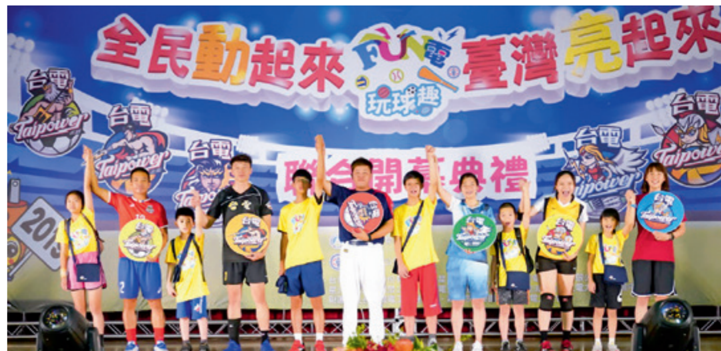
▲ 台電公司「球類 FUN 電營」各梯次在暑假期間陸續開訓。