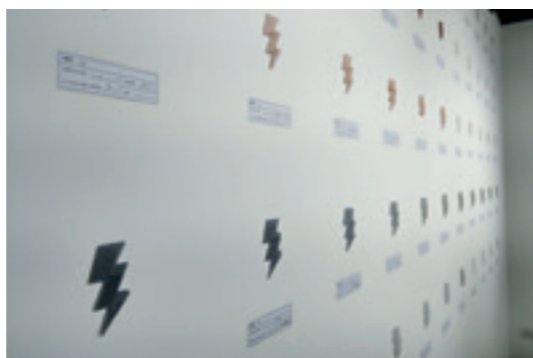
▲ 以台電煤灰、底灰塑材拼貼而成的電力標誌牆面。

長期目標更將整合社區，期望發掘有創意的新銳，建立地方據點、活化台電資產，打造台電文創經濟。🔋