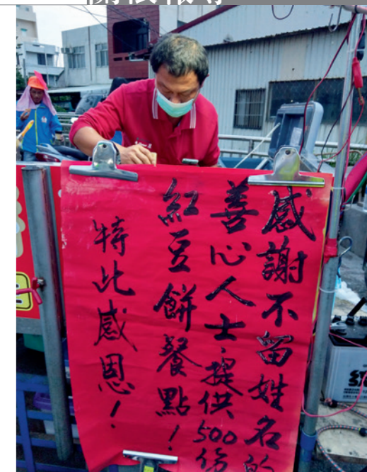
▲ 不具名的善心人士，請攤商免費提供民眾紅豆餅作為路程上的補給。

辦單位能通盤運用，無論是在行動補給或耗材上，都能夠彈性的使用，為路上的每位香燈腳們加油打氣。