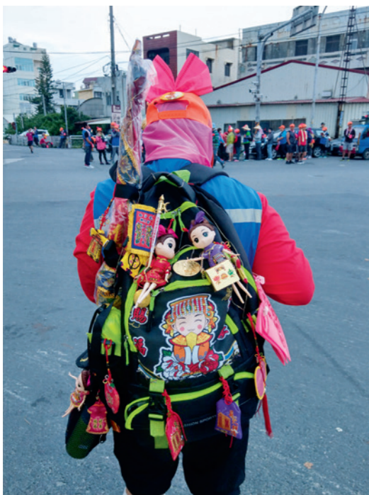
▲ 媽祖粉絲將媽祖化身為 Q 版娃娃，掛在背包上一同進香。

今年鎮瀾宮與白沙屯媽祖進香活動的起程日恰巧都落在清明連假的最後一日，過往兩位媽祖移動的時間會錯開，但今年日期重疊，讓不少民眾期待著兩位媽祖的不期而遇。說「不期而遇」，因為大甲媽祖遶境路線固定，即從大甲鎮瀾宮出發，經過彰化南瑤宮、西螺福興宮，再到新港