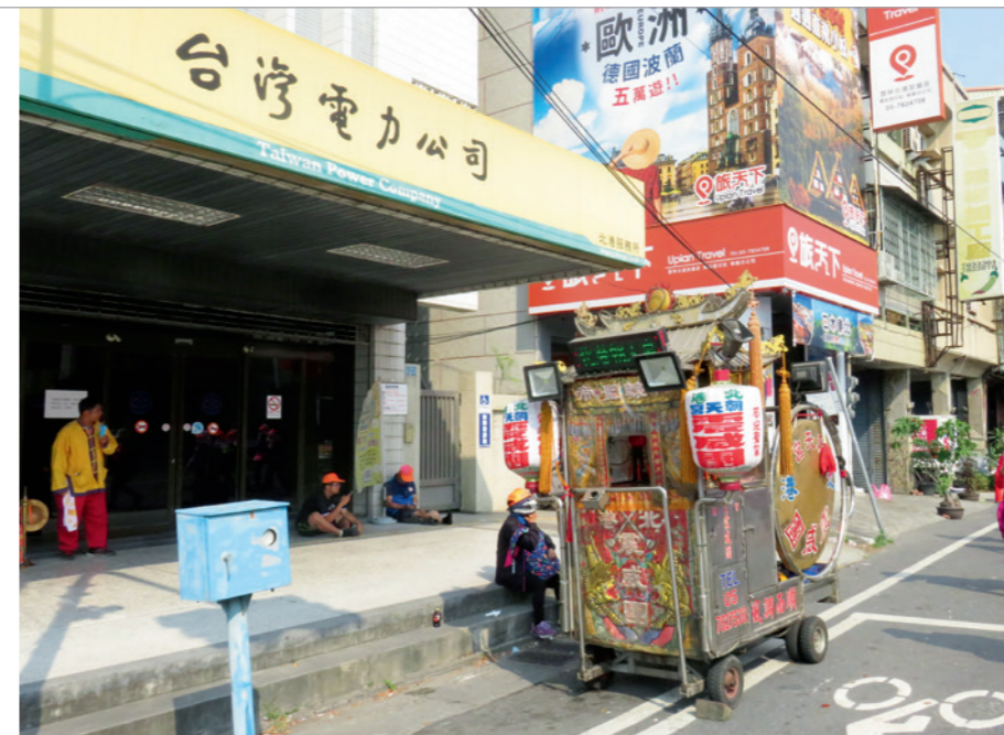
▲ 台電公司北港服務所，正好位於白沙屯媽祖進香至朝天宮廟的最後一哩路上。

一路上，有著熱情的商家、民眾，無私的提供水、飲料、水果、食物等，餓了、渴了，都能及時補充物質。就算走累了，也有巡迴的車子可以搭乘。這些人，可能與你素未謀面，但卻願意為你加油、祈福，讓人感受到臺灣在地的濃厚人情味。人與人之間協助，不在於金額或力量的多寡，而在於來的是否及時。秉持著讓活動順利圓滿的理念，台灣電力公司促進電力開發協助金審議委員會，每年以實際行動支持媽祖遶境及進香。透過經費的挹注，讓主