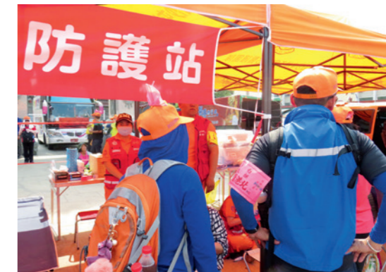
▲ 徒步行走累了、受傷了，一旁熱情的民衆及防護站，都能給予及時的補給及協助。

出門在外，跟著媽祖一起走過臺灣，看到大家的熱情，真的很難不愛這款臺灣味。無私的施與受，無怪乎許多老外來到臺灣參加了媽祖繞境 / 進香的活動後，就深深的愛上這塊土地上的人、事、物。而這項特殊的民俗活動，確實抓住了臺灣在地精髓。儘管活動結束之後，所有人都要回歸到自己的生活，但 10 天的漫步隨行，體驗隨遇而安、受人恩惠的不同人生，才是文化活動最難得且可貴之處。