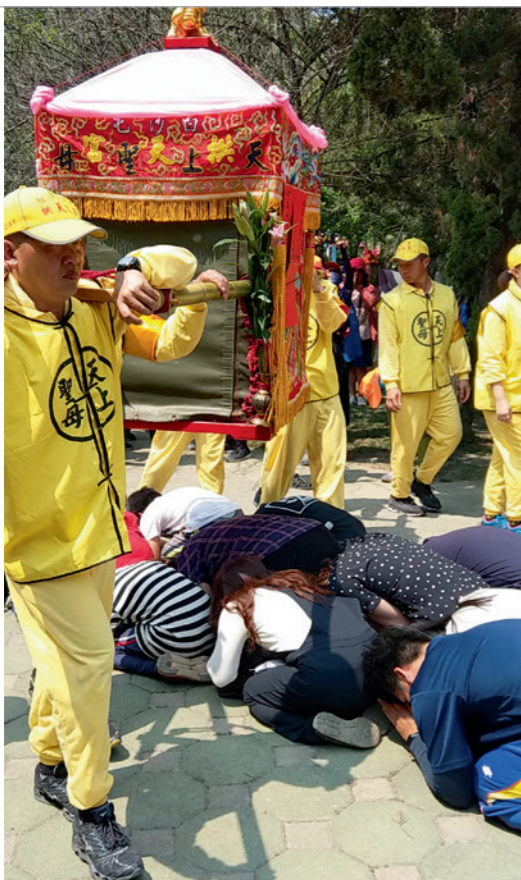
▲ 繞境 / 進香活動中，常見民衆鑽轎腳祈求媽祖保佑。

神轎到達之前，站定位置等待媽祖的前來，其實白沙屯媽祖的路線中，從北港保定派出所經過華勝路，進入北港朝天宮前的這一段路程，可能是白沙屯媽祖進香全程唯一一條固定路線。媽祖預定進到北港朝天宮的時辰是上午 11 時。不到 9 點時刻，北港的華勝路上，早已湧入許多民衆。大家頂著烈日，就為了等待白沙屯媽祖的粉紅超跑出現（白沙屯媽祖進香的神轎，是由 4 人所扛、方便移動的轎子，而神轎外粉紅色的頂帳及快速移動的速度，因此有民衆將神轎別稱為粉紅超跑）。