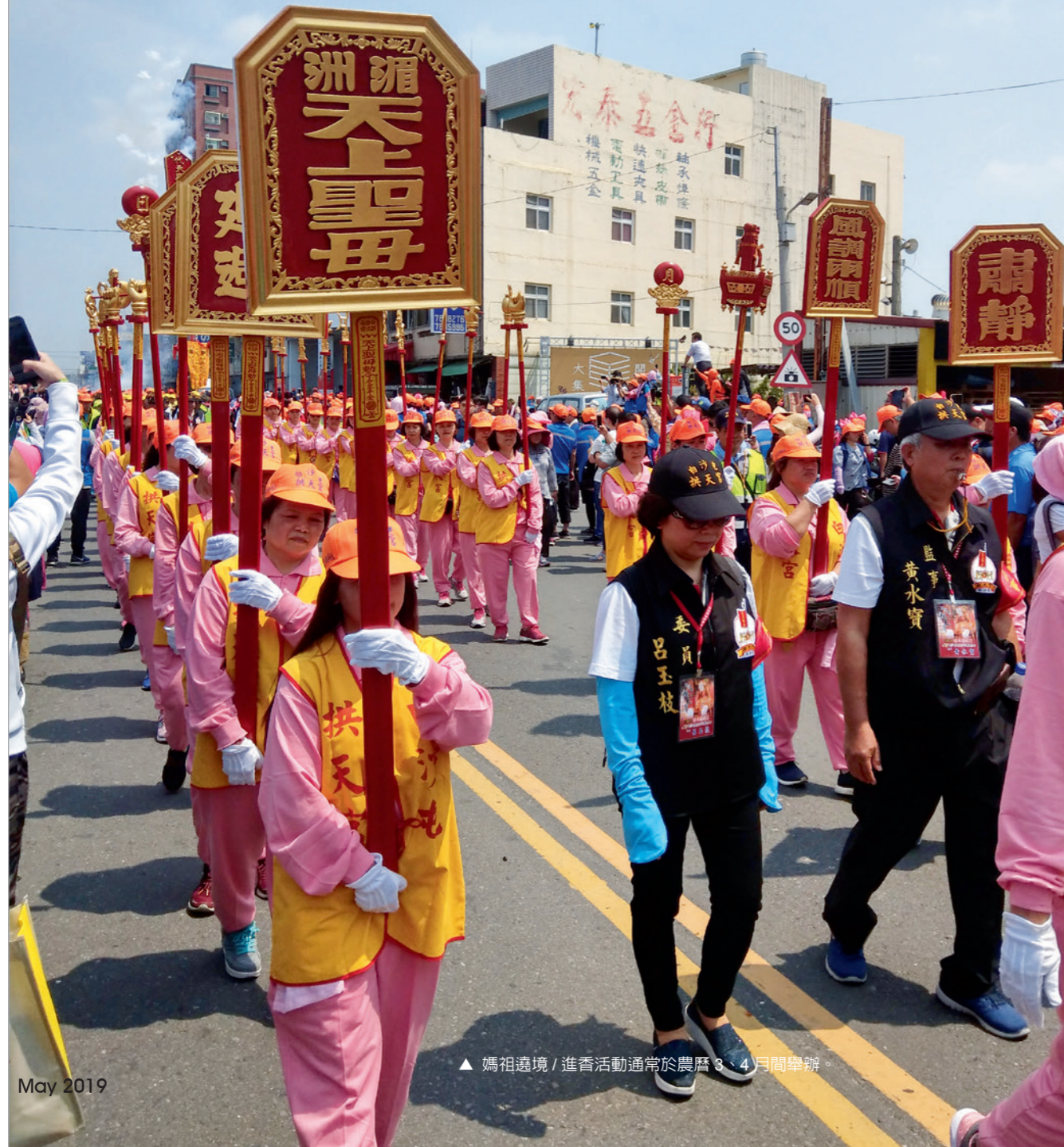
▲ 媽祖遶境 / 進香活動通常於農曆 3、4 月間舉辦。