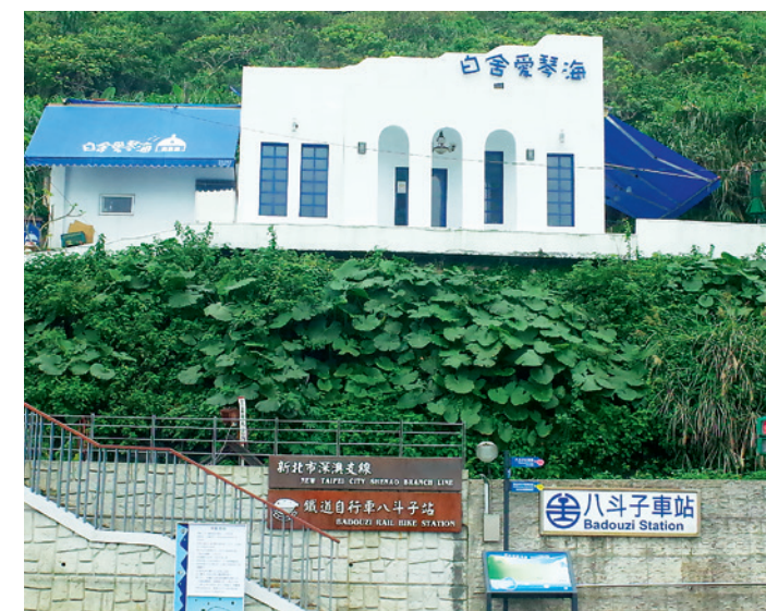
▲ 深澳鐵路自行車站就位於八斗子車站旁。

深澳鐵道是早期運送煤礦的鐵道支線，從基隆火車站延伸至現在的瑞芳水滴洞地區，但瑞芳金瓜石地區的礦產銳減，深澳支線營運不敷成本，後雖經改建，仍不及公路運輸之競爭，因此全面停駛，僅保留至深澳電廠部分供運煤使用。民國96年，深澳電廠停止發電，運煤鐵路也於該年劃下句點，支線停擺至民國103年，才因八斗子地區海科館的開張，重新啟動深澳支線的運作。目前的深澳支線起自八斗子，經過瑞芳、侯硐、十分、平溪等山線景點，以菁桐車站為終點站，串聯起基隆及瑞芳、平溪等地的旅遊景點。八斗子至深澳路段，則改建為鐵道自行車軌道，接軌基隆、新北的海線旅遊。