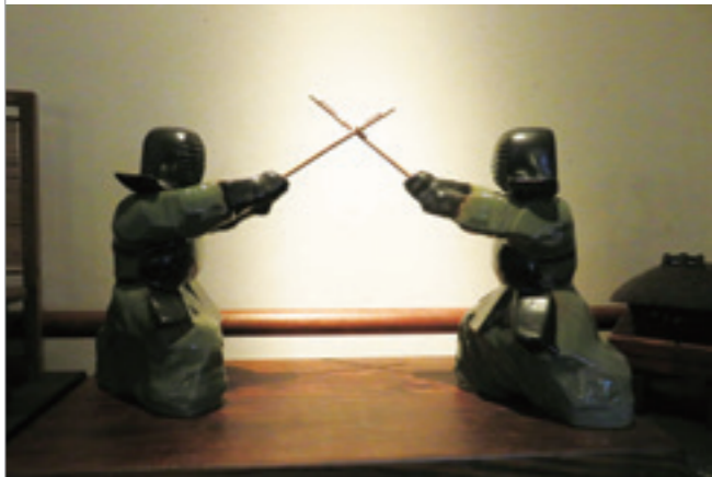
▲ 劍道最早源自於中國文化。