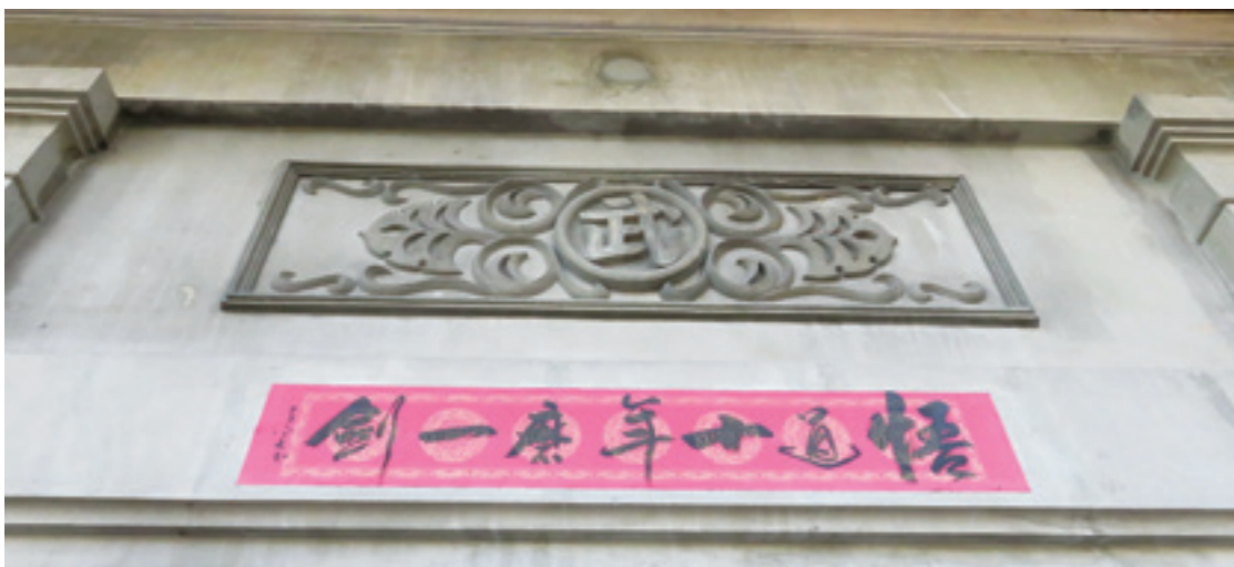
▲「惟和館」正門上方的「武」字鬼瓦，頗有威震八方之勢。

藝入道」、「實習踐履」六大路徑來發展與實現教育理念。其中，將節氣時序融入生活脈絡，讓孩子做中學、學中做，是非常重要的體驗與思想。民國 100 年，校方為推廣 24 節氣生活的課程，四處尋覓適合舉辦茶會的地點，偶然之間路過演武場，發現這處城市秘境，探詢之下得知，員警們正進行著最後一次武術與柔道操練，之後場地將歸還給臺中市文化局，並循古蹟活化再利用方式，對外公開招標。道禾的經營理念與演武場屬性不謀而合，因而順利得標。彷彿是機緣巧合，也像是老天自有安排，一切都顯得自然而然、順理成章。