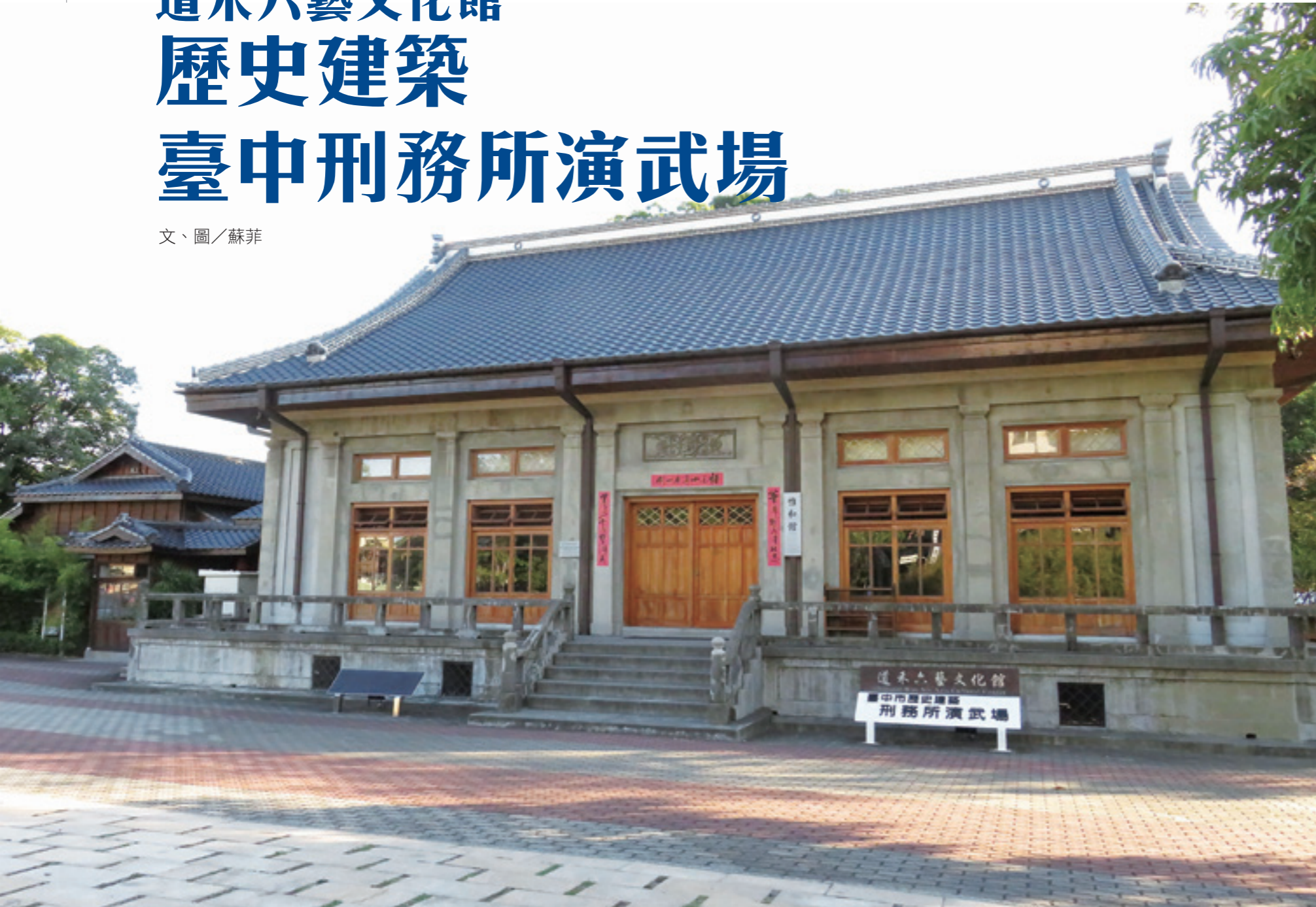
▲ 整修後的道禾六藝文化館，日式建築洋溢古典氣息。