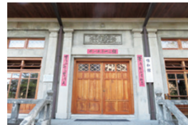
▲「惟和館」館名取材自《尚書》中「惟和」一詞，以和其氣，名其德。

禮儀的認識與學習之中。「樂」指「古琴」，是一種中國的古樂器。「射」即「射箭」與「弓道」。射箭是少數動靜兼備的運動項目，需要極高的專注力與正確的指向；古書中更比喻，「君子言行舉止如同射箭一樣」，必須懂得反躬自省，才能免於傷害他人。藉由實地射擊體驗，學習身體的平衡與放鬆，達到心念合一的境地。「御」的新解為駕馭竹劍，即「劍道」；劍道講