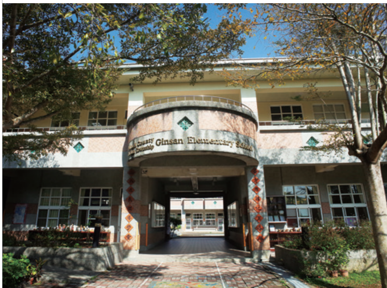
▲ 位於卓蘭山中的景山國小

苗栗，是個富產農作物的地區。包括大湖草莓、卓蘭柑橘、銅鑼菊花，都是苗栗外銷全臺響噹噹的農產品。每年的產季一到，苗栗地區總是湧入絡繹不絕的旅客，親近自然、賞花，體驗親手採擷果實的樂趣。