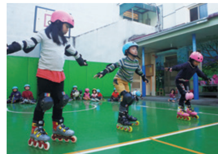
▲ 孩子們在戶外練習直排輪。

校則用心教學，教育在地。景山國小、卓蘭電廠更利用暑假期間，共同舉辦華裔青年暑期活動，邀請華裔學生來到景山國小舉辦營隊，同時也與卓蘭電廠密切互動，首先參觀水力電廠，孩子們在電廠同仁的帶領之下，參觀發電機組，認識發電原理，也懂得珍惜電力資源的得來不易。接著，營隊同學更在電廠中種植蜜源植物—澤蘭，讓紫斑蝶在春暖花開的時候，聚集到卓蘭的山上，找尋屬於牠們的棲息天堂。