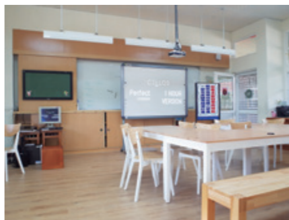
▲ 窗明几淨的英文課教室。