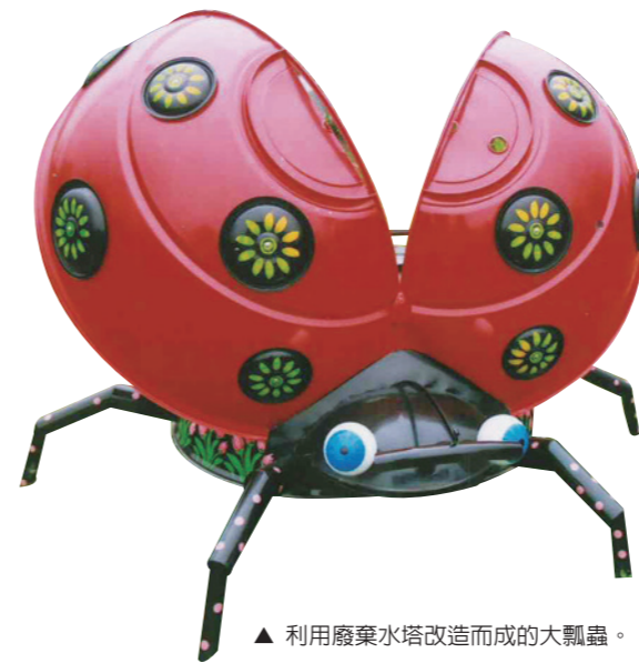
▲ 利用廢棄水塔改造而成的大瓢蟲。

後來為了維持家庭生計，僅靠兜售畫作，偶然成交才有收入，終非長久之計，祇好去畫廣告招牌，他笑說其實拿大刷子畫廣告看板與拿小畫筆在畫布上作業，實在是異曲同工，重要的是有沒有投入自己感情，擺脫匠氣，樹立獨有風格。因此，剛開始很認真揣摩世界名畫，參考不同類型的筆觸、色彩、光影等，更重要的是調色油漆與實物神韻筆觸必須完全符合廣告的需求與格式，否則就會流於全功盡棄，再次重新搞定，那就勞民傷財，自討苦吃