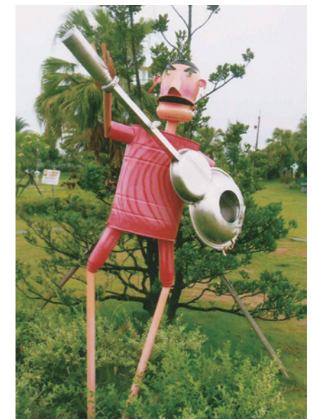
▲ 廢棄的加油桶製成彈吉他的機器人。