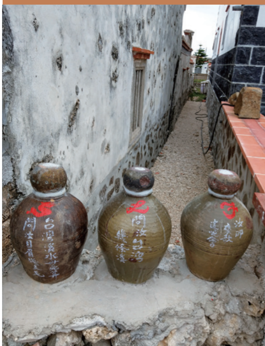
▲ 巷弄中隨處可見有趣的褒歌文字。