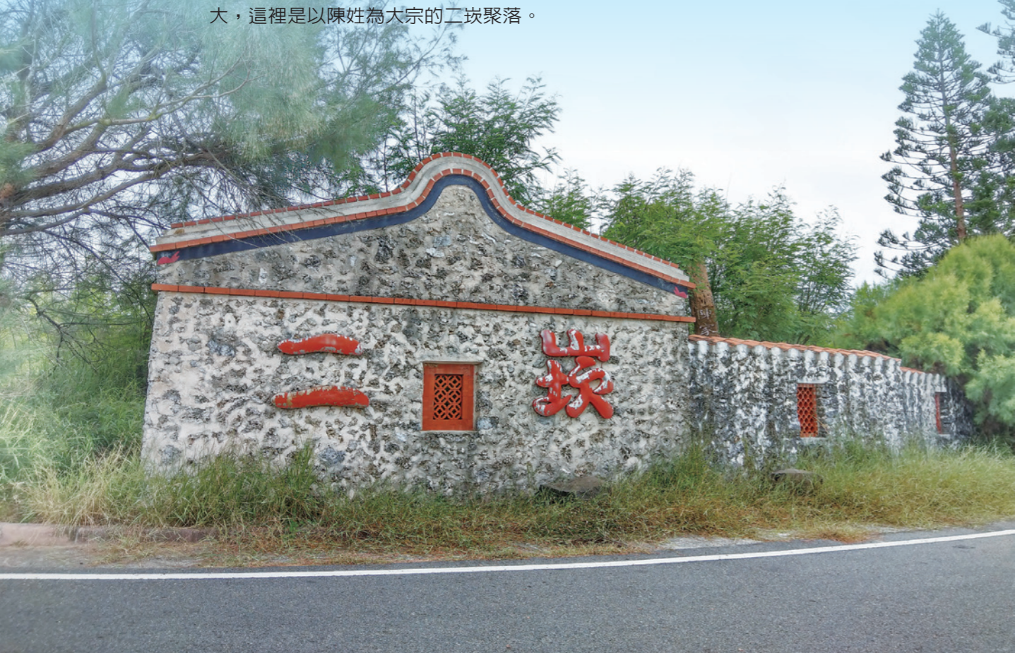
▲ 二崁聚落是內政部指定的第一個傳統聚落保存區。

從馬公出發，走過跨海大橋一路往西嶼島前行，一個身處於南北高地間，由咾咕石堆疊出的古老建築聚落，默默的唱出自己的特色，駐留在此地的子弟們，努力維持著特殊的建築以及褒歌文化，並將之發揚光大，這裡是以陳姓為大宗的二崁聚落。