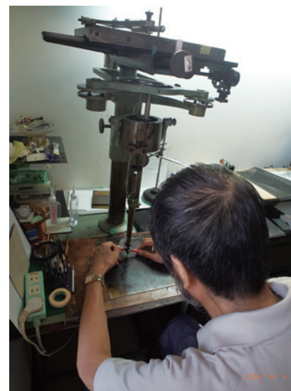
▲ 利用縮刻機調整圖案大小比例。