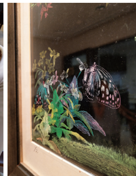
▲ 孫文雄的透明凹版印刷作品，黑色的背景凸顯色彩及線條更顯立體。