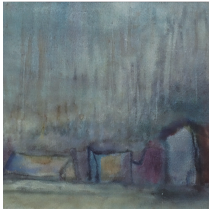
▲ 王攀元《蘭陽的雨》(西元 1975 年)。

農家女出生的妻子，在中國大陸也是住茅房，來臺灣還是住茅房，且一住十幾年，有時茅屋破，被颱風颳壞，他們便買來竹子重新搭建，而王攀元由童年時住宮殿來臺後住茅房，真是情何以堪！難怪他感嘆：「在蘇杭，春風春雨惱煞人；在臺灣，春風春雨太無情。」。王攀元一家人便在淒風苦雨中節衣縮食，艱辛度日，直到王攀元的個展畫全部為人收購後，他們才終於有了可遮風避雨的新家。蘭陽無情的雨，讓王攀元活在擔驚受怕中，然而他筆下的〈蘭陽之雨〉（西元 1975 年），卻以一片