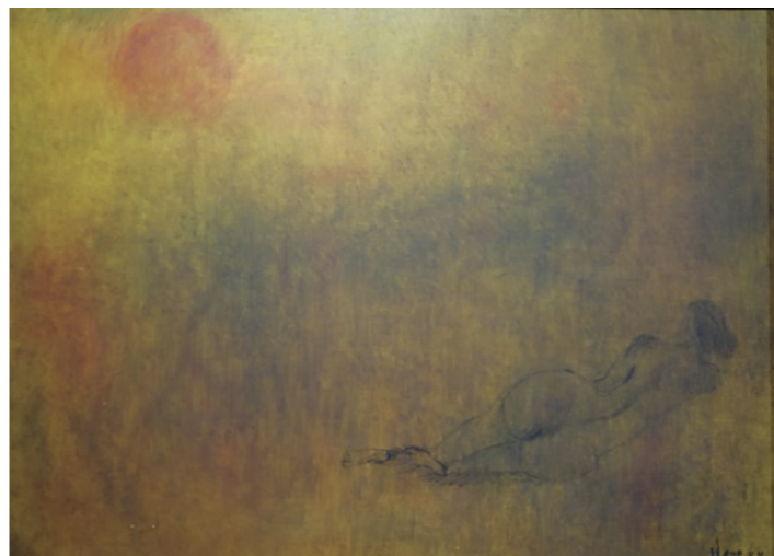
▲ 王攀元《秋思》（西元 1982 年）。

他們生活得非常清苦，有一天王攀元累的一身從碼頭回家，卻見妻病兒哭，家中米缸早已空空如也，他不得不寫了借條向友人借米，沒想到朋友也快斷糧，竟慨然借他一半，令他非常感動。幸好，西元 1952 年他離開當了 3 年工人的鳳山，北上宜蘭任教羅東中學當名美術老師。王攀元雖有固定收入，生活仍是捉襟見肘，總是以破屋、草寮為家，他又如何能料到從此在宜蘭終老，異鄉頓成故鄉，而故鄉仍在天涯海角。