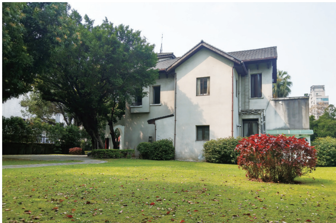
▲ 台灣電力會社社長宿舍一隅。