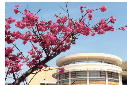
▲ 在全校師生的努力下，校門前那條原本沒有櫻花樹的櫻花路也綻放了櫻花。