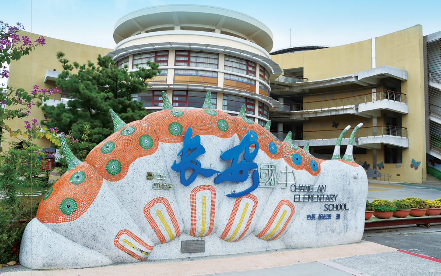
▲ 以都市生態小學之理念建校的長安國小校門和圍牆是超可愛的「毛毛蟲家族」。

「一個人，跑很快；一群人，跑很遠。」 臺中市長安國小從 102 學年度就開始在全校推動環境教育本位課程，並在高年級落實能源教育，老師們更集思廣益，發揮各領域專長，自己動手編撰教材，建構和設計出獨具特色的環境教育教學指引，成為臺中市乃至全臺灣環境教育重要的學習標竿學校。就是這種眾志成城、齊心協力的作為，不但讓長安國小連續 3 年獲得臺中市低碳校園金牌級認證標章，更獲得經濟部和教育部分發的推動能源教育績優學校的獎勵。