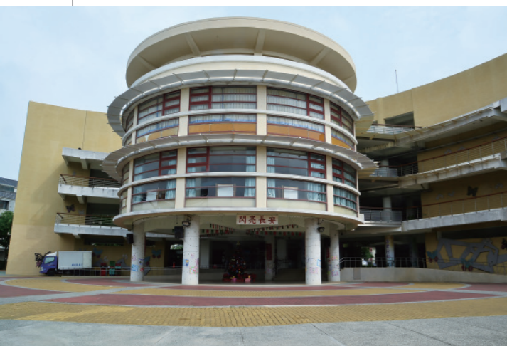
▲ 校園主體圓形建築達到四面採光，兩側翼型的設計則充分考慮到室內通風。