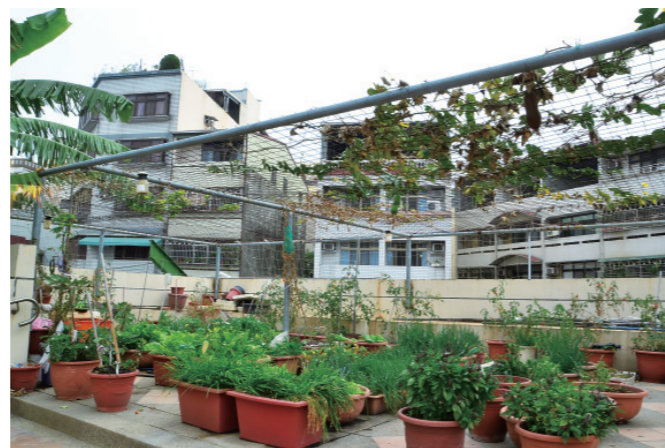
▲ 教學農園讓學童體驗食農教育。