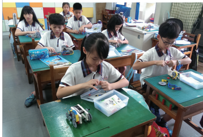
▲ 能源教育課程 -- 太陽能光電車教學。

誠如黃校長在校內師生環境教學分享研習會上的有感而發，低年級系統化體驗式介紹學校環境，讓孩子親切認識與真實接觸，並教育孩子對大自然的責任感；中年級追求藝術化與創新化的教學，連介紹生態池都能讓孩子發揮團體創造力，表演魚、花與布袋蓮的對話；高年級延伸愛鄉愛土進而介紹環境意識，諸如太陽能、節能減碳，除了各種影片與實例的震撼之外，更透過全學年辯論活動探討太陽能與核能