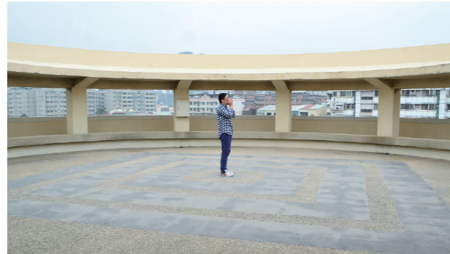
▲ 圓形屋頂是師生口中的小天壇，其特殊的設計有回音壁的效果。