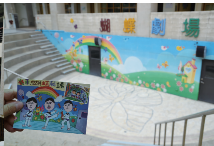
▲ 戶外小型的蝴蝶劇場。