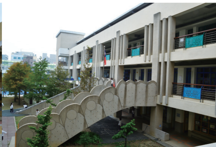
▲ 校園階梯也是毛毛蟲的造型，安全防護則多了蝴蝶。