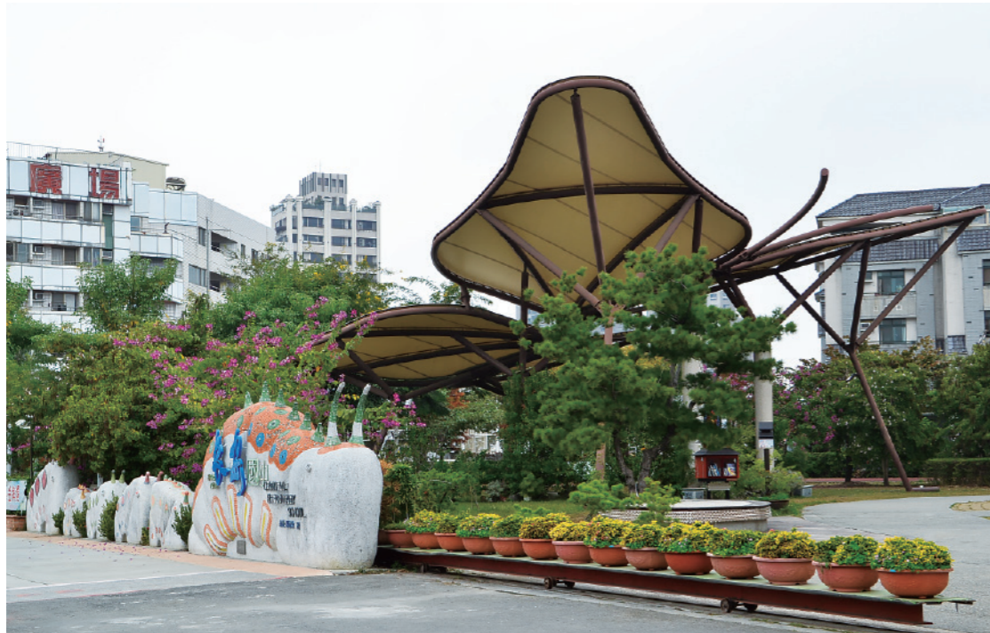
▲ 校門後方的大蝴蝶公共藝術構成羽化成蝶的意象，也意味著學校養成教育的重要性。