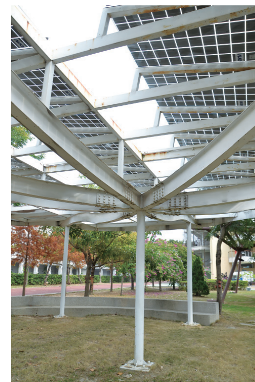
▲ 太陽能綠葉亭，是學校實施能源教育的素材和課題。

長安國小校門前，是一條車流量並不大的馬路，有個好聽的名字叫「櫻花路」，所以長安國小在創校時，曾有人提議「櫻