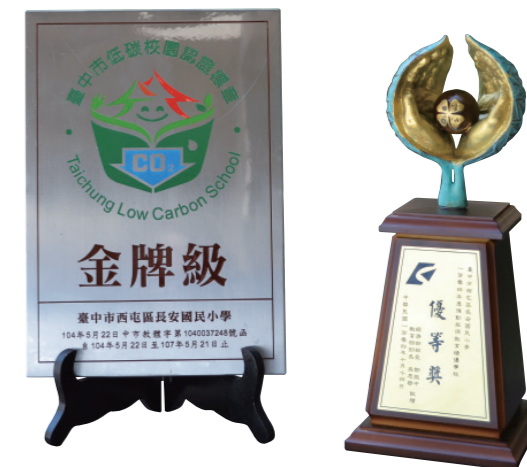
▲ 長安國小獲得低碳校園獲得臺中市低碳校園和推動能源教育績優學校的榮譽。

這讓我想到，孩子的可塑性這個教育話題，一直以來都受到廣泛的關注和討論。專家發現，每當我們改變一種教育模式，孩子就會順勢轉彎，他們的可塑性和韌性