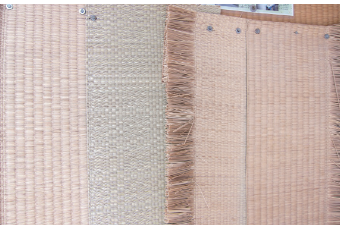
▲ 門口陳列的樣本，由左至右前兩種是臺灣大甲藺草，第三第四是日本琉球及熊本藺草。

從新美街街頭悠閒的散步，沿途經過臺南意麵、古早味冬瓜茶等店鋪，一個綠底白字的小小招牌跳進我的視線，不起眼卻很好找。店面是狹長形的，一張放置榻榻米的工作檯非常醒目。入口處陳列著四種不同種類的蓆面，分別是前兩種的臺灣