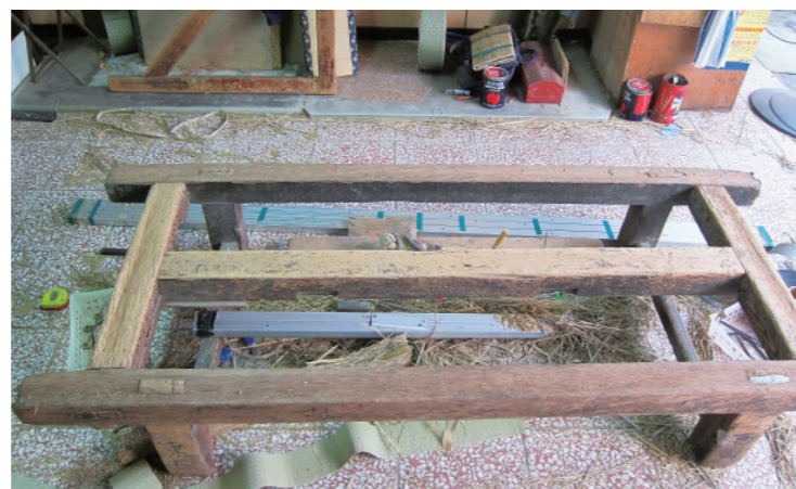
▲ 擺放榻榻米的工作檯。