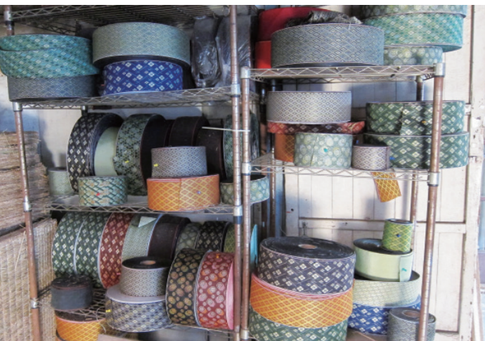
▲ 質感精緻的緞帶，是包邊的主材料。