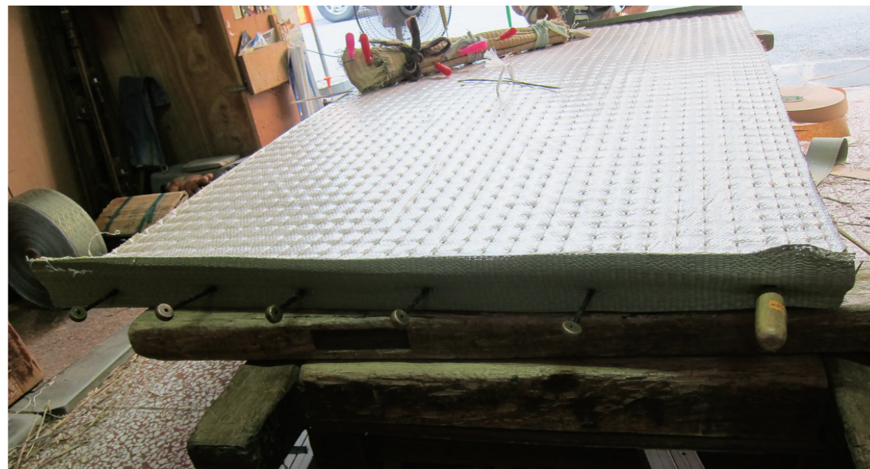
▲ 頭尾各 6 把席頭針用來暫時固定席底與席面。

經過幾次衝突，李宗勳開始反省：「阿公辛苦一輩子，現在年紀也大了，這麼好的手藝如果沒留下來就太可惜了。」