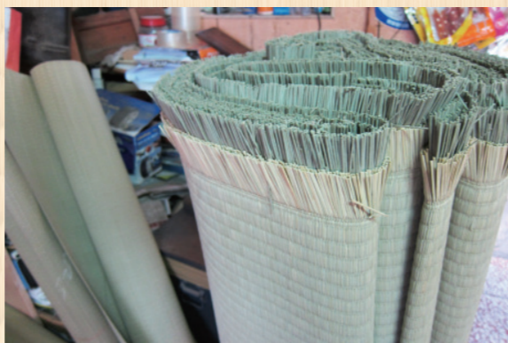
▲ 成網的榻榻米蓆面。

1. 蓆面：材料以日本藺草為主，以及少部分的東南亞及臺灣藺草。蓆面的材料簡稱「面材」。近年也有和紙