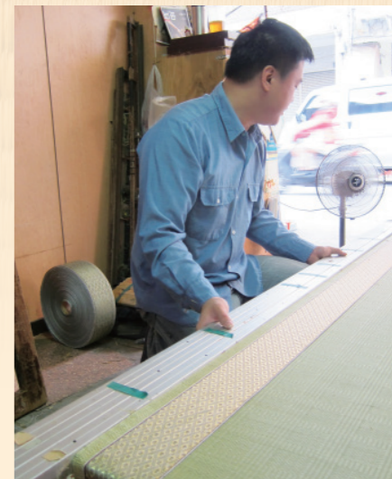
▲ 切割修整後，用壓尺確定平整度。

5. 包邊與固定：單邊切割修完後，用壓尺做平整度的再確認，若沒問題以滾邊布先暫時固定在蓆底蓆面上再鋪設一層牛皮紙(借用其硬度折出肩角)，然後縫合，固定。單邊完成並且固定後，再進行另一邊。最後包上緞帶布邊，才算大功告成。