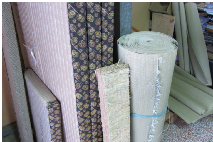
▲ 編織好的席面，成捆備好備用。