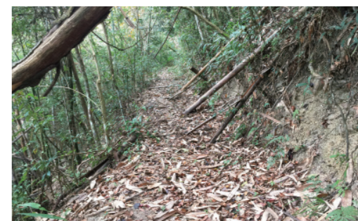
▲ 昔日的水社尾溪古道，現已人跡罕至