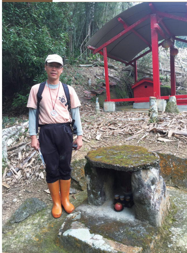
▲ 古道入口之大、小土地公廟