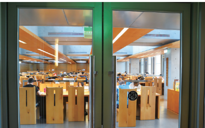
▲ 圖書館的最高層是擁有 250 席座位的溫書空間。