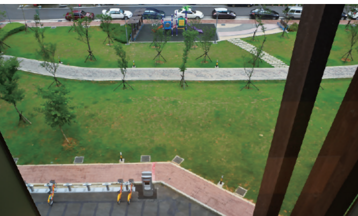
▲ 窗外有綠意。埋首書中的讀者，偶而抬起頭看看窗外的景色，顯然更能獲得心靈上的滿足。

殊造型的屋頂剖面，一個個天窗將北向柔和的自然光引進室內，使得溫書室在有日照的時間內都能十分明亮。白天讀者只須開啓桌上的閱讀燈即可獲得充足的照明。這種天花的設計結合了燈具、吊扇、天窗和空調出風口，天窗可透過電動開啓，除採光外更具有通風的功能。這種兼顧採光、通風、節能的设计，實踐了綠建築設計的精神。