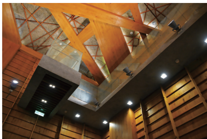
▲ 位於挑高大廳半層處的樓梯平台像科幻電影裡會突然消失的藏 身處，但登上之後，空間的全貌又整個翻轉了過來。