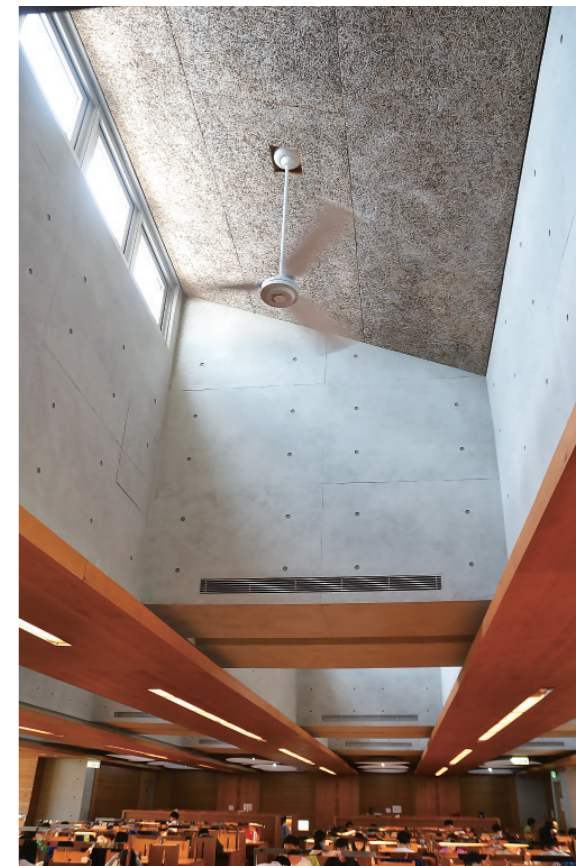
▲ 4 樓溫書室天花的設計結合了燈具、吊扇、天窗和空調出風口，天窗可透過電動開啓，除採光外更具有通風的功能。

圖書意象創造了建築本身的自明性和辨識性，民眾能夠輕易地從外觀辨認並且記得這座社區裡的圖書館。