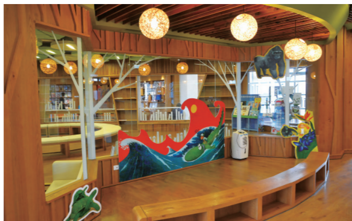
▲ 2樓是以服務小朋友為主的兒童閱覽區，這是給孩子們的閱讀 天堂。