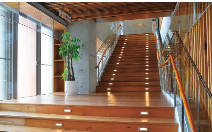
▲ 接近 3 樓平面的樓梯平台，級踏高度的變化提供了讓讀者能夠坐下來階梯，讀者可以自由且隨興的展開各種閱讀行為。