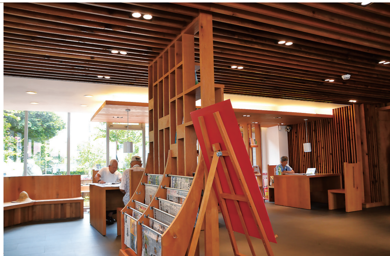
▲ 透明化和小尺度的閱報門廳，營造在「樹下」閱讀的氛圍。

刻文字，品讀這些字句的同時也一步一階踏入了書中的殿堂，與地面字句相呼應的是入口側牆上中文鉛字造型的公共藝術作品「現場閱讀」，錯落地反印在簡潔、微微曲摺的白牆上，好像過去印刷工廠已經排好的鉛字書版，正等待付梓，每天進出的人們都是這本書的第一位讀者，書頁變成了立體的活字印刷。這些充滿鄉愁的文字創作中容納及轉換了舊有的眷村記憶，時至今日，繼續刻載著，讓讀者品味文學扎根於土地間的力量。