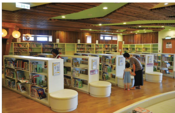
▲ 圖書館這棵「大榕樹」，從土地汲取著營養，然後在2樓開枝 散葉，在這片青綠的背景中，小朋友就是這裡的主角。

走進室內，左手邊就是書報閱覽區，雖然這個室內空間被「壓低」了，但透明的落地窗，老榕樹的光影仍透過玻璃灑滿地面，室外一片氾濫的綠意就這樣蔓延進入室內。既然是提供社區居民一個閱報、輕談的所在，社交的機能尤顯重要，從內部不同型態的桌椅和迴轉的小空間設計，都在在為社區居民打造如自家牆外般輕鬆而自然的環境。