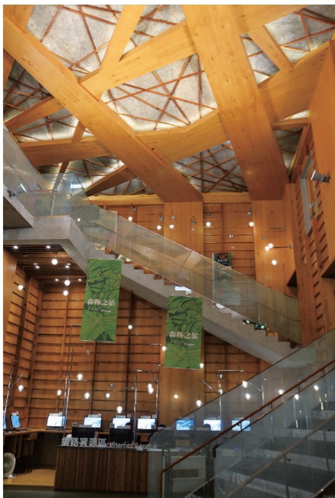
▲ 讀者大廳是個以木質包裹的挑高空間，如音樂廳般的高雅讓空間氣氛 瞬間改變，樹狀天花將光線柔和的灑落下來。