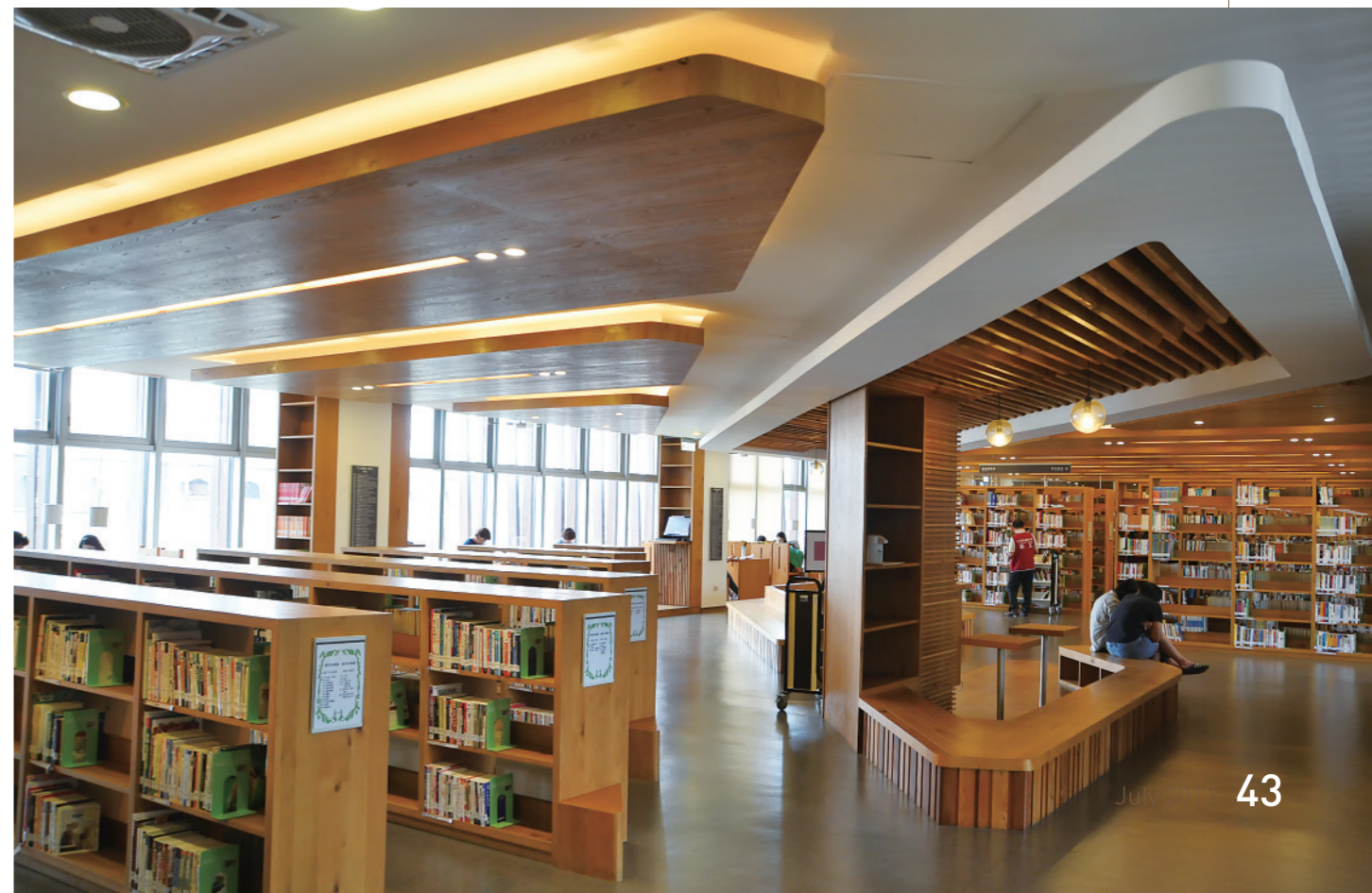
▼ 3樓南北兩側的光線充足，為館內的閱讀空間節省了大量的光源。

愈接近地面的樓層愈公眾，愈高的樓層愈安靜。基於這樣的理念，溫書室便設置在圖書館的最高層。而250個座位的溫書空間，照明是最大的難題，建築師希望使用者如坐在樹木的樹冠層，在天光下享受閱讀。靠近南北兩側的座位，可藉由室外窗獲得採光，那麼中間區塊的座位呢？一樣有自然光，抬頭往上望，奧妙就在特