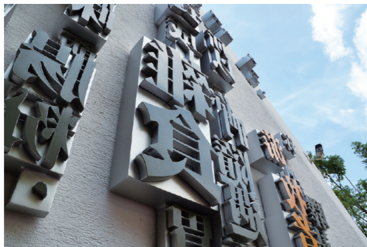
▲ 入口側牆上中文鉛字造型的公共藝術作品「現場閱讀」，錯落地反印在簡潔、微微曲摺的白牆上。