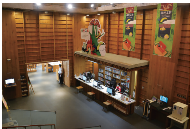
▲ 融合了古典圖書館的樣貌，暗示著知識殿堂的記憶。