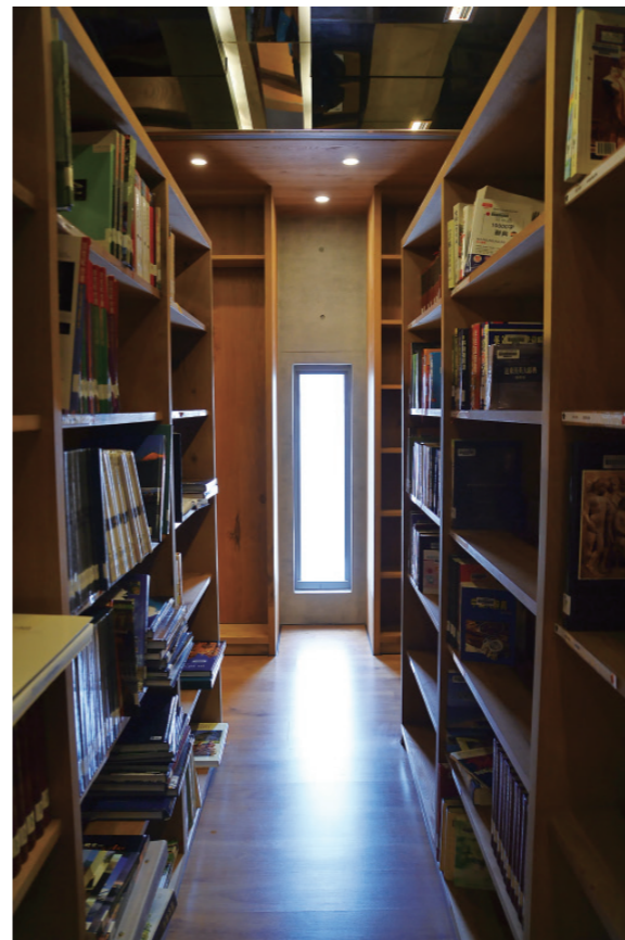
▲ 這就是外牆上的小開口透進來的光，有人稱它是「藏密之牆」。

書是圖書館的靈魂。如何讓外觀語言直接就能傳達出圖書館的功能？還沒有走進圖書館，就看到琳瑯滿目的書本。幾乎所有來到龍岡圖書館的人看到建築的外觀，都有這樣的驚嘆。南向立面直接面對社區，同時也是社區活動中心的出入口，這裡是圖書館的門面。於是，建築師在 2、3、4 樓外牆搭起了巨大的書架，放上 45 本「大書」，每本書高達 1 層，「群書之門」於焉誕生。除了美觀之餘，這 45 本木質外觀的「大書」還形成了遮陽過濾系統，適度的遮陽，不致讓室內的太陽光線過強，同時阻絕日曬、噪音及外在雜亂視野，讓民眾靠在窗邊看書時，同時看到美麗の木紋身影。這些韻律排列的