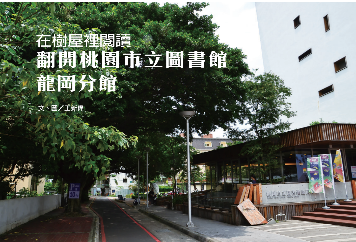
▲ 入口的老榕樹，把兒時的活動和記憶帶入了圖書館。

『你們是驛站民族，游牧者。所以，你們隨遇而安，養成了雜食胃口，廣東臘味飯腸粉、山東小米粥饅頭、四川擔擔麵紅油抄手、貴州糍粑、雲南乳扇、山西麵疙瘩……很純粹就是你們村上的吃食，哪來什麼「異國情調」。』