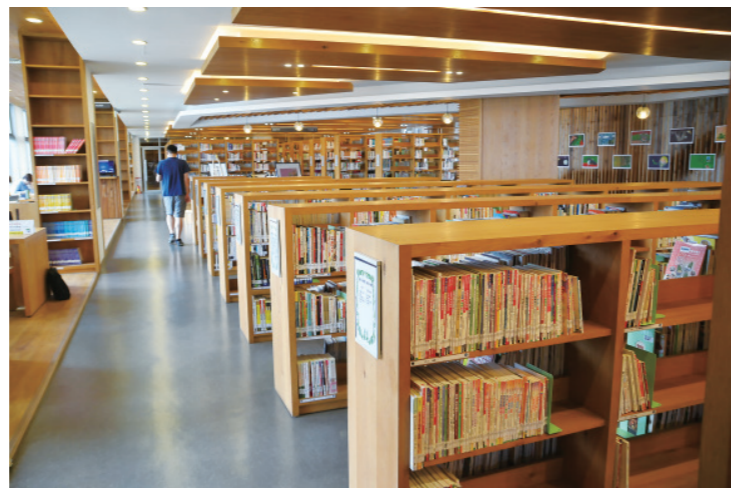
▲ 3樓豐富的開架式藏書空間位於中間地帶，良好的採光讓讀者舒適的瀏覽架上收藏。

片的玻璃窗做為動線的區隔，也是基於安全性的考量，視覺的穿透性是特別被注重的，當小朋友在樹屋中體驗閱讀的樂趣之餘，家長也能透過玻璃安心看顧著孩子，而這些玻璃窗貼了書本造型和樹木形狀的玻璃貼，既提點了空間的趣味性，也有提醒的作用，避免小朋友在走動時沒注意透明玻璃的存在而發生碰撞意外。2樓專為小朋友設計打造的可愛親子廁所洗手區，透過大面落地窗即能觀賞到戶外的綠景，牆面上不同高度的鏡子和一片片綠葉充滿了童趣，巧妙的設計讓這裡成為圖書館最受歡迎的角落之一。