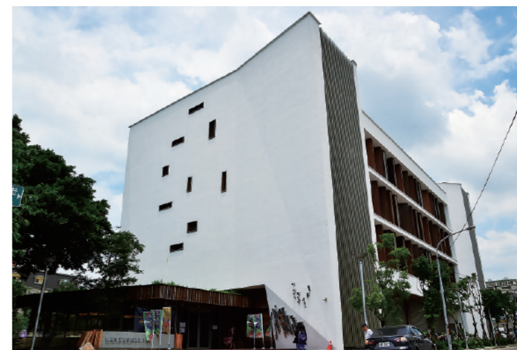
▲ 通體白色的圖書館外觀，就像兩本即將被翻開的巨書。

隨之，桃園市立圖書館龍岡分館便應運而生，不同於一般的社區圖書館，它從設計之初就定位是一個整合社區文化的公共圖書館，所以它所體現的設計價值就是回應空間的「公共性」。在面對網路化、城市空洞化和資訊普及化後的新思考，新的觀點認知圖書館已不再是單純的知識傳播設施，而是它必須以空間及服務，回應真正使用者，也就是居民時代性的需要，包括兼容多元文化。果然，龍岡圖書館於2015年底開幕，當它在台貿公園一出現，很快就成為社區的中心，設在圖書館1樓的社區活動中心以及地下停車場把公共圖書館的功能極大化了。