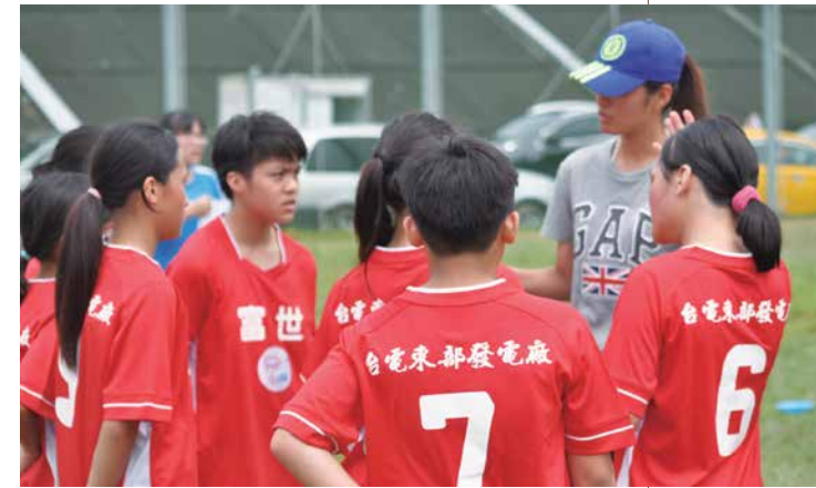
▲ 105 年度起台東東部發電廠認養富世國小足球隊，球隊成績愈來愈進步。

民國 83 年才成立足球隊的富世國小，操場上有著前幾任校長爭取到的 4 個球門，校方利用部分經費，購買足球讓孩子們盡情踢球。當時洛帝尤道教練的想法，只是想讓孩子開心踢球。未料學生們踢出興趣，下課時間一到，操場上總是充滿踢球的孩子。就連小一、小二的低年級同學，也跟著哥哥姐姐們一塊踢球。認真的表情，感染了學校老師，心想不知能不