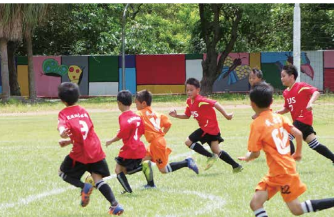
▲ 富世國小足球隊員們在比賽場上奮力踢球。

孩子們這才發現，比賽只是過程，享受踢球的樂趣，才是接觸足球的初衷。賽後回到學校上課的第一天，孩子便主動要求主任讓他們回到操場上踢球。主任心中也感到納悶，問學生們才比完賽，回來不用休息嗎？孩子們回答說：「我們想要更認真的練球，比賽的時候才可以更開心的踢球。」