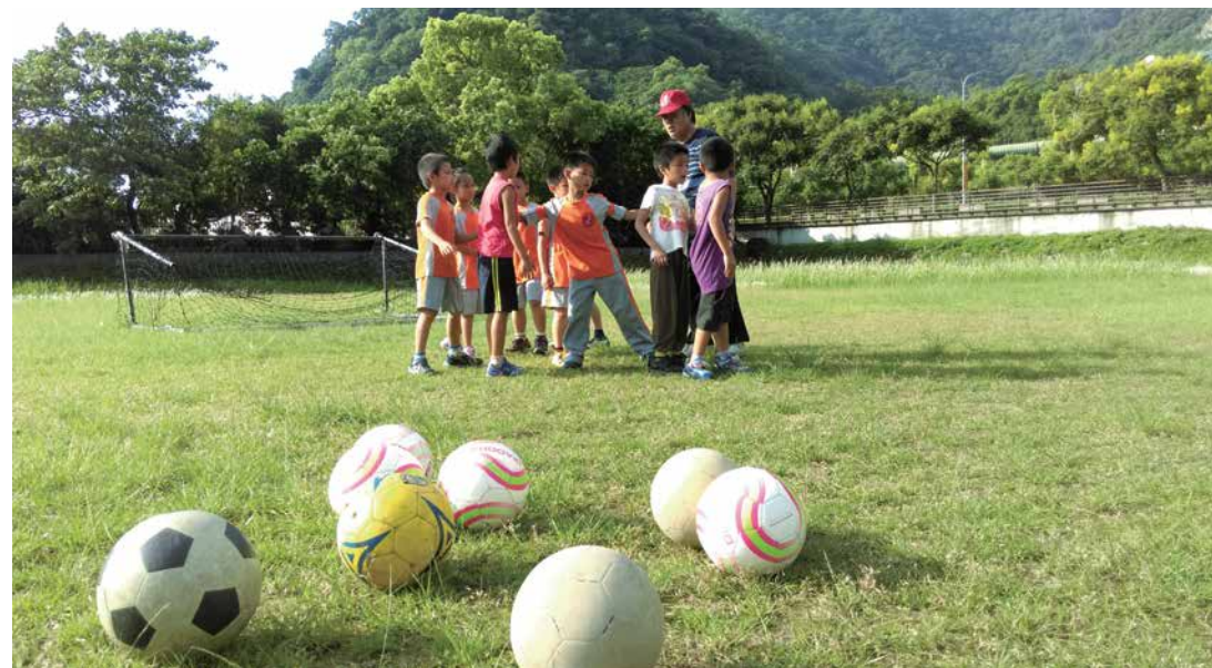
▲ 用足球，領著孩子開拓不同的視野。