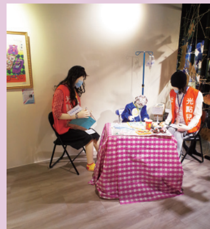
▲ 摹擬到家上課情況的現場展示。