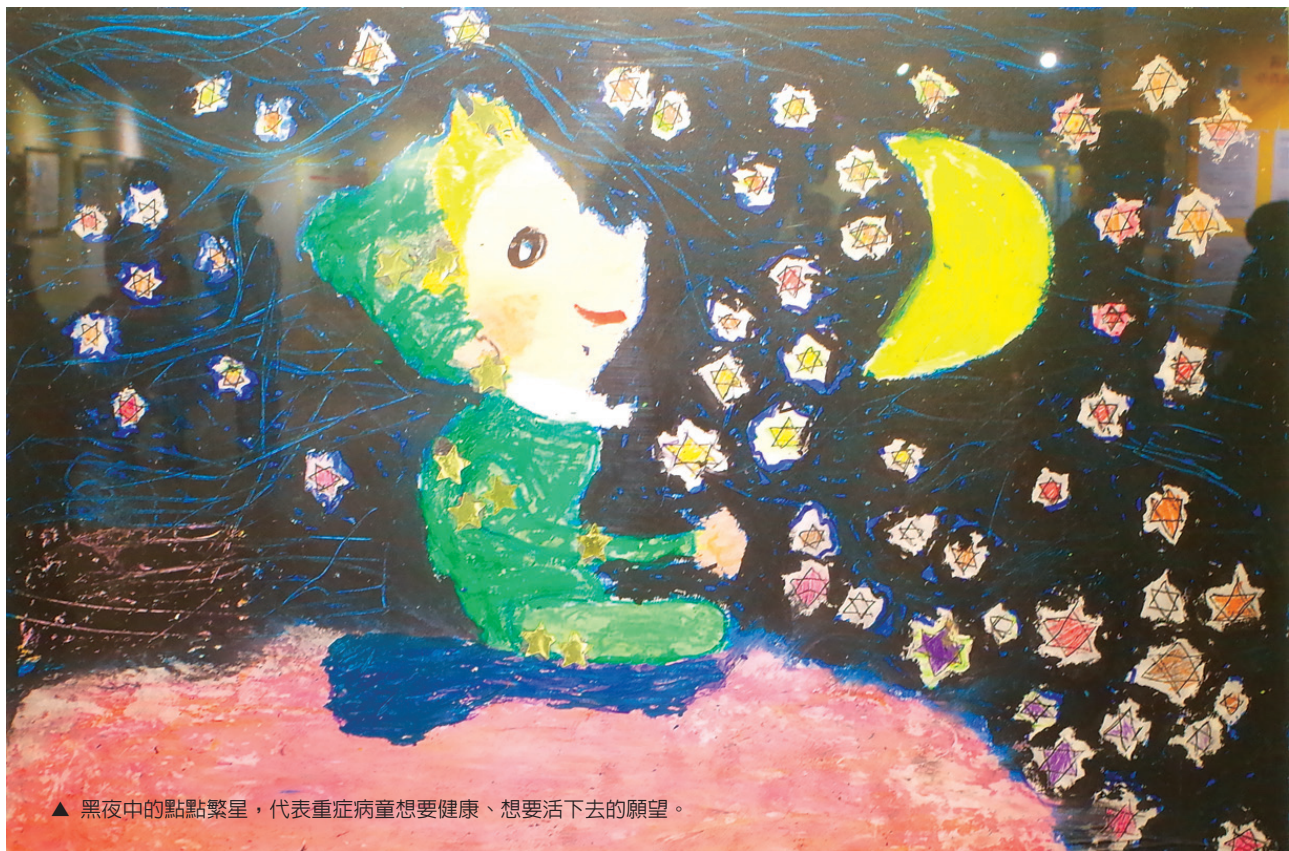
▲ 黑夜中的點點繁星，代表重症病童想要健康、想要活下去的願望。