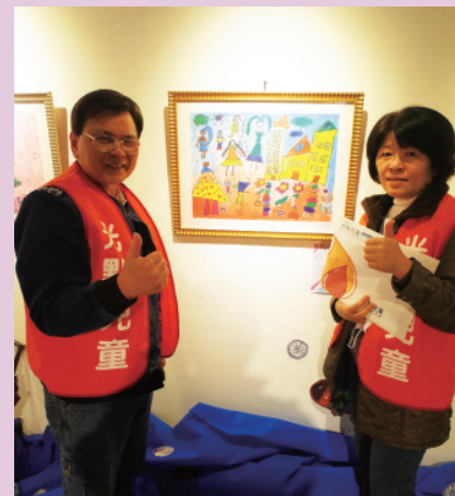
▲ 軒軒的阿公阿嬤以行動支持畫展的開幕，並與軒軒的作品合影。