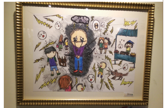
▲ 怡蓉透過生動的圖像希望大家能感受病患有苦難言之痛。