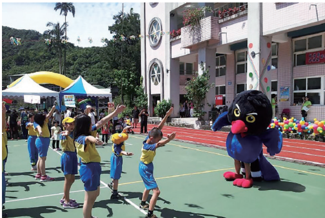
▲ 臺灣藍鵲茶參加坪林國小活動，向小朋友介紹坪林原鄉的製茶文化，是傳承的活動之一。

居民生計、產業發展與環境保育的三角間共榮共存，是「臺灣藍鵲茶」企圖以透過社會公益企業達成的有機結合，將人的文化、生產融入自然保育之中，建立土地品牌、打造坪林生態村，為坪林的茶產業找到新出路。