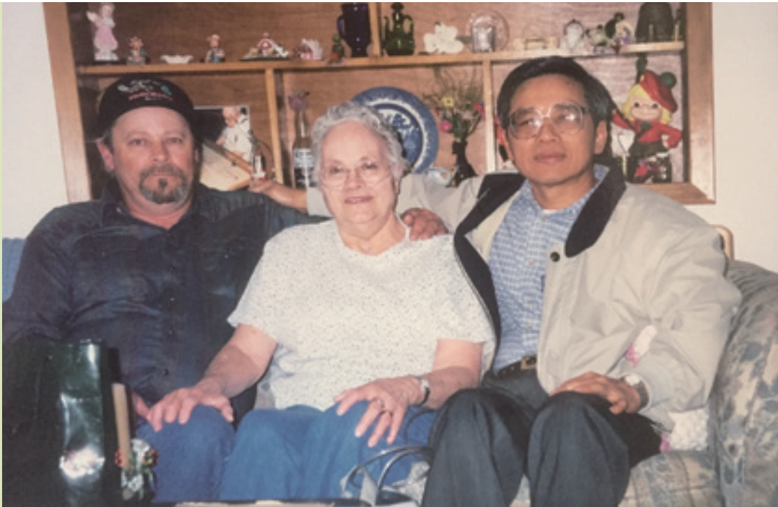
筆者於西元 2000 年 6 月，專程飛往美國愛達荷州拜訪了這位救命恩人及其母親，當面向他們致最高的謝意。

件事之發生，領悟到人的生死只在一瞬間，生命需要靠運氣。經歷了這一場瀕臨死亡能夠活過來，不論是上天或是救命的人賜給，都一直心存感恩。事後每天日以繼夜地尋找救命恩人，有一天終於如願以償找到了，從此以後，跟年輕人的媽媽可以用通信方式保持聯繫了。經過幾次的通信後，約定在西元 2000 年 6 月飛到美國愛達荷州拜訪了這位救命恩人及他的媽媽，當面向他們致最高的謝意。經過 29 年的漫長時間後第一次見面，母子二人喜極而泣，非常高興。對我而言，心中更是百感交集，不知如何感謝，只能說沒有他們就沒有現在的我。這位媽媽當時已從圖書館管理員退休了，是一位和藹可親，心地善良的人。此時也發生一個小插曲，她為了我們的到