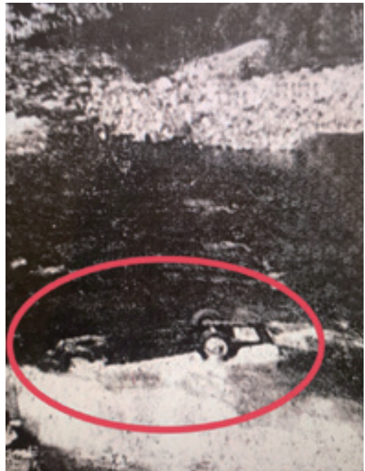
車子翻滾後四輪朝天半浮在水上。

Creek 行駛，此時剛好是山上積雪開始融解，河水溫度接近攝氏零度。在車子開了不久，車子突然像越野車飛向天空，心裡很緊張但不知所措，由於當時我是坐在司機後面的位置，不知道發生了甚麼事情，在短短不到三秒時間，車子連人一起沖入河裡並發出巨響，由於河流中佈滿了許多岩石，加上河床離岸上有二十呎的高度，因此產生極大的撞擊力，造成整個車身翻滾，最後四輪朝天車頭全毀。當時雖然還有意識，但是眼睛已失去視覺，眼前一片漆黑，覺得河水慢慢淹至胸部，此時腦裡已臆測要跟家人永別了。可能因受到大力的撞擊，不久便因休克不省人事，後來發