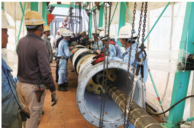
海底纜線的下放過程。

好不容易獲得進場施工權利，還需面臨天氣因素的考驗。首先，臺灣冬季有著強勁的東北季風，船隻作業往往避開此一階段。工期大約集中於清明到中秋這段暖和炎熱的季節。每一段海纜，在深海布線的時間大約需要3個星期左右，施工團隊必須掌握每段「可能的好天氣」，搶在惡劣天氣來臨之前，儘速完成海纜的放置。太平洋海面在暖洋時期常有颱風成形，常常是既快速又強烈，每次船隻出海進行作業，都是一場與氣候的搏鬥，團隊同仁回想起某次在海上鋪設海底纜線時，工程進度大約到一半，卻發現天氣瞬間轉變，風大浪大造成船身劇烈晃動，團隊同仁首先加強機械、工具等器材的固定，並視風浪情況決定是否收回海纜準備靠岸。所幸風浪終於平息，船上作業人員的驚嚇與擔憂，