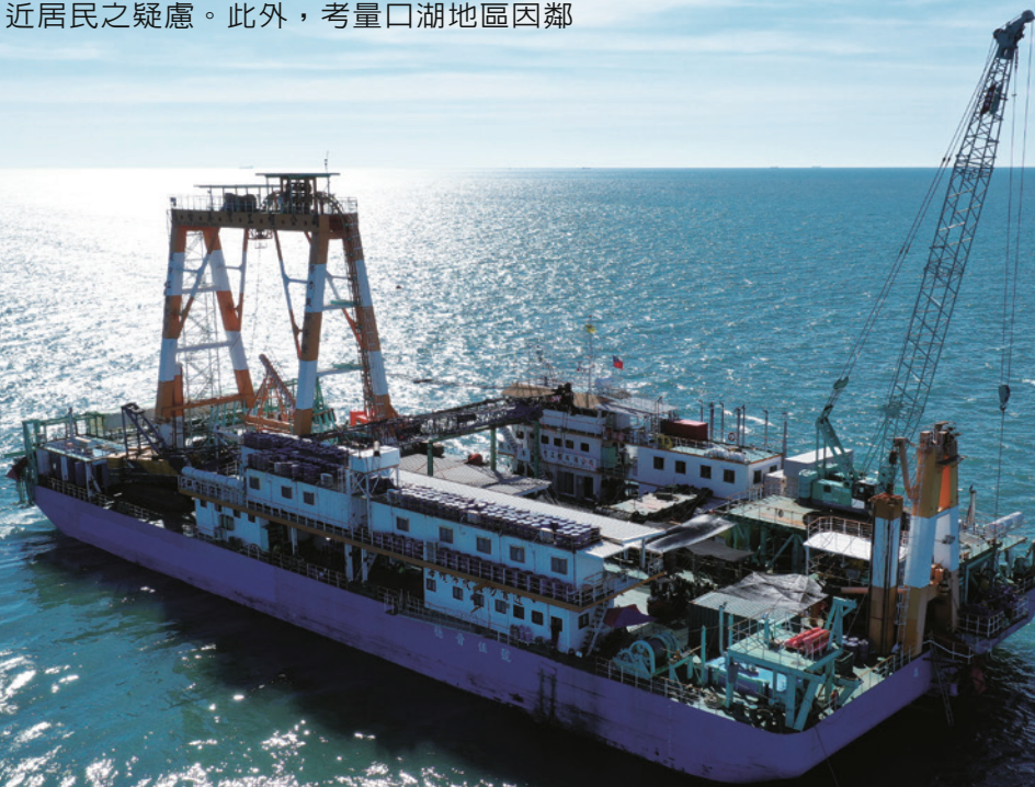
臺澎海纜的連結，完成臺灣邁入低碳島的最後一塊拼圖。

口湖市區路段之電纜管路工程除電纜接續人孔及少部分銜接管路必須採明挖以外，其餘主要管路（約 900 公尺）均採更高規格之免開挖推進工法，即無需於路面