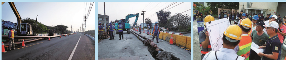
臺澎海纜上岸後的最後一哩陸管鋪設，在歷經多次與民衆的溝通後，採用推管方式施作，降低道路的開挖，避免造成鄰損。

當第一線同仁與相關意見領袖多次溝通協調卻無法得到共識，將相關情況回報後，時任楊偉甫董事長首先協助與地方政府溝通、取得共識，並多次親自下鄉，直接面對現場第一線的民衆。無論是聆聽意見，或是面對抗爭活動，台電公司從首長到第一線同仁無不上一心，團隊合作。