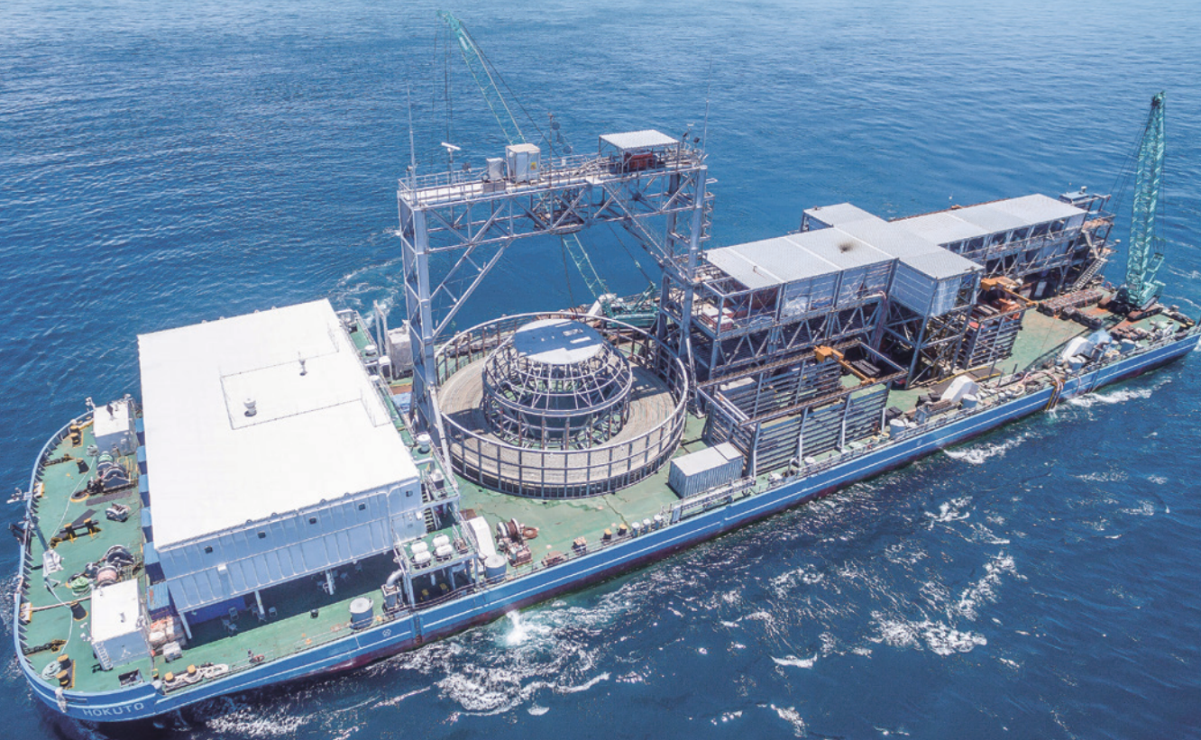
臺澎海纜的合聯，是台電公司近 20 年來的重大輸變電工程之一。