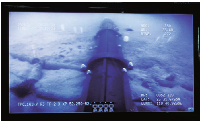
監視螢幕中海底纜線的明管放置於海床上。