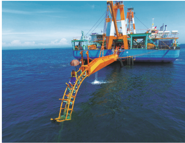
布纜船在深海處放置海纜。

長達 58.8 公里的海纜鋪設終於在民國 108 年登陸臺灣，在預計的 4 年當中如期完成。纜線鋪設回到陸地作業，臺灣端陸纜工程長達 8.8 公里，原以為回到台電同仁熟悉的陸上施作，能夠提前並順利完工，