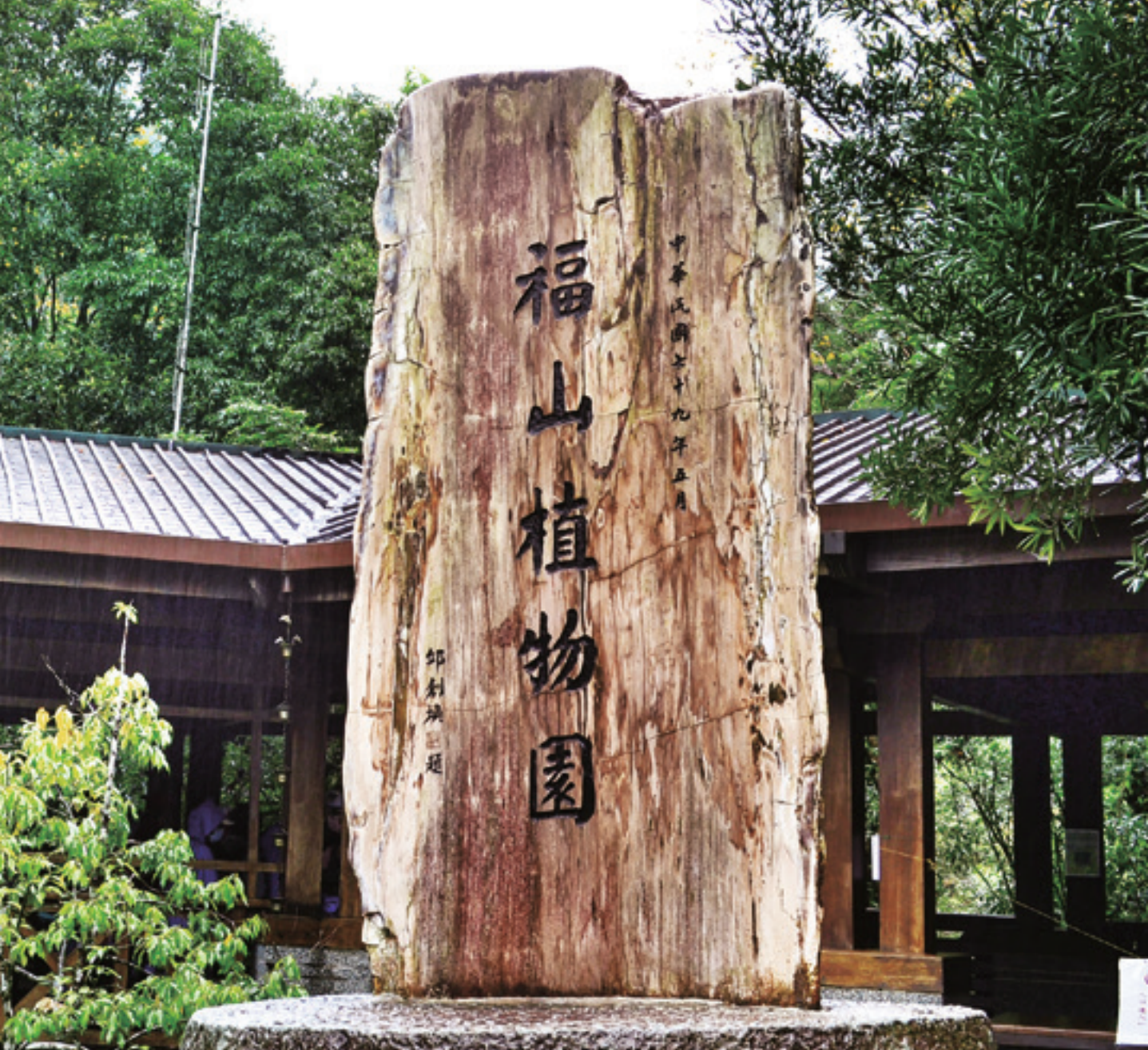
福山植物園的入口處，有一塊如巨人般高大的木化石，上面書寫著「福山植物園」幾個大字。

臺9甲線在開闢之初曾有一個響噹噹的別稱，叫做「新北橫公路」，最初規劃的路線是由新北市的新店經烏來通到宜蘭市區，藉以作為臺7線（又稱北橫公路）之外另一條橫貫北部的省道。然而工程從新店端築路至烏來的孝義之後，便因山區地形破碎複雜而難以延伸，計畫只能嘎然而止。同樣的，由宜蘭雙連埤西向烏來的