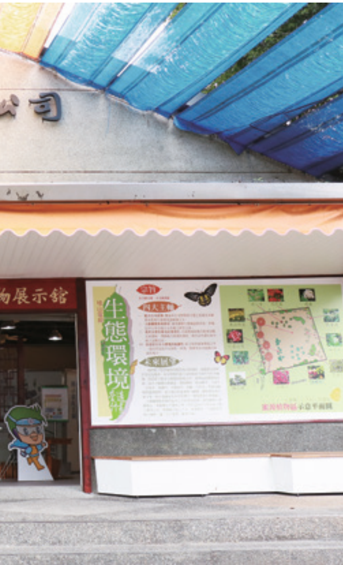
位於烏來地區的新店溪流域水力發電文物展示館。