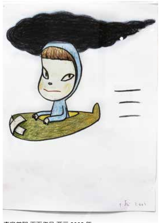
奈良美智 平面作品 西元 2002 年。

奈良美智完成於大地震那一年的〈萌芽(Sprout)〉(西元2011年)，是以壓克力原料畫於木板上。畫中的小女孩，身著黃橘色衣裳，低眉閉目，臉如滿月般微微泛紅，雙手護持一株小幼苗，雙腳直挺立，這位彷彿佇立大地，闔眼祈禱的女孩，好似心中默念著美國詩人華特·惠特曼的一行詩句—最小的新芽告訴我們，沒有死亡。而奈良美智所塑造的雕塑〈樅樹小姐(Miss Tannen)〉(西元2012年)，手的觸痕肌理歷歷可見，女孩豐厚的唇，圓潤的臉，雙眼渾圓，配上高聳如尖塔的頭髮，長髮如