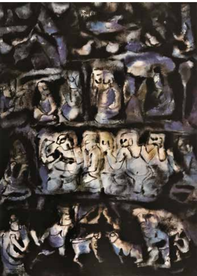
劉其偉 〈太平年〉西元 1967 年 水彩。

他是徹頭徹尾的工作狂，時時刻刻都在前進中，劉其偉說：「生命要用，才有價值。用它，等於活著；做了，也才是活到了。」而海明威寫《老人與海》不是憑空虛構，他在現實生活中早已經歷諸多出海釣魚的冒險經驗，甚至也釣過 1,000 多磅的大馬林魚，小說是他親身經歷的真實故事的藝術轉化。海明威小說中的主角都是「蔑視