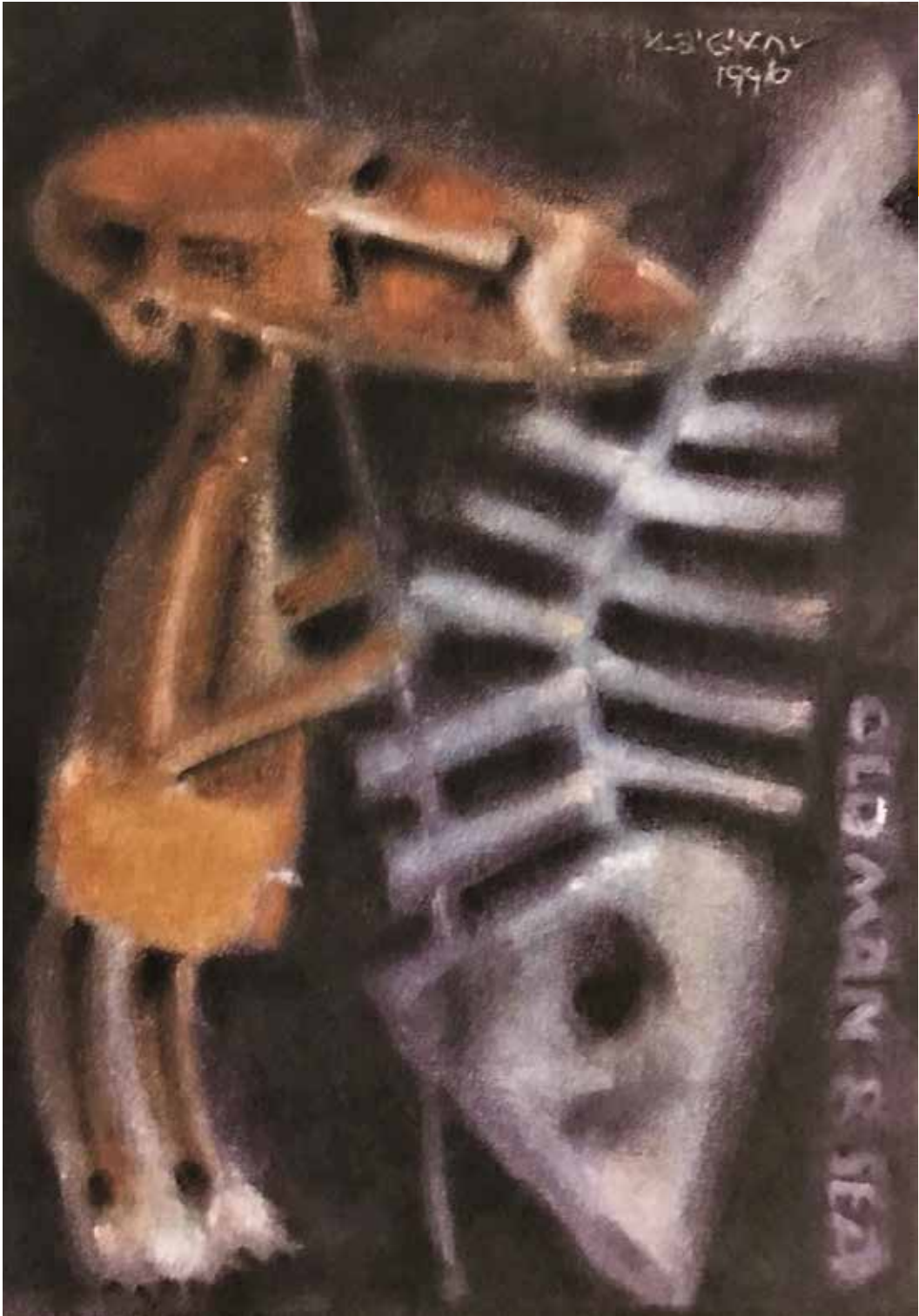
劉其偉 〈老人與海〉 西元 1996 年 混和媒材。