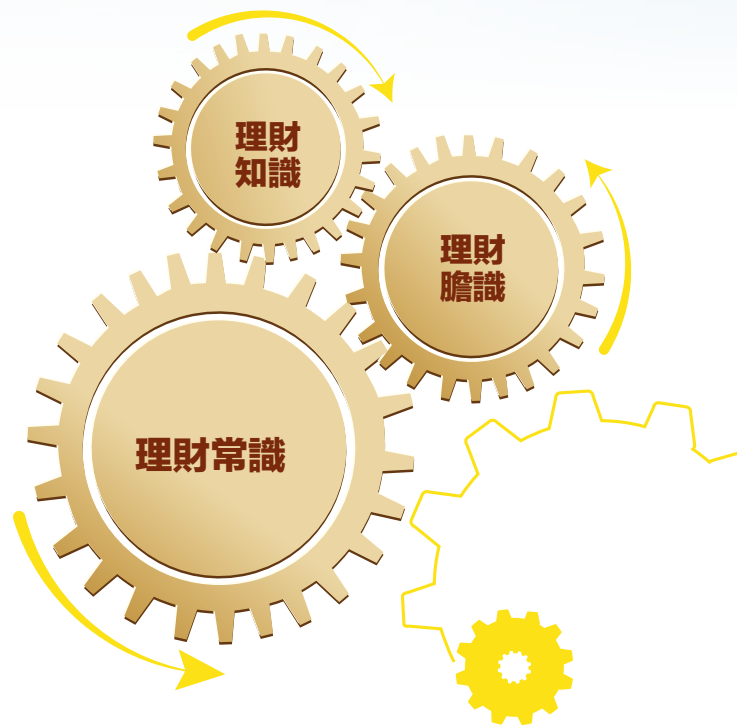
理財的概念來自於理財三識

達到財富自由一定要有方法，理財的概念來自於理財三識：要有常識、知識以及膽識。理財常識是基本，常識是指符合