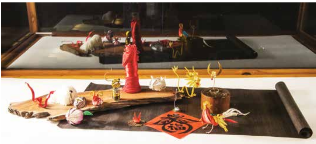
「從鼠開始」十二生肖創作象徵有始有終、事事如意。