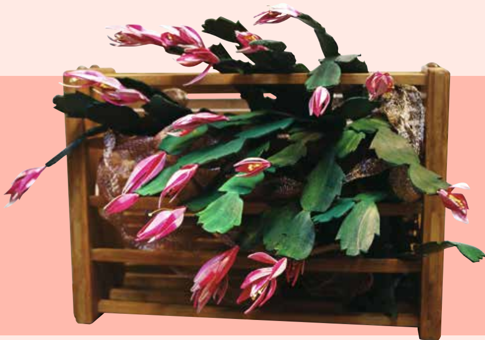
「生生不息」強調多媒材的複合運用，螃蟹蘭的葉子即由牛皮所製成。

若要追本溯源，纏花確切出現的年代已不可考，根據典籍資料記載，應於清朝時期即有纏花工藝的存在，主要運用於婚禮及年節喜慶等場合，由婦女配戴於髮上做為髮簪之用。到了民國時期，纏花依舊廣為流傳，在臺灣亦十分風行，且因不同的地域及風俗民情，各自發展出不同的特色與流派，包含閩南纏花、客家纏花及金門吉花三大系統。閩南纏花又稱「春仔花」，