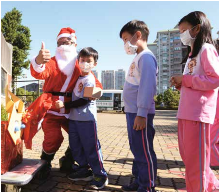
佳節來臨，孩子們總會期待著收到來自聖誕老人的禮物。